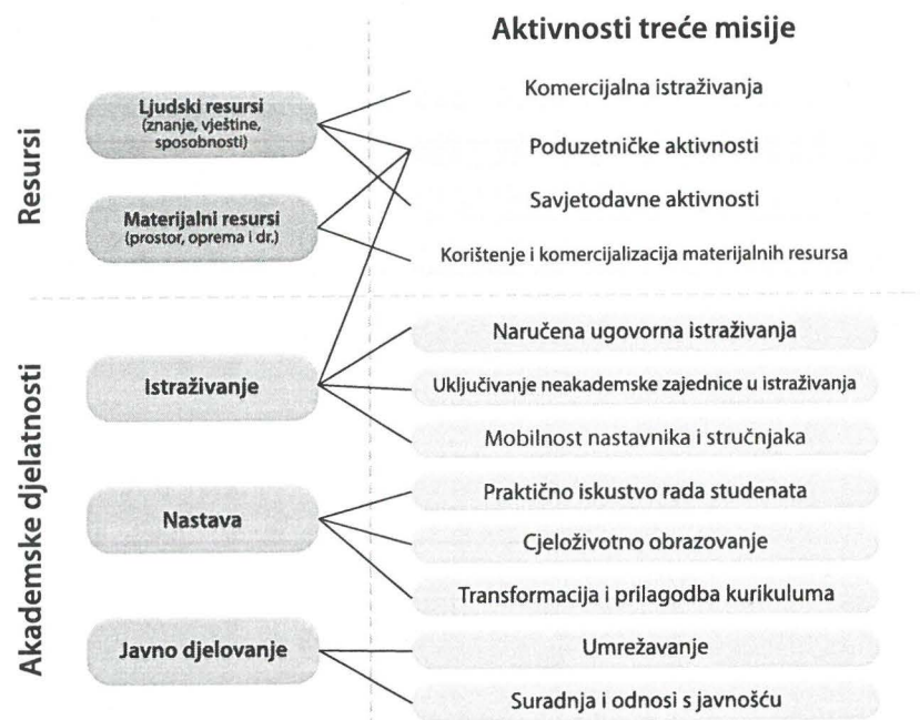
Slika 1. Konceptualni okvir za analizu aktivnosti treće misije (Molas-Gallart i sur., 2002)

Konceptualni okvir kojeg su razvili polazi od ideje da je suradnja sveučilišta s vanjskim okruženjem ono što čini bit treće misije. Sveučilišni ljudski i materijalni resursi, kao i temeljne akademske djelatnosti, mogu stoga doprinijeti snažnijoj interakciji sveučilišta s vanjskim okruženjem, razvojem različitih profitnih i neprofitnih suradničkih odnosa i aktivnosti. Razvijeno je dvanaest područja aktivnosti treće misije, a sveučilišnim resursima i akademskim djelatnostima pridružene su one korespondirajuće. Iako autori zagovaraju jednako uvažavanje obiju, ekonomske i društvene dimenzije treće misije, primjećuje se da je većina aktivnosti treće misije ipak usmjerena komercijalnim sadržajima te stjecanju dodatnih financijskih sredstava.