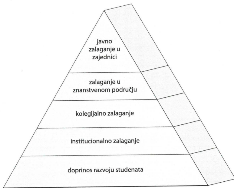
Slika 2. Piramida zajednica i pripadajućih aktivnosti javnog djelovanja (Macfarlane, 2007)

Suradnja sveučilišnih nastavnika sa studentima čini temelj piramide, ujedno dakle i njezino dno, predstavljajući najmanje cijenjeno područje djelovanja sveučilišnih nastavnika, a koje nerijetko oduzima najveći udio vremena u svakodnevnim nastavnim aktivnostima. Ovaj vid djelovanja uključuje široki spektar odgovornosti sveučilišnih nastavnika povezanih s akademskim i osobnim razvojem studenata. Iako je ispravno odijeliti stručnu akademsku podršku od brige za osobni razvoj studenata, Macfarlane (2007) podsjeća da se u svakodnevnom radu nastavnika ove odgovornosti i aktivnosti često isprepliću. Uglavnom uključuju aktivnosti kojima se iskazuje briga za studente, a koje su još uvijek "nevidljive" u sustavima vrednovanja rada sveučilišnih nastavnika i njihova napredovanja.