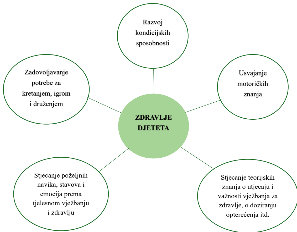
Slika 1. Ciljevi tjelesnog vježbanja (Maršić i Paradžik, 2005)

razumiju kako njihova tijela funkcioniraju i kako pravilno pristupiti tjelesnim aktivnostima. Jedan od ciljeva je usmjerenost na razvoj motoričkih vještina i koordinacije kroz fizičke aktivnosti. Razvoj motoričkih sposobnosti pomaže djeci u svakodnevnim aktivnostima.