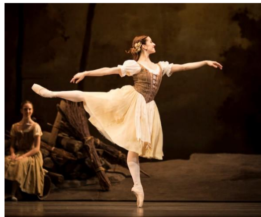
Slika 3 Prikaz baletne ravnoteže u baletnoj izvedbi Giselle, fotografkinja Helen Maybanks, fotografija iz 2018. godine

Možda kontrastan primjer baletu gdje plesačica ima neutralno lice, a poantu artikulira pokretom publici jest suvremena plesna izvedba Akumulacija Trishe Brown. 79 Trisha Brown je ujedno koreografkinja i izvođačica izvedbe Akumulacija . Ideja same izvedbe jest i njezin naslov -