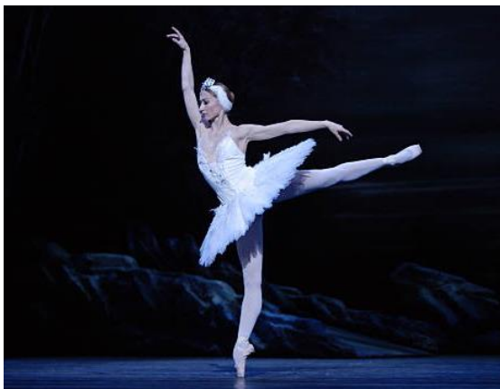
Slika 4 Prikaz baletne ravnoteže Odette u baletnoj izvedbi Labuđeg jezera u Londonu

se izvode baletni skokovi, piruete i ravnoteže. Zbog toga što lice u baletnoj izvedbi najjače izražava ekspresiju koja će potaknuti na poantu izvedbe, mogli bismo reći da je balet bliži glumi, nego plesnoj izvedbi gdje je plesačeva uloga utjeloviti značenje ili ideju izvedbe te ju artikulirati kroz pokret čija će ekspresija navesti promatrača na glavnu poantu izvedbe. U baletu je artikuliranje ideje pomoću pokreta te njegove popratne ekspresije koja će publiku navesti na ideju izvedbe neizvedivo jer balet već unaprijed ima formu kako pokret treba izgledati. Prednost u tome je što ga je lakše onda estetski vrednovati, no pitanje je kolika je težina u toj vrijednosti jer u tom slučaju balet ima težu mogućnost napredovanja kao plesne vrste i razvijanja novih pokreta, ali i ograničene su mogućnosti proživljavanja novih iskustva kod svakog plesača individualno. U baletu se ne dozvoljava prostor plesaču za njegovo karakteristično motoričko kretanje, a upravo je individualno kretanje plesača prema Percivalu prva komponenta u uspješnom prenošenju ideje koju plesač artikulira kroz pokret. Stav i kretanje baletnog plesača također mora ispunjavati formu uspravnog i elegantnog držanja koja se očekuje u baletu te je samo kretanje i izvođenje pokreta na primjer u prijenosu težine s noge na nogu, također određeno baletnom formom. Baletna forma dakle nameće plesaču neprirodno kretanje u njegovom vlastitom tijelu te tako sprječava individualno izražavanje samog izvođača.