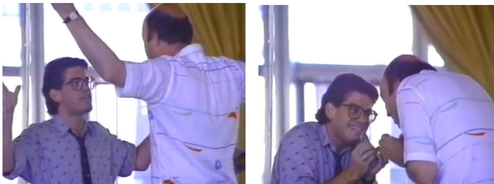
Slika 6 Prikaz imitacije pokreta raširenih ruku koja asocira na ideju ogledala, snimka zaslona iz videozapisa „mirror speech“ iz 2012. godine na You Tube-u u kojem Viola Spolin objašnjava ideju ogledala kroz pokret

Promatrač gledajući prvi pokret koji se ponavlja, može se pitati što se ovim pokretom želi reći, ali mu neće biti jasno sve dok se ne odvije svaki idući složeniji pokret u slijedu pokreta. Svakim složenijim pokretom promatrač uočava i njegovu novu ekspresiju, odnosno promjenu izgleda svakog nadolazećeg pokreta. Svakim „nadograđenim“ pokretom promatrač dobiva informaciju da pokret kroz izvedbu postaje sve složeniji i da se pokreti nakupljaju, što je ujedno i ideja same izvedbe. Artikulirati ideju kroz pokrete može izvoditi i više plesača. U primjeru plesne izvedbe Ogledala Viola Spolin plesni pokreti su sinkronizirani te plesači u paru međusobno kopiraju i odražavaju tuđe pokrete putem čega ekspresija zrcaljenja plesača promatrača može asociirati na ogledalo, što je ideja same izvedbe. Možemo zaključiti iz navedenog da ekspresija u ovom radu ima pomoćnu ulogu u komunikaciji ideje koju plesač pokušava prenijeti artikulirajući ideju kroz pokret.