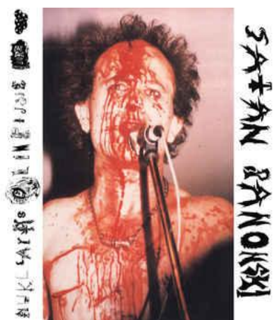
slika 2. Nuklearne olimpijske igre

Dvije godine nakon prvijenca uslijedio je album Nuklearne olimpijske igre . Navedeni album objavio je Zdenko Franjić za svoju diskografsku samoinicijativu Slušaj najglasnije . Album obiluje veličanjem raznih anomalija i ekscentričnih ponašanja (Jurkas 2010: 165). Sadrži čak dvadeset i tri pjesme, no moramo imati na umu da se mnoge od njih zapravo ponavljaju s prvijenca ( Oči u magli, Iza zida, Kliktaj, Lepi Mario, Odreži, nareži, zareži, Misli li istok, Trpi kurvo, Obdukcija ), tako da je zapravo trećina pjesama koje ovaj album donosi zapravo prerada onih koje donosi prvi album. Od značajnijih pjesama izdvajaju se Kamikaza, Odrežite sise, Slavica, Advokat, Seksualni distonalitet i Čaj od maka . Jedna od važnijih stvari vezanih za ovaj album je njegova naslovnica koja prikazuje Čuljka u uobičajenom stanju na njegovim nastupima.