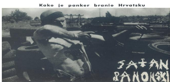
slika 3. Kako je panker branio Hrvatsku