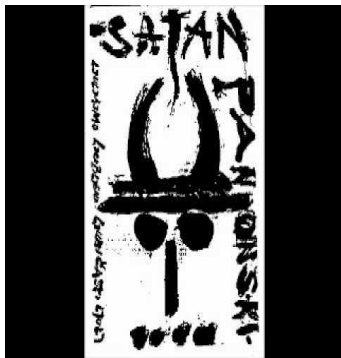
slika 1. cover albuma Ljuljamo ljubljani ljubičasti ljulj

Prvi samostalan album je Ljuljamo ljubljani ljubičasti ljulj iz 1989. godine. Na albumu se nalazi čak šesnaest pjesama među kojima je i „nenadmašni“ Lepi Mario . Od uvjetno rečeno poznatijih pjesama na albumu se još nalaze i Oči u magli , te Iza zida . Radi se većinom o kratkim punk pjesmama (najkraća traje samo nešto malo više od pola minute, a najduža pet minuta).