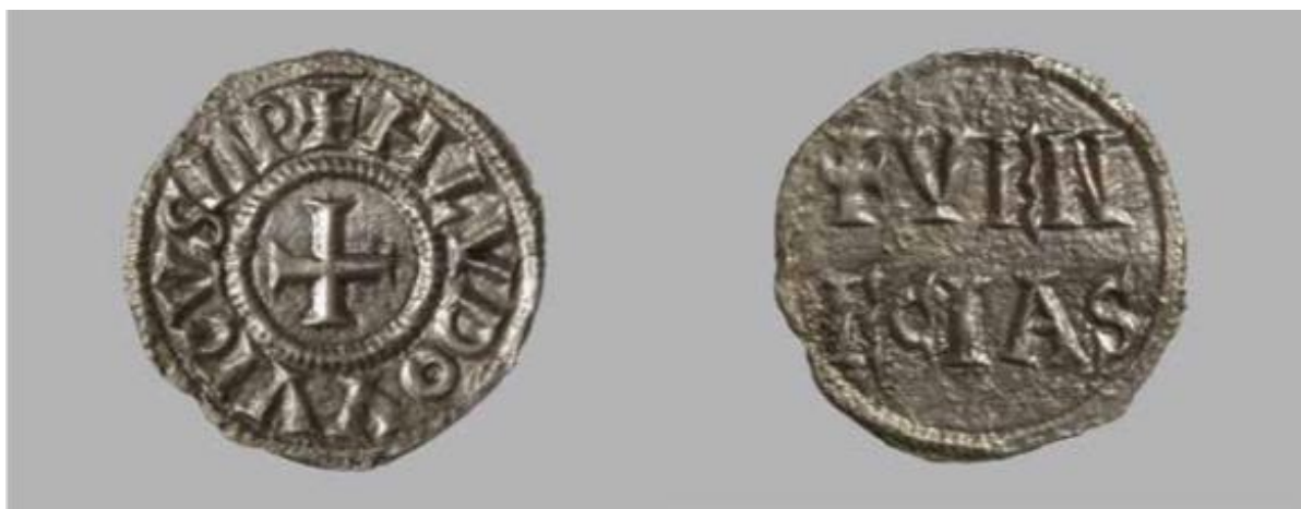
Slika 4: Avers i revers denara iz Bajagića (Šeparović 2021, 234.)

primjerak iz vremena Ludovika Pobožnog kovan i izdavan u optjecaj specifično između 822. i 840. godine i da je bio prisutan u svim dijelovima franačke države. Nadalje ističe da su slova i slika hrama pravilno izvedeni što je usklađeno s uniformnosti, većim udjelom srebra i visokom kvalitetom izrade novca za vrijeme vladanja Ludovika Pobožnog. 46 Ipak, glavna problematika novca tipa Christiana Religio koja ga razlikuje od drugih tipova franačkog novca je takva da na njima nema oznake kovnice zbog čega nije baš lako odrediti mjesto kovanja. Mjesto kovanja tog tipa novca numizmatičari uglavnom približno određuju usporedbom stila, ali Šeparović se oslanja na Couplandovu pretpostavku da je ovaj tip novca, a s time i primjerak iz Donjih Lepura, kovan u Veneciji. 47 Ta pretpostavka se temelji na komparaciji novca iz ostave Hermanches u kojoj je nađeno čak 300 primjeraka denara tipa Christiana Religio i primjeraka novca venecijanskog kova Deus conserva Romanorum imperium / Christe salva Venecias . Šeparović smatra da je primjerak iz Donjih Lepura relativno sličan primjercima denara tipa Christiana Religio nađenima u ostavi iz Hermanchesa i da je zbog toga moguće da je i primjerak iz Donjih Lepura također kovan u Veneciji. 48