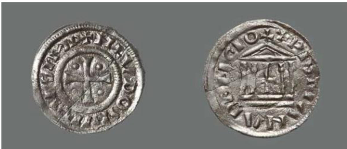
Slika 3: Avers i revers denara iz Donjih Lepura (Šeparović 2012, 36.)