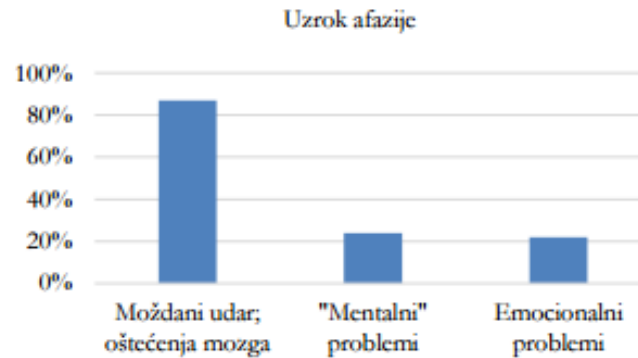
Slika 1. Uzroci afazije

živčanim stanicama te na taj način ugroziti jezične sposobnosti. S obzirom na malu svijest ljudi o afaziji, bitno je naglasiti da se ista može steći pri nagomilanim svakodnevnim stresnim situacijama.