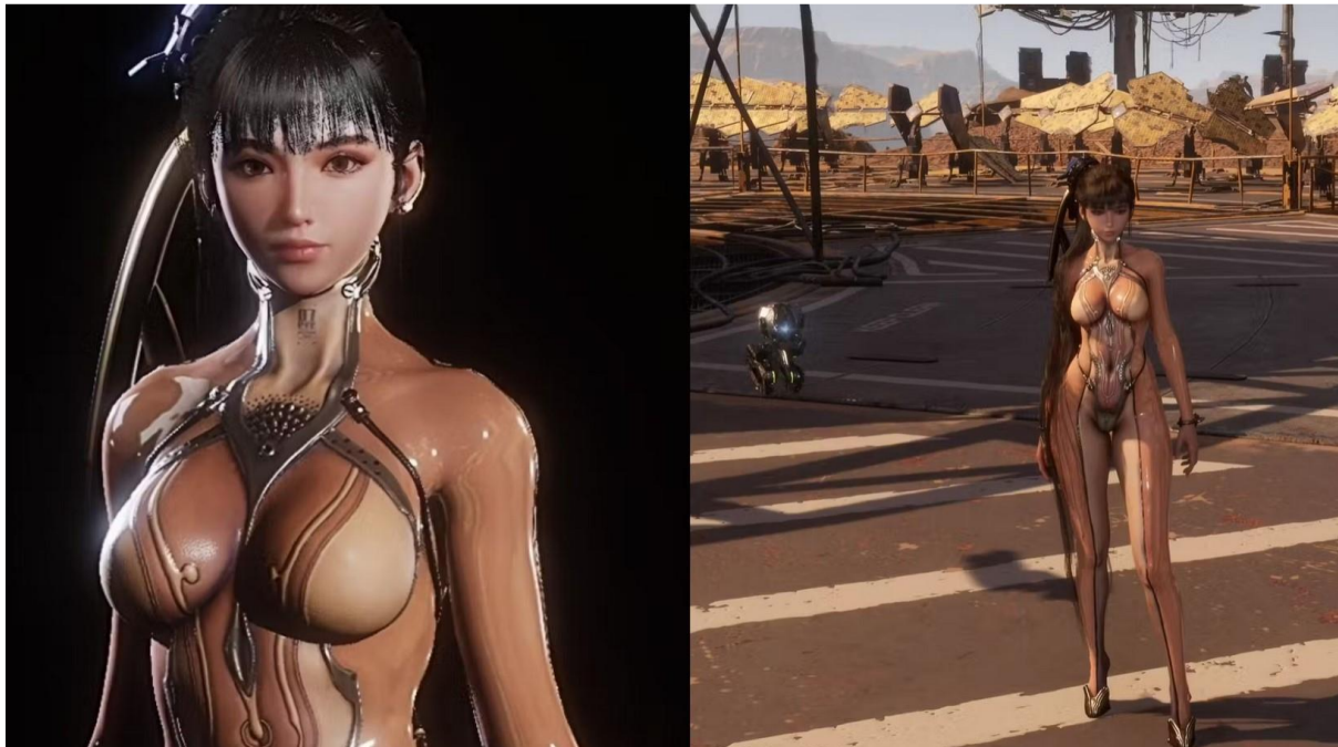
Slika 2 Skin Suit na protagonistkinji EVE igre Stellar Blade (SHIFT UP, 2024)

igra postaje teža. Skin Suit, dakle, tjera igrače da se suočavaju s većom razinom opasnosti i rizika, ali kompenzira to konstantnim pogledom na EVE-ino gotovo golo tijelo.