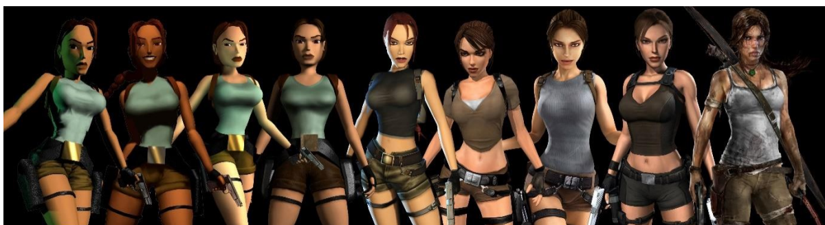
Slika 9 Evolucija Lare Croft 1996.-2013.