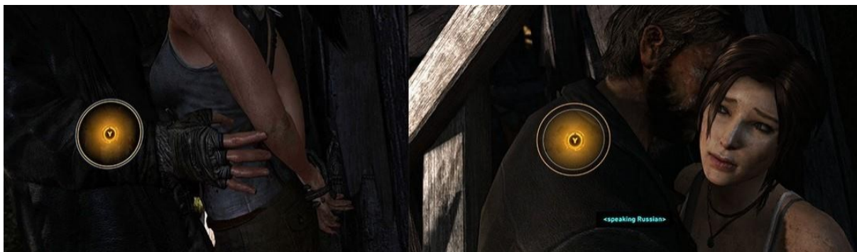
Slika 7 Scena iz igre s mjesta Mountain Temple