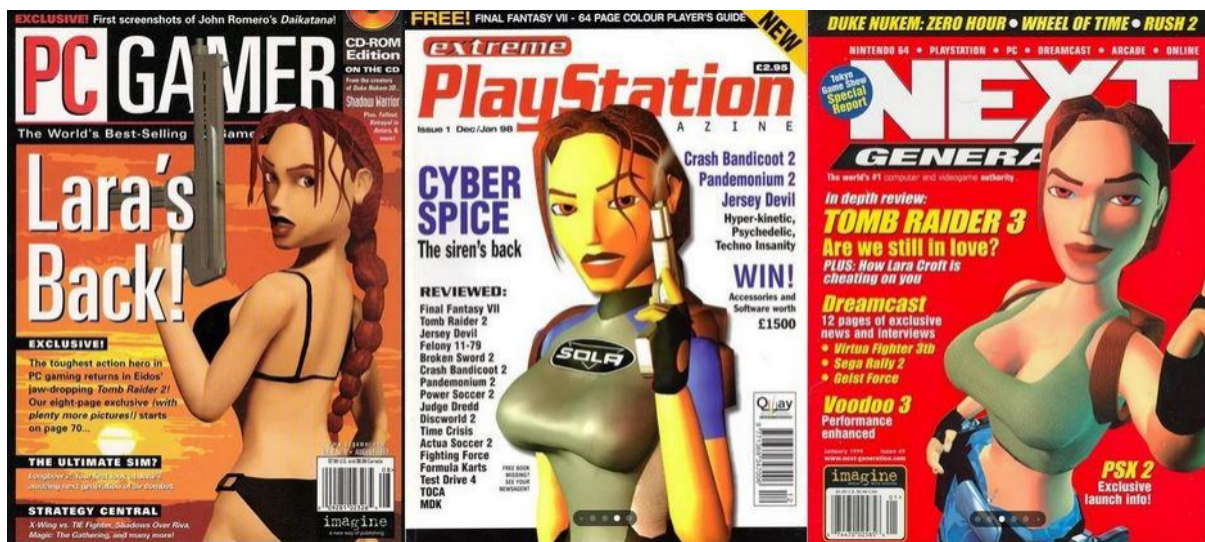
Slika 8 Lara Croft na naslovnicama gaming časopisa PC Gamer, Extreme PlayStation i Next Generation