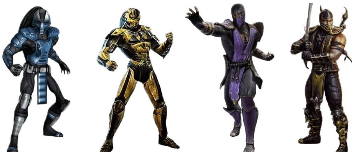
Slika 4 Igrivi muški likovi borilačke igre Mortal Kombat 9 (NetherRealm Studios, 2011)

Downs i Smith u istraživanju iz 2010. godine su proučavali seksualne teme u igrama gdje su pokazali da je unutar 60 igara muškarac (86%) prikazan u dominaciji nad ženom (14%) (Downs, Smith, 2004: 723). Žene su, kao što potvrđuju i preostala istraživanja, uglavnom prikazane hiperseksualizirano, djelomično nage ili obučene u odjeću koja naglašava nerealistične ženske atribute. Prethodna istraživanja pokazuju da je tijekom dugačkog vremenskog perioda u videoigrama prevladavala dominacija muških stereotipnih likova dok su ženski likovi prikazani u submisivnoj ulozi. Ideja za koju mnogi vjeruju da stoji iza takvih praksi prikazivanja ženskog tijela je ono što Laura Mulvey naziva – male gaze. Drugim riječima, to je vjerovanje da proizvođači videoigara namjerno prikazuju hiperseksualizirane ženske likove ne bi li kod muške publike stimulirali pogled. Taj koncept u knjizi “Visual Pleasure and Narrative Cinema”, 1975. godine razvija Laura Mulvey u kontekstu prikazivanja