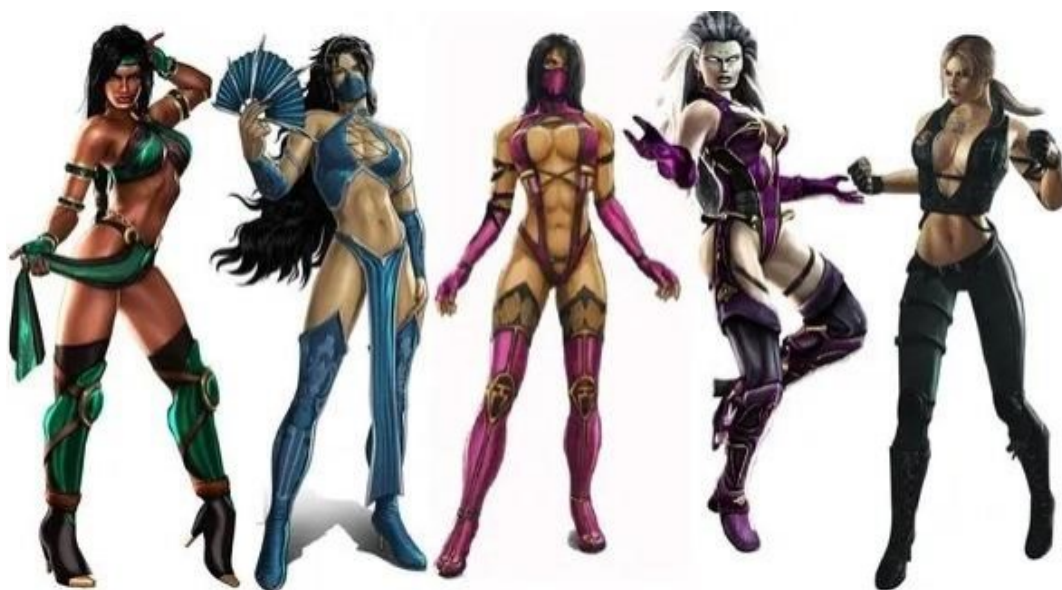
Slika 3 Igrivi ženski likovi borilačke igre Mortal Kombat 9 (NetherRealm Studios, 2011)