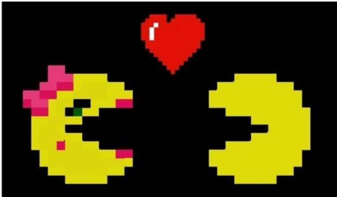
Slika 1 Ms. Pac-Man i Pac-Man

kao što su “Djeva u nevolji”, “Gospođica Muško”, “Štrumpfeta”, “Prirodno rođena sretna domaćica” i “Seksi akcijska heroina” te govori da upravo ti tropi uporište nalaze u ostacima zastarjelog patrijarhalnog sistema (Trépanier-Jobin, 2017: 25). Jedan od primjera toga je stereotip “Gospođica Muško” u čijem slučaju dizajneri igre, umjesto stvaranja izvornog ženskog lika s vlastitim značajkama, pretvaraju već postojeći muški lik u ženski dodavanjem takozvanih „ženskih atributa“ izvornom liku, ističe Trépanier-Jobin i dodaje kako takvi atributi omogućuju igračima da brzo identificiraju lik kao ženski, dok njezinu osobnost reduciraju na njezinu "djevojačnost" i pojačavaju rodne binarnosti. Neki od likova koje ističe kao primjer su Ms. Pac-man (Pac-Man, Namco, 1980), Amy Rose (Sonic the Hedgehog, Sega, 1993), Dixie Kong (Donkey Kong Country 2, Nintendo, 1995), Toadette (Mario Kart Double Dash!!, Nintendo, 2003), MeeMee (Super Monkey Ball: Banana Splitz, Sega, 2012) i Pretty Bomber (Super Bomberman R, Konami, 2017).