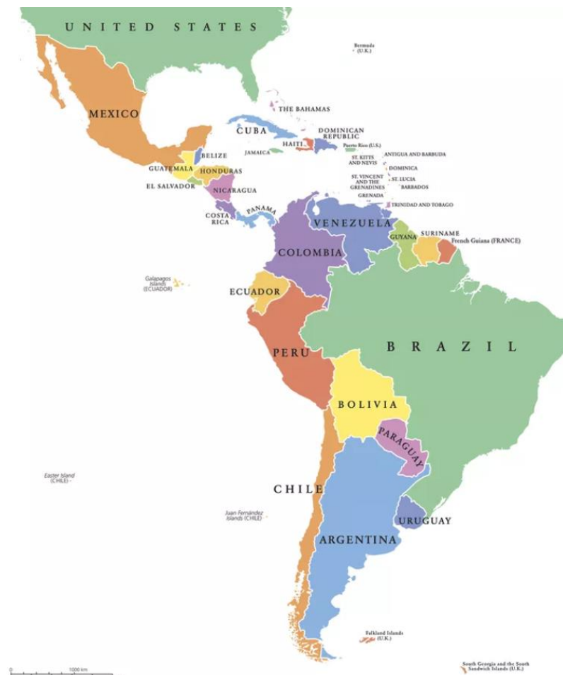
Slika 1: Prikaz svih država Latinske Amerike