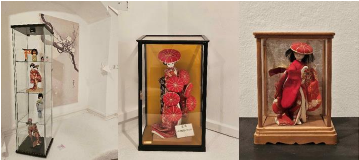
Slika 4 – Japanske lutke (Izložba „Moj Japan“)