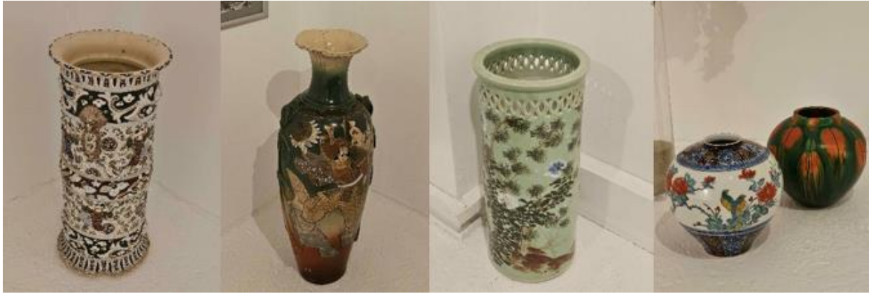
Slika 3 – Japanske vaze (Izložba „Moj Japan“)