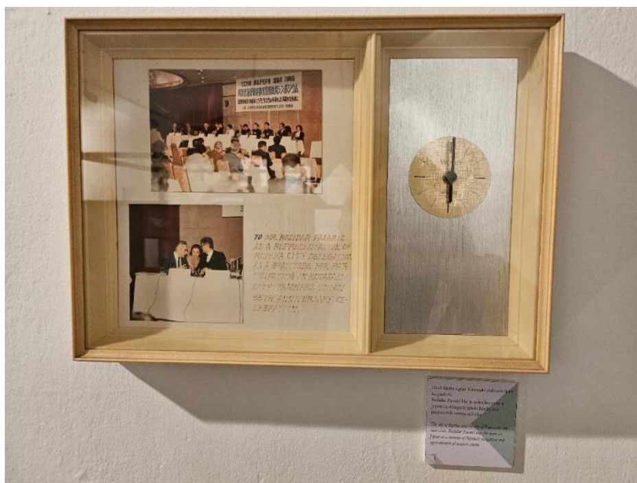
Slika 1 – Poklon japanske delegacije gosp. Božidaru Pasariću nakon njegova posjeta Kawasaki 1970-ih (Izložba „Moj Japan“)