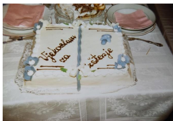
Slika 1.- 4. Fotografije torti iz obiteljskog albuma