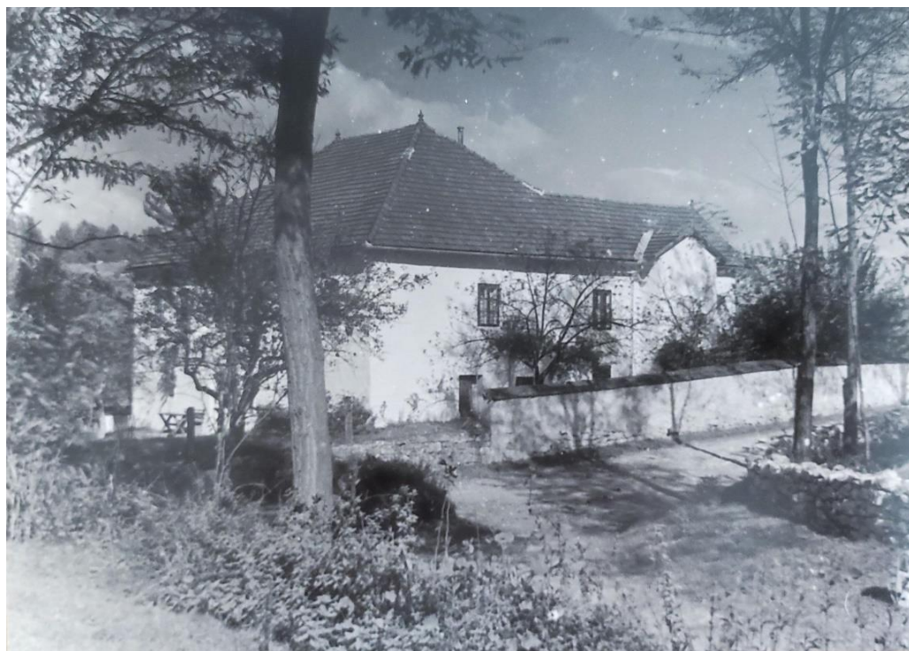
Slika 19: Fotografija dvora u Lipi