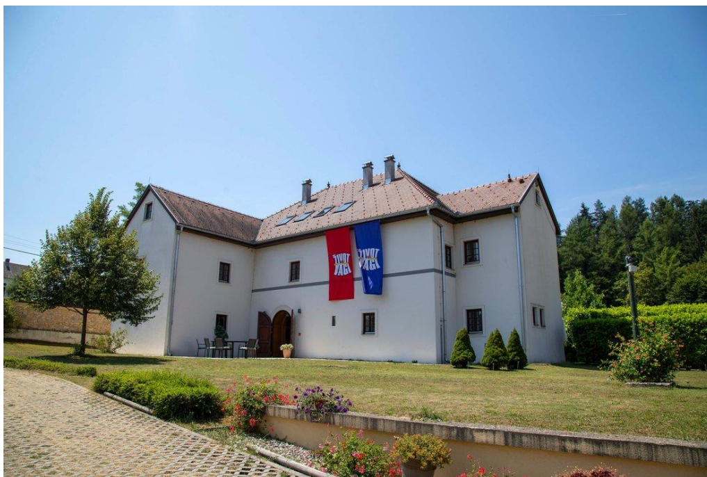
Slika 18: Fotografija dvora u Lipi za vrijeme tv show-a 'Život na vagi'