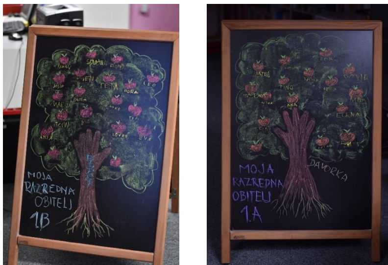
Slika 5 i Slika 6: Fotografije razrednog obiteljskog stabla

Istraživanja u vizualnoj antropologiji postaju interaktivnija zahvaljujući konceptima poput kibernetike, odnosno sustava koji, bilo tehnički, biološki ili društveno, funkcioniraju i komuniciraju putem povratnih informacija. To znači da istraživači i sudionici mogu aktivno sudjelovati u procesu istraživanja, dijeleći povratne informacije i prilagođavajući metode u hodu (El Guindi, 2004). Primjerice, obitelj koristi digitalni fotoaparata za snimanje obiteljskih fotografija. Nakon što snime fotografiju, odmah je pregledavaju na ekranu fotoaparata, što označava povratnu informaciju. Ako nisu zadovoljni rezultatom, mogu prilagoditi fotografske elemente i snimiti novu fotografiju. Kibernetički pristup omogućuje im da kontinuirano poboljšavaju svoje fotografije kroz ciklus povratnih informacija i prilagodbi.