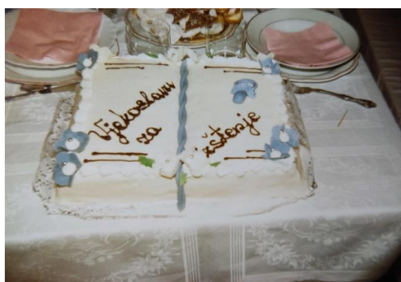
Slika 1.- 4. Fotografije torti iz obiteljskog albuma