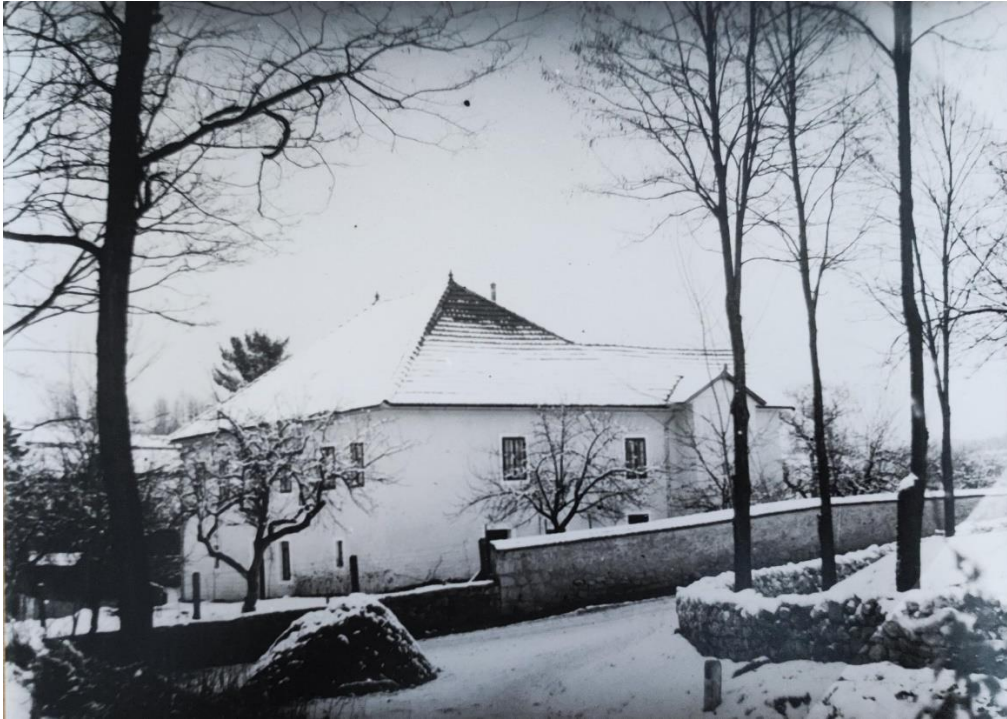
Slika 20: Fotografija dvora u Lipi

Osim što su obiteljske fotografije u kontrastu, tu su i slike dvora u Lipi, koji označava centar i glavnu točku mjesta. Ove obitelji su se slikale ispred njega, što dodatno naglašava njegovu važnost. Osim kontrasta između novih i starih obiteljskih slika, važan je i kontrast između slika samog dvora kroz različite vremenske periode.