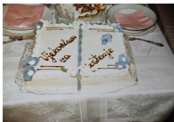
Slika 1.- 4. Fotografije torti iz obiteljskog albuma