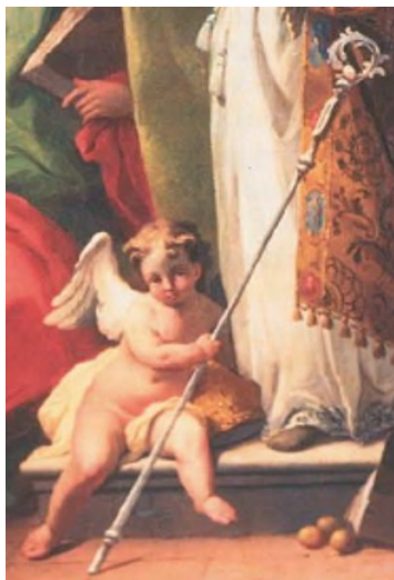
Slika 16. Giambattista Canal?, Presveto Trojstvo sa svecima (detalj), zadnja četvrtina 18. stoljeća, ulje na platnu, 16 x 83 cm, župna crkva Navještenja Marijina, Svetvinčenat

Slikar pale Presveto Trojstvo sa svecima oslanja se na motive i tipologiju likova Sebastiana Riccija. Anđelić s pastoralnim štapom u prednjem planu kompozicije prepoznatljiv je motiv koji potječe iz Riccijevih sakralnih kompozicija, a koje često preuzimaju njegovi sljedbenici, poput Gaspara Dizianija i Jacopa Marieschija. Izrazito svijetla paleta boja, pomalo shematizirani likovi kao i preuzimanje različitih motiva iz Riccijeva i Dizianijeva opusa ukazuju na eklektičnog majstora druge polovice settecenta . Karakteristike slike navode Višnju Bralić da priše sliku iz Svetvinčenta Francescu Maggiottu temeljem sličnosti u oblikovanju prikaza Svetog Trojstva s lošinjske slike. 239