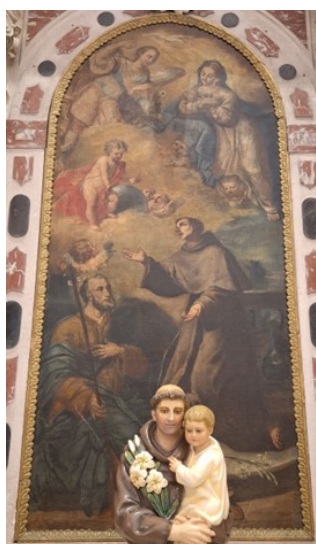
Slika 2. Gaspare Diziani, Navještenje sa sv. Josipom i sv. Antunom , oko 1750., ulje na platnu, župna crkva Sv. Jeronima, Kaštel Gomilica