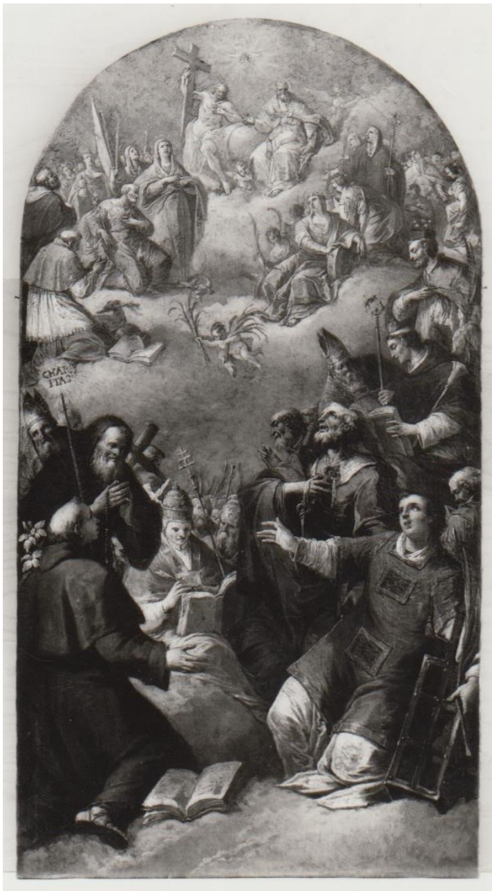
inv. 48863