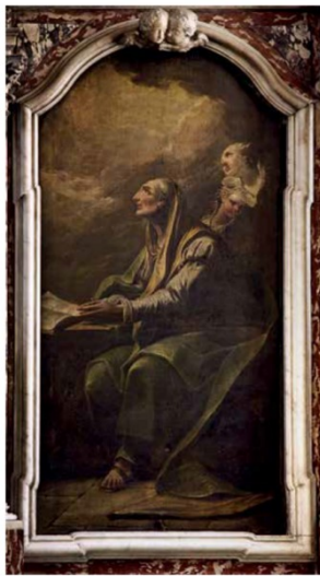
Slika 8. Giuseppe Diziani, Sv. Ana u molitvi , 1766.-68., ulje na platnu, 210 x 100 cm, crkva sv. Jeronima, Rijeka

Nešto slobodnijeg izraza nego Bogorodica od Ružarija sa svecima , prikaz sv. Ane otkriva utjecaj Gaspara Dizianija. Slika prati kompozicijska rješenja Dizianijeva slikarska repertoara, a smještaj svete između zemaljske sfere popločanog poda te one nebeske u gustim pozadinskim oblacima podsjeća na slike iz San Vito al Tagliamento , Trevisa i Završja . 187 Navedene karakteristike sugeriraju da je Giuseppe u vrijeme nastanka slike Sv. Ana u molitvi bio i dalje pod snažnim utjecajem oca. Fizionomija svete, kao i oblikovanje teške draperije, asocira na Giuseppeova djela iz Santa Maria delle Grazie u Udinama iz sedmog desetljeća 18. stoljeća. 188 Istodobno, vrlo slične anđeoske glavice pojavljuju se na već spomenutom prikazu Bogorodice sa sv. Antunom Opatom iz sakristije katedrale u Cividaleu.