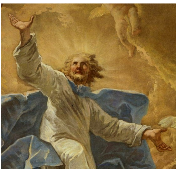
Slikovni prilog 13. Gaspare Diziani, Uznesenje Krista (detalj), 1750.-55., ulje na platnu, 137 x 107 cm, Ca' Rezzonico - Pinacoteca Egidio Martini