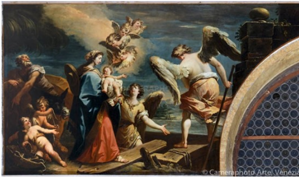
Slikovni prilog 3. Gaspere Diziani, Bijeg u Egipat , 1733., ulje na platnu, crkva Santo Stefano, Venecija

dekoracija, kao i sakralnim temama. 115 Tijekom tog razdoblja, između 1730. i 1740. godine, Dizianijev stil podijeljen je na dvije struje. Prva od njih obilježena je kasnobaroknim slikarstvom te označava period od 1730. do 1735. godine. Direktan utjecaj Sebastijana Riccija u ovoj fazi vidljiv je kroz snažno impasto slikarstvo, plasticitet likova, široku paletu boja s jakim kontrastima te dramatične kompozicije kao što je to na prikazima iz Starog i Novog zavjeta koje Diziani radi 1733. godine za crkvu Santo Stefano u Veneciji. 116 U prikazima Palluchini zamjećuje slikarov interes za Tintorettova djela na što se prethodno osvrnuo i Da Canal. 117 Dizianijeva sklonost prema Tintorettovom dramatičnom kjaroskuru, Palluchini tumači kao odmicanje od težnje venecijanskih umjetnika za oponašanjem „maniere Paolesce“. 118