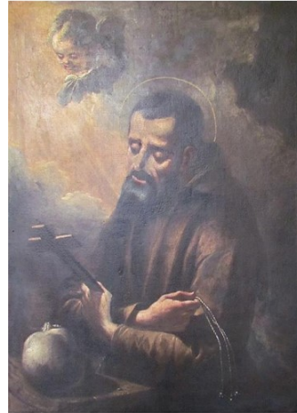
Slika 10. Giuseppe Diziani, Sv. Bernard iz Corleonea , oko 1768., ulje na platnu, 99 x 71 cm, blagovaonica kapucinskoga samostana, Karlobag