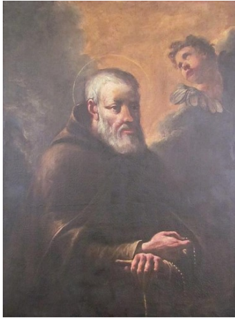
Slika 9. Giuseppe Diziani, Sv. Krišpin iz Viterba , oko 1768., ulje na platnu, 95 x 70 cm, blagovaonica kapucinskoga samostana, Karlobag

prikazu Uznesenja Bogorodice, također iz prezbiterija katedrale u Cividaleu, pokazuje sličnosti s onim na slici Sv. Krišpin iz Viterba u Karlobagu. Međutim, zbog neprimjerenih restauratorskih radova na slikama iz kapucinskog samostana u Karlobagu teško je iščitati njihovo autorstvo, osim što ih je moguće približiti radionici Gaspara Dizianija.