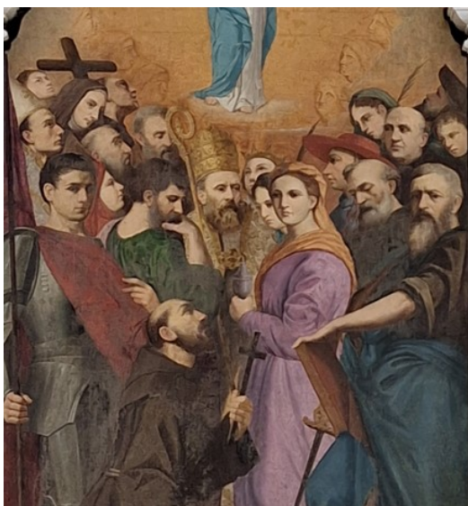
Slika 15. Francesco Maggiotto, Svi Sveti (detalj), 1772., ulje na platnu, ?, župna crkva Svih Svetih, Hrvace (Sinj)