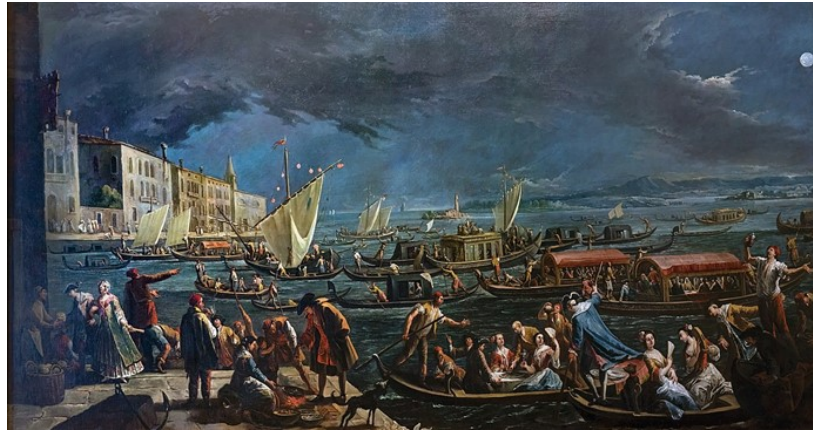
Slikovni prilog 11. Gaspere Diziani, Blagdan svete Marte , 1750.-55., ulje na platnu, 167 x 329 cm, Ca' Rezzonico, Venecija

No, prvenstveno Diziani je slikar oltarnih pala koja su obilježena sentimentalno-devocionalnim izrazom, u skladu s ukusom onodobnog sakralnog slikarstva. 132 Posljednja umjetnikova djela obilježena su monumentalnim scenama s ritmično nizanim likovima koji čine cik-cak kompozicije. Potez kista više ne odvaja boju, a ekspresivna snaga prikaza postepeno blijedi, posebice u kromatskom izražaju. 133 Akademizam posljednjeg razdoblja Dizianijeva djelovanja uzrokuje stvaranje konvencionalnih kompozicija i ustaljenih prikaza. Međutim, u isto vrijeme, jača njegova dekorativna sposobnost u kojoj se otkriva umjetnikov izvorni talent. 134 Njegova izražajnost i dalje je prisutna u skici koja pokazuje Dizianijeve najbolje kvalitete. Prema Palluchiniju, Gaspere Diziani u poziciji crtača nadmašuje svoju ulogu kao slikara, upravo zbog formulacije crteža koji je toliko spontan i žustar da ponekad izgleda kao da „treperi“, dok njegovo prevođenje na platno ponekad postane ukočeno i gubi svoju eleganciju. 135