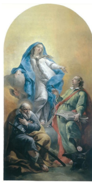
Slikovni prilog 40. Giambattista Canal, Immaculata sa sv. Ivanom Evandelistom i sv. Josipom , prije 1797., ulje na platnu, 257 x 132 cm, Duomo di San Nicolò, Motta di Livezna