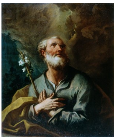
Slika 6. Gaspere Diziani, Sv. Josip , oko 1740., ulje na platnu, 100 x 90 cm, Pomorski i povijesni muzej Hrvatskog primorja, Rijeka

Zbog manjka informacija o podrijetlu slike, njezinu je dataciju za sada moguće samo predložiti putem stilske analize djela. Da je riječ o djelu Gaspara Dizianija potvrđuje niz morellijanskih detalja koji se uočavaju na drugim majstorovim djelima. Slično je oblikovanje kratke brade s brkovima, naboranog čela, snažne muskulature vrata te karakteristično formiranje uha u obliku slova „S“ vidljivo na crtežima studije muške glave iz Museo Correr iz prve četvrtine 18. stoljeća. 174 Također, lik sv. Josipa prati uobičajenu slikarovu tipologiju, a kao primjeri mogu se predložiti istoimeni svetac s oltarne pale iz katedrale u San Vito al Tagliamento te prikaz sv. Augustina na bozzettu koje se čuva u Museo Correr. Niz podudarnosti s prikazom sv. Josipa pokazuje već spomenuto djelo Sv. Josip sa sv. Ivanom Krstiteljem iz Ca' Rezzonico u Veneciji, na kojem je prisutan identičan je stav prikazanih likova te dinamična tmurna pozadina s mnoštvo oblaka.