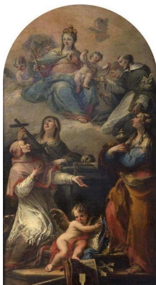
Slikovni prilog 30. Jacopo Marieschi, Bogorodica s bl. Lovrom Giustinianijem , 1752.-55., ulje na platnu, 297 x 146 cm, Chiesa di Santa Maria delle Penitenti, Venecija