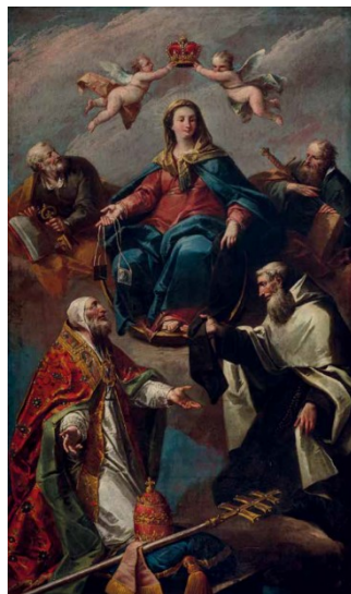
Slika 12. Jacopo Marieschi, Gospa od Karmela sa sv. Šimunom Stockom, papom Honorijem III. i sv. Petrom i Pavlom , oko 1750., ulje na platnu, 193 x 114 cm, župna crkva sv. Katarine Aleksandrijske, Novalja (Pag)

Najveću sličnost u kromatskom izražaju i tipologiji likova s novaljskom palom nalazimo u ciklusu slika koje Marieschi izrađuje oko 1743. godine za crkvu Santa Maria delle Penitenti u Veneciji. 210 Fizionomija Djevice Marije bliska je istoimenom liku na slici Bogorodica sa sv. Lovrom Giustinianijem i svecima koja je nekada stajala na glavnom oltaru navedene venecijanske crkve. U fizionomiji starijih muških likova posebno se ističu sličnosti sv. Šimuna Stocka i Honorija III. s prikazom Boga oca na slici Presveto Trojstvo također iz Santa Maria delle Penitenti. Navedeni likovi, međutim, deriviraju iz fizionomije Riccijevih i Dizianijevih likova. Primjerice lik pape Honorija III. podsjeća na sv. Augustina na Dizianijevoj slici Sveti Augustin pobjeđuje herezu koja se danas čuva u Gallerie dell'Accademia u Veneciji, kao i prikaz sveca na djelu istog autora Sv. Franjo Paulski i sv. Katarina Sijenska iz privatne kolekcije u Milanu. Iako Marieshi praktički do smrti svoga učitelja slijedi njegov stilski izričaj, vjerno prateći tipologije likova i kompozicije, faktura ovih dvaju slikara se bitno razlikuje. Dizianijev gust i brz potez kista, Marieschi zamjenjuje preciznim nanosom boje koji na svjetlu postiže svilenkast efekt. 211