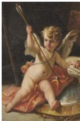
Slikovni prilog 18. Gaspare Diziani, Uznesenje Bogorodice sa sv. Gervazijem, Protazijem i Karlom Boromejskim (detalj), 1750-60., ulje na platnu, Chiesa dei Santi Gervasio e Protasio, Belluno