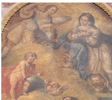
Slika 2. Gaspare Diziani, Navještenje sa sv. Josipom i sv. Antunom (detalj), oko 1750., ulje na platnu, župna crkva Sv. Jeronima, Kaštel Gomilica