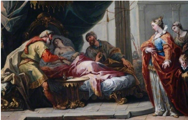
Slikovni prilog 7. Gaspere Diziani, Antioh i Stratinika , 1735.-45., ulje na platnu, 55,9 x 88,3cm, The Bowes Museum, Bernard Castel

fresaka u Castelfrancu iz 1747. godine. U prikazima se gubi do tada prisutna patetična i mračna Bencovich – Piazzetta struja te se popularizira ona Giambattiste Tiepola. 125 Toj fazi pripadaju djela Antioh i Stratinika iz 1735.-45. godine te Trijumf Amfitrite , datirano oko 1740. godine, koja su prepuna kontrastnih zasićenih boja i energične kompozicije. 126