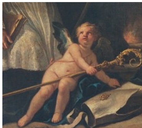
Slikovni prilog 38. Gaspare Diziani, Sveti Antun opat sa svecima , 1757., ulje na platnu, 307 x 163,8 cm, Chiesa di San Floriano, Storo