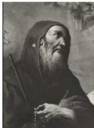
Slikovni prilog 18. Gaspare Diziani, Sveti Franjo Paulski i Sv. Katarina Sijenska (detalj), 2. polovica 18. stoljeća, ulje na platnu, 130 × 102 cm, privatna kolekcija Scaglia Mario, Milan