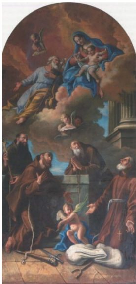
Slika 17. „Slikar kapucinske crkve“, Sveta Obitelj s četiri sveta kapucina , oko 1768., ulje na platnu 284 x 147 cm, župna crkva sv. Blaža, Vodnjan

oblika i repetitivnost nabora draperije na vodnjanskoj pali sugeriraju da je riječ o eklektičnom majstoru puno slabijeg likovnog izraza. 253