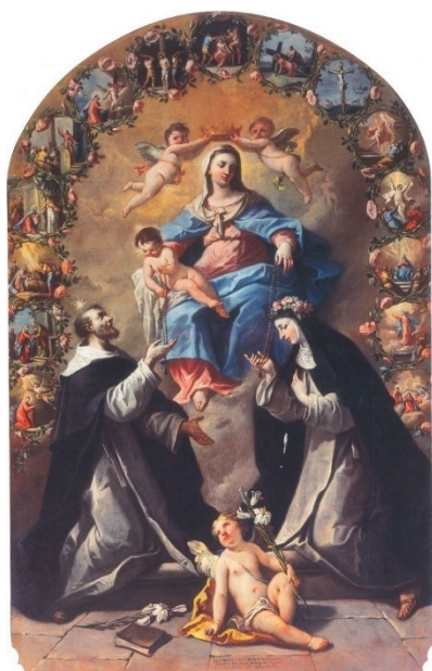
Slika 4. Gaspere Diziani, Bogorodica od Ružarija sa sv. Dominikom i sv. Rozalijom Limskom , 1758., ulje na platnu, 242 x 153 cm, crkva Rođenja Blažene Djevice Marije, Završje