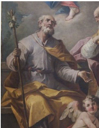
Slikovni prilog 14. Gaspare Diziani, Gospa od Ružarija sa svecima Josipom i Nikolom (detalj), oko 1750., ulje na platnu, katedrala u San Vito al Tagliamento

Iako Bralić smješta djelo u posljednje razdoblje Dizianijeve produkcije ističe da „...u svježini jarkog kolorita te ekspresivnosti majstorove geste na slici Sv. Josip još uvijek odjekuje Riccijeva koloristička izražajnost...“. 175 Nervozan i stakatiran potez kista, oblikovanje lica sveca, kontrastne boje i dramatičnost prikaza ukazuju na razdoblje Dizianijeva djelovanja u kojem prevladava utjecaj Sebastiana Riccija. Kasnija Dizianijeva djela obilježena su kompaktnim i laganim potezom kista koji izostaju sa slike Sv. Josip . Uz navedeno, naglašen chiaroscuro te tamnija paleta boja sugeriraju nešto raniju dataciju djela, oko 1740. godine, koja trenutno može biti predložena samo putem stilske analize slike.