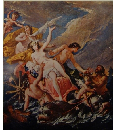
Slikovni prilog 8. Gaspere Diziani, Trijumf Amfitrite , 1740.-47., ulje na platnu, 78 x 96 cm, privatna kolekcija

Prema Valcanoveru, peto desetljeće 18. stoljeća predstavlja trenutak u Dizianijevom slikarstvu kada umjetnik potpuno prihvaća rokoko. 127 Pozadinski sfumato i elegantni likovi kreiraju spokojne prizore, a kompozicije su dinamične i fluidne. Prisutna je izražajna snaga likova te mekši i uniformniji potez kista u usporedbi s prethodnim Dizianijevim djelima. Punu slikarsku zrelost Diziani pokazuje na djelima ostvarena za La Scuola dei Mercanti del vin a San Silvestro u Veneciji, datirana između 1745. i 1750. godine. U ovom razdoblju, umjetnik posvećuje najviše pažnje dekorativnim elementima prikaza te elegantnom oblikovanju draperije. Boje su pročišćene te se stapaju u definirane forme, a time izostaje „riccijevski“ nervozan potez kista kojeg nadomješćuje rafiniran slikarski izraz. 128