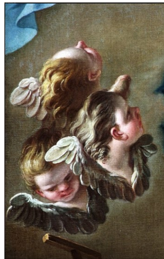
Slikovni prilog 25. Giuseppe Diziani, Bogorodica sa sv. Antunom Opatom (detalj), 1760.-64., ulje na platnu, sakristija katedrale u Cividaleu