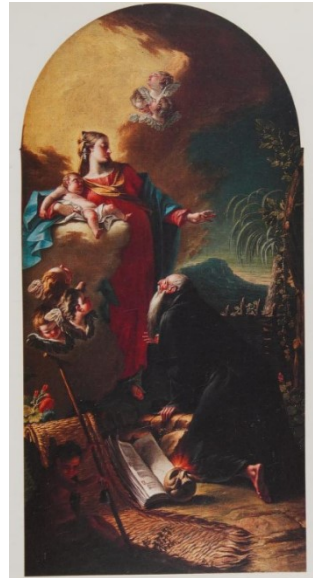
Slikovni prilog 25. Giuseppe Diziani, Bogorodica sa sv. Antunom Opatom , 1760.-64., ulje na platnu, sakristija katedrale u Cividaleu