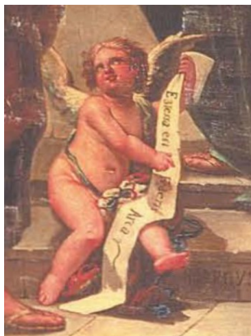
Slika 19. Marco Bassi, Sv. Joakim, sv. Ana i mala Marija , 1795., ulje na platnu, 241 x 126 cm, župna crkva Rođenja Blažene Djevice Marije, Žavršje