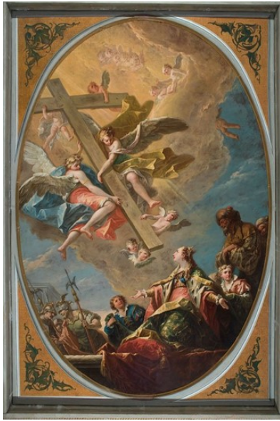
Slikovni prilog 9. Gaspare Diziani, Sveta Helena s križem , 1745.-50., ulje na platnu, 385 x 247 cm, Scuola del Vin a San Silvestro, Venecija