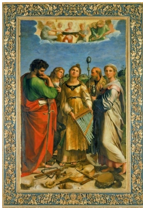
Slikovni prilog 37. Raffaello Sanzio, Ekstaza sv. Cecilije, 1518., ulje na platnu, 236 x 149 cm, Pinacoteca Nazionale di Bologna