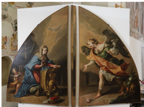
Slikovni prilog 5. Gaspare Diziani, Navještenje , 1735., ulje na platnu, 268 x 178 cm, crkva Santi Andrea e Mattia apostoli, Colloredo di Montalbano (Udine)

U razdoblju od 1735. do 1740. godine, dolazi do promjene Dizianijeva umjetnička izražaja u kojem slikar polako napušta baroknu teatralnost te se kreće prema eleganciji rokokoja. U navedenom periodu, nježnim i pomalo klasicističkim posredovanjem, Diziani umiruje tmurne prikaze te se oni mijenjaju u nježne i radosne događaje. Njegov rad postaje bogatiji, a paleta boja se povećava, blijedi barokni kjaroskuro te time nestaje dramatičnost prikaza. 122 Diziani napušta robusnost figura te se okreće mekoći oblikovanja likova, a metalan odsjaj boje te istančan potez kista pogoduju ljupkim prikazima kao što je Navještenje iz župne crkve u Colloredo di Montalbano i Sveti Franjo Paulski pomaže oboljelima od kuge iz crkve San Francesco di Paola u Veneciji. 123 Devijacija Dizianijeva stila povezana je i s promjenom naručitelja. Do petog desetljeća 18. stoljeća Crkva i redovnički redovi bili su glavni pokrovitelji umjetnosti. Njihovu ulogu u velikoj mjeri kasnije preuzimaju bogate i patricijske obitelji te pojedinci. 124