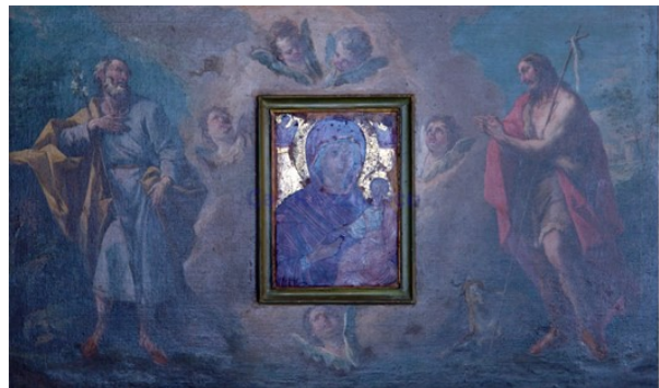
Slikovni prilog 23. Gaspare Diziani, Sv. Josip i sv. Ivan Krstitelj , poslije 1755., ulje na platnu, 77 x 131 cm, Ca' Rezzonico, Venecija