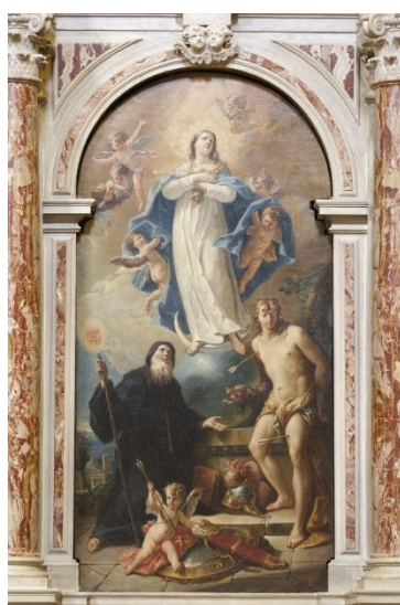
Slikovni prilog 18. Gaspare Diziani, Uznesenje Bogorodice sa sv. Gervazijem, Protazijem i Karlom Boromejskim , 1750-60., ulje na platnu, Chiesa dei Santi Gervasio e Protasio, Belluno