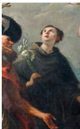
Slikovni prilog 20. Gaspere Diziani, Duše u čistilištu (detalj), 1760-64., ulje na platnu, katedrala San Martino, Tolmezzo