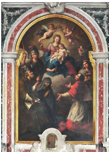
Slika 13. Francesco Maggiotto, Bogorodica od pojasa sa svetima Mihovilom, Augustinom, Monikom, Karlom Boromejskim i Agatom , 1785., ulje na platnu, ?, crkva sv. Mihovila, Korčula