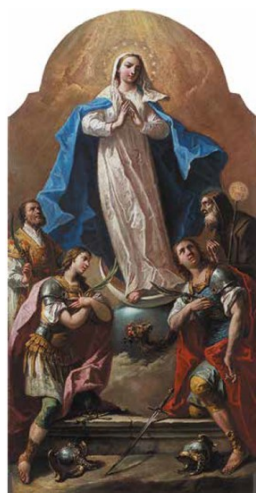
Slika 5. Gaspere Diziani, Bazgrešno začéce sa svecima , oko 1758., ulje na platnu, 242 x 153 cm, crkva Rođenja Blažene Djevice Marije, Završje

sedmog desetljeća 18. stoljeća te je prisutna doza akademizma, forme su i dalje oblikovane dinamičnim potezima Dizianijeva prepoznatljiva slikarska rukopisa.