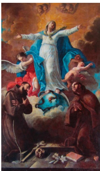
Slika 18. „Slikar kapucinske crkve“, Bezgrešno začéce sa sv. Franjom Aiškim i sv. Antunom Padovanskim , oko 1768., ulje na platnu, 180 x 100 cm, župna crkva sv. Blaža, Vodnjan