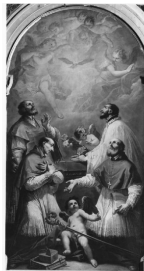
Slikovni prilog 41. Gaspare Diziani, Sv. Franjo Saleški, sv. Andrija Avellino, sv. Kajetan iz Tijene , druga polovica 18. stoljeća, ulje na platnu, 338 x 170 cm, Duomo di San Martino, Belluno

Istom mletačkom slikaru, Višnja Bralić pripisuje palu Bezgrešno začće sa sv. Franjom Asiškim i sv. Antunom Padovanskim (slika 18.), također izvorno iz kapucinske crkve sv. Josipa, danas u župnoj crkvi sv. Blaža u Vodnjaju. Autorica i na ovoj slici primjećuje kompozicijske i tipološke srodnosti s djelima Gaspara Dizianija kao što su Immaculata iz San Vito al Tagliamento i Uznesenje Bogorodice sa sv. Gervazijem, Protazijem i Karlom Boromejskim iz Belluna. Međutim, zaključuje kako je „Slikar kapucinske crkve“ znatno slabiji mletački majstor s akademiziranim likovnim izrazom. 254 Josipa Alviž na vodnjanskoj slici, pak, pronalazi ikonografske i kompozicijske sličnosti s istoimenim djelom Francesca de Rose