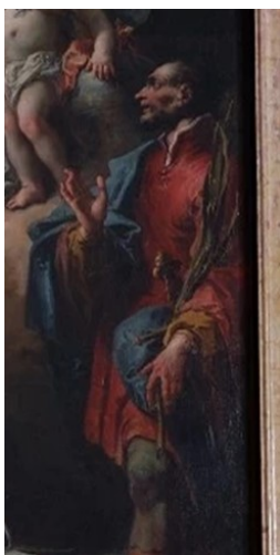
Slikovni prilog 35. Gaspare Diziani, Krist sa sv. Antunom Padovanskim, sv. Franjom Paulskim i sv. Ambrozijem (detalj), oko 1760., ulje na platnu, Chiesa di S. Ambrogio di Fiera, Treviso