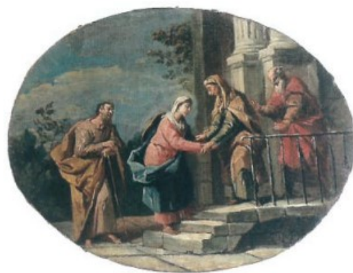
Slikovni prilog 16. Gaspere Diziani, Otajstva sv. Ružarija , prva polovica 18. stoljeća, 25 x 32,5 cm, ulje na platnu, Duomo di San Nicolò, Motta di Livenza