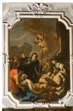
Slikovni prilog 6. Gaspare Diziani, Sveti Franjo Paulski pomaže oboljelima od kuge , 1730.-40., ulje na platnu, crkva Svetog Franje Paulskog, Venecija

Početkom četrdesetih godina 18. stoljeća Diziani se okreće prema Giambattisti Pittoniju, a njegov stil sazrijeva u bogat i fluidan način oblikovanja koji rezultira ciklusom