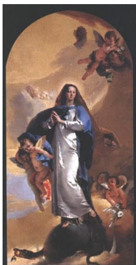
Slikovni prilog 17. Giambattista Tiepolo, Immaculata , 1733., ulje na platnu, 386 x 190 cm, Pinacoteca Civica, Vicenza