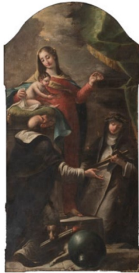
Slika 7. Giuseppe Diziani, Bogorodica od Ružarija sa sv. Dominikom i sv. Katarinom Sijenskom , 1766.-68., ulje na platnu, 210 x 100 cm, Crkva sv. Jeronima, Rijeka

katedrale u Cividaleu, također djelo Giuseppea koje ostvaruje 1760. godine. 186 Iako je slika u Cividaleu znatnije kvalitete, zamjetne su kolorističke i tipološke sličnosti s riječkom palom, naročito u oblikovanju lika Bogorodice te lica sv. Antuna Opatu i sv. Dominika.