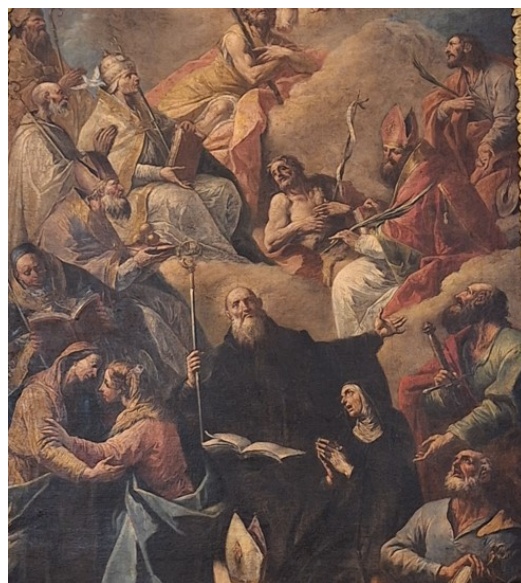
Slika 1. Gaspare Diziani, Svi Sveti (detalj), oko 1750., ulje na platnu, župna crkva Sv. Jeronima, Kaštel Gomilica