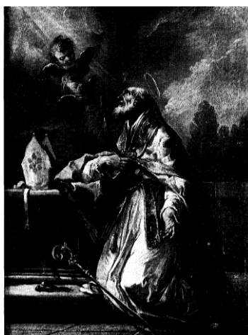
Slikovni prilog 32. Gaspare Diziani, Sv. Biskup , ?, ulje na platnu, Tiroler Landsmuseum Ferdinandeum, Innsbruck