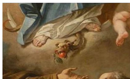
Slikovni prilog 21. Gaspere Diziani, Bezgrješna s četiri sveta kapucina (detalj), prva polovica 18. stoljeća, ulje na platnu, S. Pietro ai Volti, Cividale