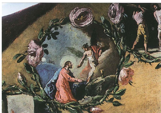
Slika 4. Gaspere Diziani, Bogorodica od Ružarija sa sv. Dominikom i sv. Rozalijom Limskom (detalj), 1758., ulje na platnu, 242 x 153 cm, crkva Rođenja Blažene Djevice Marije, Završje