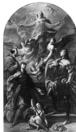
Slikovni prilog 42. Gaspare Diziani, Immacolata , oko 1750., ulje na platnu, 265 x 129 cm, San Vito al Tagliamento

Osim što je Alviž prethodno istaknula da oltarna pala s prikazom četiri kapucina nije mogla nastati prije kanonizacije sv. Serafina iz Montegranara (1768.), ovaj se nepoznati umjetnik izravno ugleda na Dizianijeva djela nastala između šestog i sedmog desetljeća 18. stoljeća. Stoga je dataciju slika Bezgrešno začéce sa sv. Franjom Asiškim i sv. Antunom Padovanskim i Sveta obitelj s četiri sveta kapucina potrebno pomaknuti u nešto kasnije razdoblje, nakon 1768. godine.