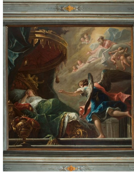
Slikovni prilog 10. Gaspare Diziani, San Svete Helene , 1745.-50., ulje na platnu, 247 x 247 cm, Scuola del Vin a San Silvestro, Venecija

Sredina 18. stoljeća za Dizianija označava razdoblje u kojem polazi iz dekorativnog riccijevizma, ali prati primjere Tiepola, Amigonija i Pittonija, u smislu mirnije i virtuoznije figurativne ekspresije. 129 Šireći dijapazon svog djelovanja, Diziani se pedesetih godina nakratko okreće kreiranju žanrovskih scena s pejzažem. One su često prikazi rustičnog života, karakterizirani ponekad s brutalnim realizmom po uzoru na nizozemsku umjetnost. 130 Na pejzažima Diziani uspostavlja novi odnos likova, koji se smanjuju, te njihove pozadine, koja se povećava, figure se izdužuju, a lica poprimaju napete izraze. 131 Upravo posvećenost izvedbi detalja, kao primjerice na slici Blagdan svete Marte iz Ca' Rezzonico, otkriva nam kasno razdoblje Dizianijeva djelovanja.