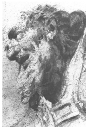
Slikovni prilog 33. Jacopo Marieschi, Presveto Trojstvo (detalj), 1752.-55., ulje na platnu, Chiesa di Santa Maria delle Penitenti, Venecija