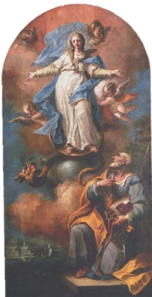
Slika 11. Jacopo Marieschi, Bezgrešno začéce sa sv. Petrom , oko 1740., ulje na platnu, 228 x 116 cm, Crkva Gospe od Anđela, Poreč