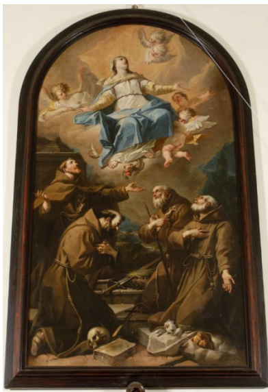
Slikovni prilog 20. Gaspare Diziani, Immaculata s četiri sveta kapucina , 1735.-40., ulje na platnu, San Pietro ai Volti Cividale