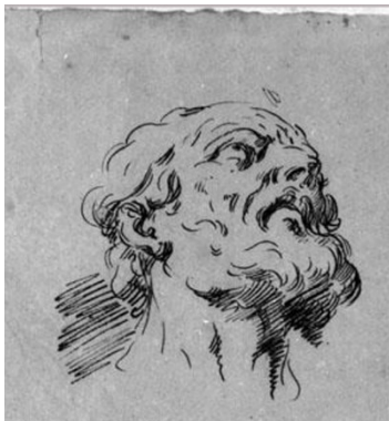
Slikovni prilog 22. Gaspare Diziani, Studije bradatih glava (detalj), prva četvrtina 18. stoljeća, olovka i tinta na papiru, 32 x 39,8 cm, Museo Correr, Venecija