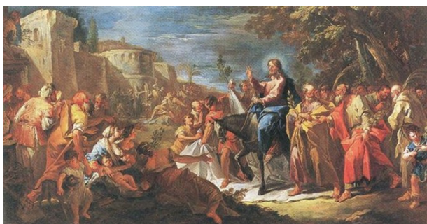
Slikovni prilog 1. Gaspare Diziani, Ulazak Krista u Jeruzalem , nakon 1717., ulje na platnu, 54,5 x 108 cm, privatna kolekcija, Belluno

Ulazak Krista u Jeruzalem iz Belluna. 111 Na djelu je prisutno Dizianijevo karakteristično pastozno slikarstvo koje postiže debelim nanosima kontrastnih boja. Dinamičnost prikaza sugeriraju svjetlosni bljeskovi i likovi s crvenkastim tonom kože, odjeveni u teške draperije „nalik papiru“ čiji su nabori formirani plohama iznimno kontrastnim tonova. 112 Prikazi iz Dizianijeva mladenačkog perioda stvaraju dojam težine i dramatičnosti koje slikar kasnije spaja s Riccijevim tipološkim i kromatskim rješenjima. Već u svojim ranim djelima Diziani pokazuje veliki interes prema izražajnom koloritu, a koristeći fragmentirane kontrastne tonove postiže energičnu interpretaciju Riccijeva slikarska repertoara. 113 Slika Obraćanje sv. Pavla iz crkve Santa Giustina u Padovi predstavlja klasičan primjer Dizianijeve prve faze djelovanja. Tamne kontrastne boje i ikonografija prikaza, s druge strane, daju slici kasnobarokni karakter s utjecajima koji se mogu pratiti od Dizianijeva puta u Rim. 114 Utjecaj rimskoga baroka zamjetljiv je također u monumentalnim scenama punim dinamičnih kompozicijama te impozantnom arhitekturom kao što je to na pali Gospa Karmelska sa Šimunom Stockom iz crkve Marijina Uznesenja u Borbiagu (Venecija).