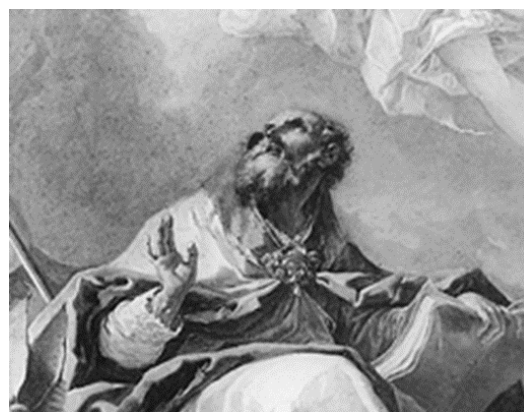
Slikovni prilog 21. Gaspere Diziani, Sveti Augustin pobjeđuje herezu (detalj), prije 1732., ulje na platnu, Gallerie dell'Accademia di Venezia, Venecija