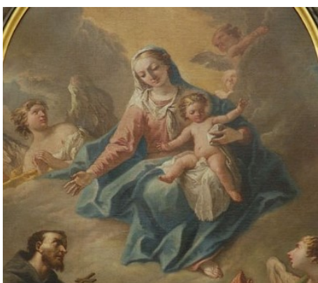
Slikovni prilog 20. Gaspare Diziani, Duše u čistilištu (detalj), 1760.-64., ulje na platnu, katedrala San Martino, Tolmezzo