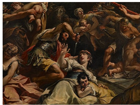
Slikovni prilog 4. Gaspere Diziani, Pokolj nevine dječice (detalj), 1733., ulje na platnu, crkva Santo Stefano, Venecija

Posebice u prvom razdoblju Dizianijeva djelovanja, do polovice 18. stoljeća, moguće je pratiti vrhunac riccijevski oblikovanih likova i draperije, brz i kratak potez kista te pročišćen i bogat kolorit. 119 Utjecaj Sebastiana Riccija na formiranje Dizianijeva stila započeo je puno prije slikarova ulaska u Riccijevu bottegu . Početkom 18. stoljeća Ricci boravi u svom rodnom gradu Bellunu, gdje se ponovno vraća 1710. godine kada izrađuje Mučeništvo sv. Petra i Mučeništvo sv. Ivana Krstitelja za kapelu Fulcis u crkvi Svetog Petra. Navedena djela već tada ostavljaju utisak na formiranje Dizianijeva vlastita stila, naročito u koloritu, što rezultira