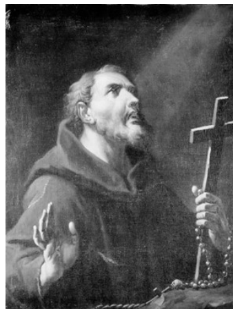
Slikovni prilog 28. Giuseppe Diziani?, Sv. Franjo Asiški , prije 1754., ulje na platnu, 80 x 61 cm, Statens Museum for Kunst, Kopenhagen