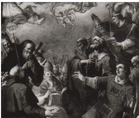
Slika 3. Gaspare Diziani, Svi Sveti (detalj), oko 1750. godine, ulje na platnu, 127,5 x 68 cm, župna crkva Svih Svetih, Zlopolje

pristupa s manje temperamenta i kompaktnijim spajanjem boja. 152 Fizionomija likova te stilsko oblikovanje zlopoljske pale pokazuje visoku razinu sličnosti s istoimenom slikom iz Kaštel Gomilice. Primjerice, lik sv. Petra u donjem desnom registru obiju pala prati istu tipologiju pijetističkog lica, a sličnosti su vidljive do detalja oblikovanja brade sveca te draperije s nervoznim nanosima boje i svjetlosnim odbljescima. Niz sličnosti u fizionomiji pokazuju sv. Dujam i blaženi Ivan Trogirski sa zlopoljske pale uspoređujući ih sa sv. Dujamom na slici u Kaštel Gomilici. Također, sjedeći lik sv. Grgura na oba djela prati identičnu ikonografiju te oblikovanje lica, draperije i atributa. Moguće je napraviti još niz usporedbi s drugim Dizianijevim djelima u tipologiji likova i tretiranju tkanine, no osim spomenutog njegov se specifičan duktus očituje i u korištenju karakteristične maslinastozelene, jarko ružičaste i plave boje, tipične za kasniji slikarov period.