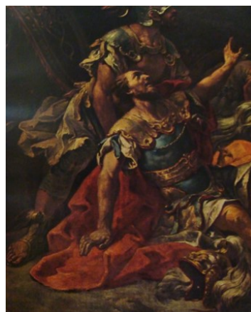
Slikovni prilog 2. Gaspare Diziani, Obraćanje sv. Pavla (detalj), 1720.-27., ulje na platnu, crkva Santa Giustina, Padova

Tridesetih godina 18. stoljeća Diziani stječe punu tehničku i izražajnu zrelost, koja mu je omogućila da se bavi različitim slikarskim žanrovima, od narativnih scena do stropnih