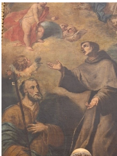
Slika 2. Gaspare Diziani, Navještenje sa sv. Josipom i sv. Antunom (detalj), oko 1750., ulje na platnu, župna crkva Sv. Jeronima, Kaštel Gomilica