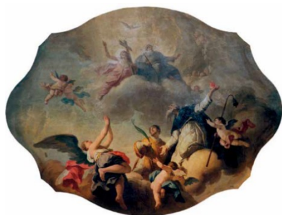
Slika 14. Apoteoza sv. Antuna Opata i sv. Grgura, mučenika iz Spoleta, 1772. , ulje na platnu, 200 x 300 cm, župna crkva sv. Antuna Opata, Veli Lošinj

Eklektičnost Maggiottova izraza na lošinjskoj slici očituje se u umjetnikovom traganju za uzorima u retorici rokoka. 225 Iskričav kolorit, nebeski prostor kojeg ispunjavaju sveci u zanosu te silovite kretnje anđela karakteristike su koje Maggiotto nalazi u djelima Gaspara Dizianija kao što je freska u crkvi San Bartolomeo u Bergamu iz 1751. godine. S druge strane, tipologija Maggiottovih likova izravno se nadovezuje na djela Dizianijeva alter ega , Jacopa Marieschija. U oblikovanju i impostaciji svetaca Maggiotto se inspirira Marieschijevim djelima Presveto Trojstvo i Apoteoza sv. Lovre Giustinianija iz crkve Santa Maria delle Penitenti u Veneciji. 226