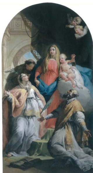
Slikovni prilog 39. Giambattista Canal, Bogorodica s Djetetom i svecima , prije 1797., ulje na platnu, 337 x 180 cm, Duomo di San Nicolò, Motta di Livezna