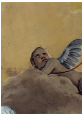
Slikovni prilog 27. Giuseppe Diziani, Uznesenje Bogorodice (detalj), 1770.–71., freska, prezbiterij katedrale u Cividaleu