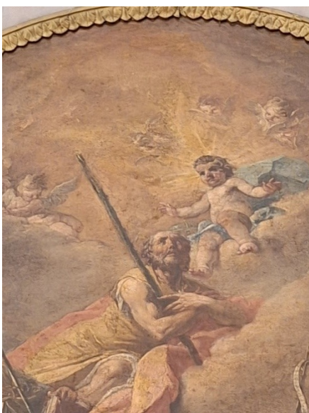
Slika 1. Gaspare Diziani, Svi Sveti (detalj), oko 1750., ulje na platnu, župna crkva Sv. Jeronima, Kaštel Gomilica