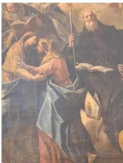
Slika 1. Gaspare Diziani, Svi Sveti (detalj), oko 1750., ulje na platnu, Župna crkva Sv. Jeronima, Kaštel Gomilica