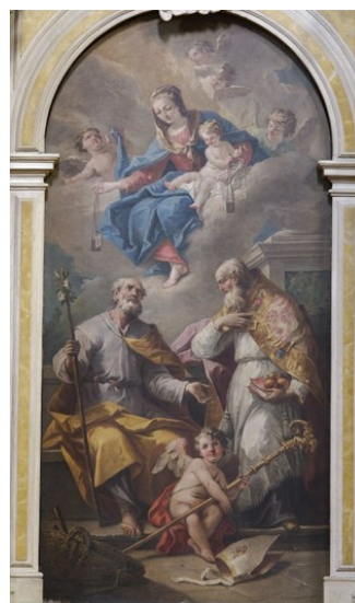
Slikovni prilog 14. Gaspare Diziani, Gospa od Ružarija sa svecima Josipom i Nikolom , oko 1750, ulje na platnu, katedrala u San Vito al Tagliamento

Prijatelj povezuje narudžbu pale Navještenje sa sv. Josipom i sv. Antunom s podatkom kojeg iznosi Miroslav Vulić u tekstu Antun Kačić i njegovo Boggoslovje dilloredno iz 1974. godine, ne navodeći izvor o istom. 146 Vulić piše kako je svojim dolaskom na nadbiskupsku stolicu u Splitu, Kačić naručio sliku „u Mlecima“ za oltar sv. Benedikta u nekadašnjoj župnoj crkvi u Kaštel Gomilici. 147 Bivša župna crkva Sv. Jerolima, podignuta je 1731. godine, na mjestu starije, a oltar sv. Benedikta, zajedno s ostalim inventarom se prenosi početkom 20. stoljeća u novosagrađenu župnu crkvu. 148 Vulić također sugerira da je riječ o djelu Giambattiste Tiepola ili nekom od njegovih sljedbenika te prenosi podatak da su stanovnici Gomilice bili „osobito ponosni, što ovako nešto imaju u svom selu.“ 149 Bilo da je riječ o pali Svi Sveti ili Navještenje sa sv. Josipom i sv. Antunom , njihova ikonografija se ne poklapa s narudžbom za oltar sv. Benedikta. Također, zbog neprovjerenih dokaza o nabavci navedene slike, ali i uopće