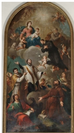
Slikovni prilog 34. Francesco Maggiotto, Sveti Gaetano u slavi , 1775-99., ulje na platnu, 200 x 150 cm, Chiesa di San Gaetano, Thiene, Vicenza