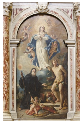
Slikovni prilog 18. Gaspere Diziani, Uznesenje Bogorodice sa sv. Gervazijem, Protazijem i Karlom Boromejskim , oko 1750., ulje na platnu, Chiesa dei Santi Gervasio e Protasio, Belluno