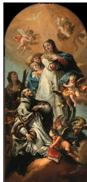
Slikovni prilog 31. Jacopo Marieschi, Immacolata sa sv. Ivanom Nepomukom i sv. Lucijom , 1752.-55., ulje na platnu, Santo Stefano, Venecija