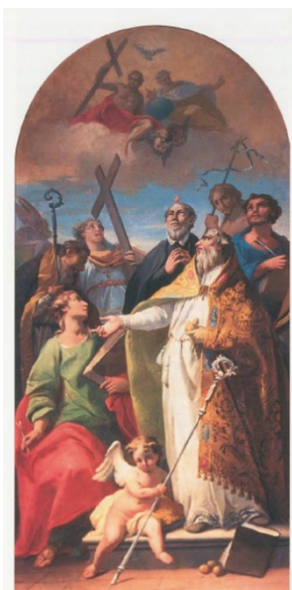
Slika 16. Giambattista Canal?, Presveto Trojstvo sa svecima , zadnja četvrtina 18. stoljeća, ulje na platnu, 16 x 83 cm, župna crkva Navještenja Marijina, Svetvinčenat