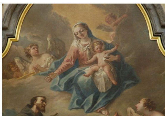
Slikovni prilog 14. Gaspare Diziani, Gospa od Ružarija sa svecima Josipom i Nikolom (detalj), oko 1750., ulje na platnu, katedrala u San Vito al Tagliamento