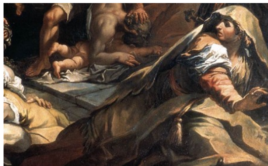
Slikovni prilog 12. Gaspare Diziani, Pokolj nevine dječice (detalj), 1733., ulje na platnu, crkva Santo Stefano, Venecija