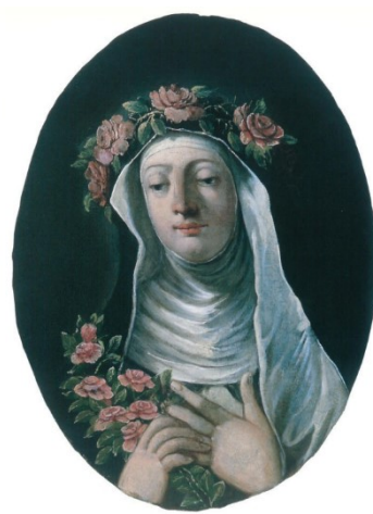
Slikovni prilog 15. Gaspere Diziani, Sv. Dominik (58,7x43,5 cm) i Sv. Rozalija Limska (59x43,5cm), prva polovica 18. stoljeća, ulje na platnu, Duomo di San Nicolò, Motta di Livenza