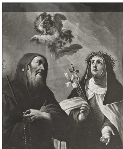
Slikovni prilog 19. Gaspere Diziani, Sveti Franjo Paulski i Sv. Katarina Sijenska , 2. polovica 18. stoljeća, ulje na platnu, 130 x 102 cm, privatna kolekcija Scaglia Mario, Milan