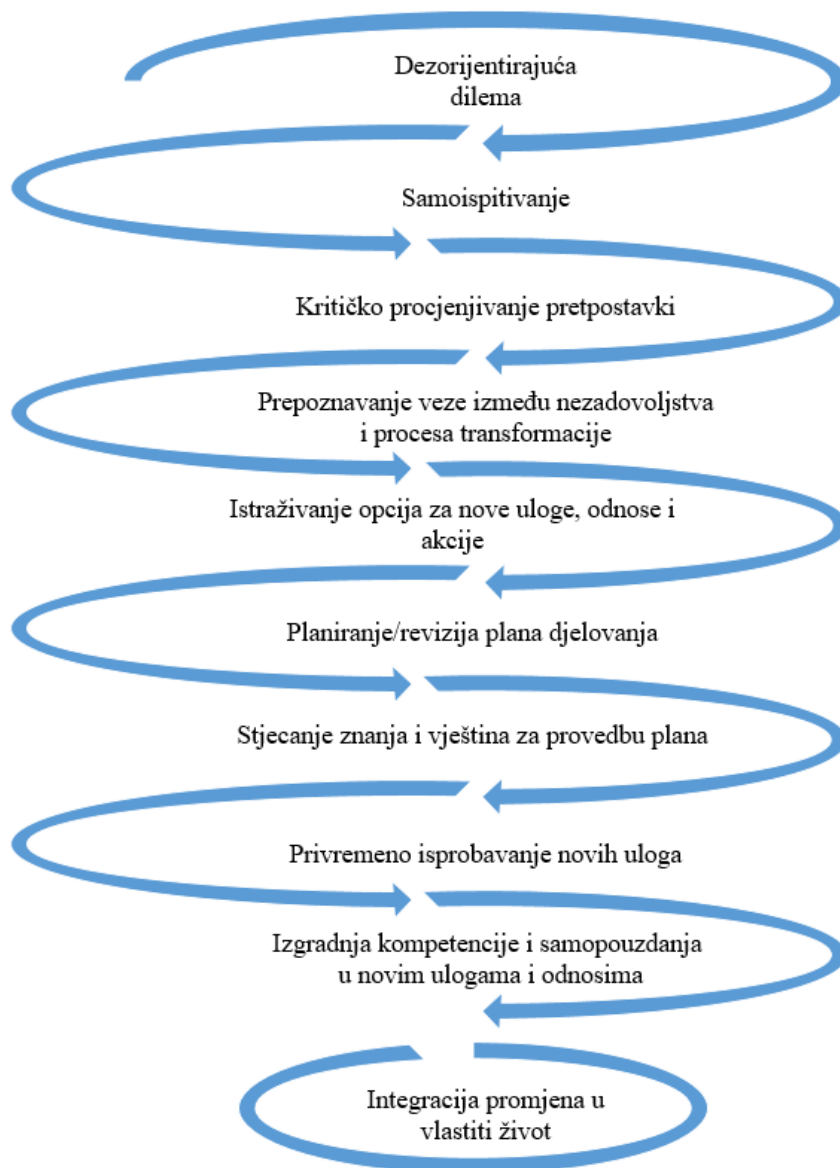
Slika 1. Faze transformativnog učenja prema Mezirowu (Santalucia i Johnson, 2010)

Organizacije civilnog društva, a među njima i organizacije mladih i za mlade, predstavljaju mjesta koja povezuju različite osobe i stvaraju prostor za refleksiju koja može dovesti do različitih individualnih i društvenih promjena čime ujedno predstavljaju i prostor za procese transformativnog učenja (Brown, 2018) što je aspekt rada kojeg bi radnici s mladima trebali uzimati u obzir u svom radu.