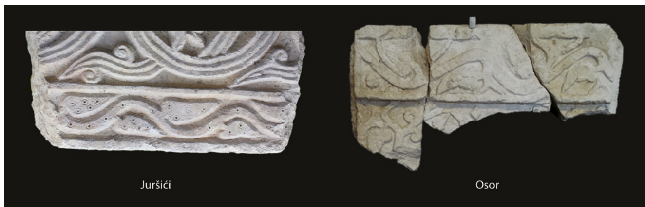
11. Usporedba motiva vitice na plutejima iz Juršića i Osora

Comparison of the tendril motifs on panels from Juršići and Osor