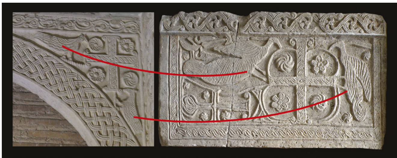
2. Detalj arkade tzv. Eleukadijeva ciborija iz Ravenne i plutej lijeve strane oltarne ograde iz Valbandona

Detail of the arcade from the so-called "Ciborium of Eleucadius", Ravenna; left panel of the chancel screen from Valbandon