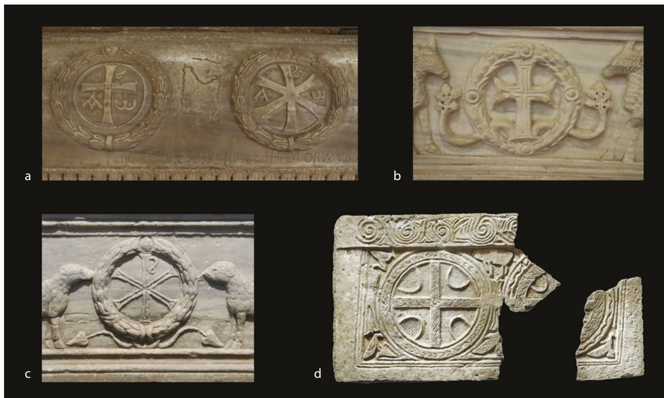
3. a) detalj ranokršćanskog sarkofaga s kraja 5. stoljeća reupotrijebljenog u 7. stoljeću i b) detalj ranokršćanskog sarkofaga iz 6. stoljeća preklesanog krajem 8. ili početkom 9. stoljeća (foto: P. Karković-Takalić); c) detalj ranokršćanskog sarkofaga iz polovine 5. stoljeća (foto: S. Petković); d) plutej desne strane oltarne ograde iz Valbandona (izvor: IVAN MATEJČIĆ – SUNČICA MUSTAČ /bilj. 12/, 157)

a) Detail of an early Christian sarcophagus from the late 5 th century, reused in the 7 th century; b) Detail of an early Christian sarcophagus from the 6 th century, carved anew in the late 8 th or early 9 th centuries; c) Detail of an early Christian sarcophagus from the mid-5 th century; d) Right panel of the chancel screen from Valbandon