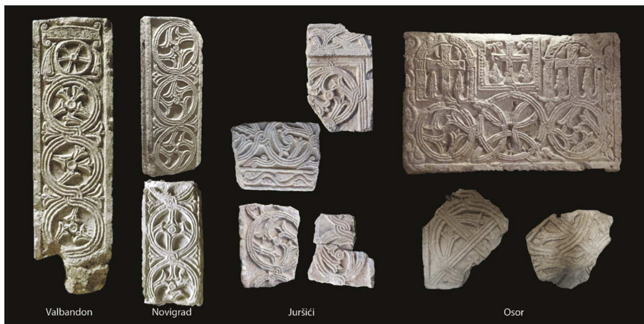
7. Primjeri istog motiva na skulpturi iz: Valbandona i Novigrada (izvor: IVAN MATEJČIĆ – SUNČICA MUSTAČ /bilj. 12/, 158, 169), Juršića (foto: AMI Pula) i Osora (foto: M. Vicelja i N. Belošević)

Examples of the same motif in the sculpture from Valbandon, Novigrad, Juršići, and Osor