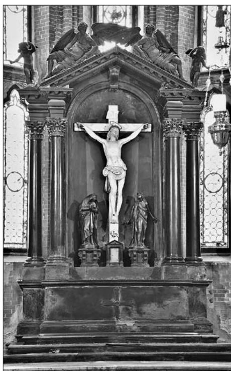
Slika 6: Alessandro Vittoria: oltar svetog Križa, oko 1586., Santi Giovanni e Paolo, Venecija.