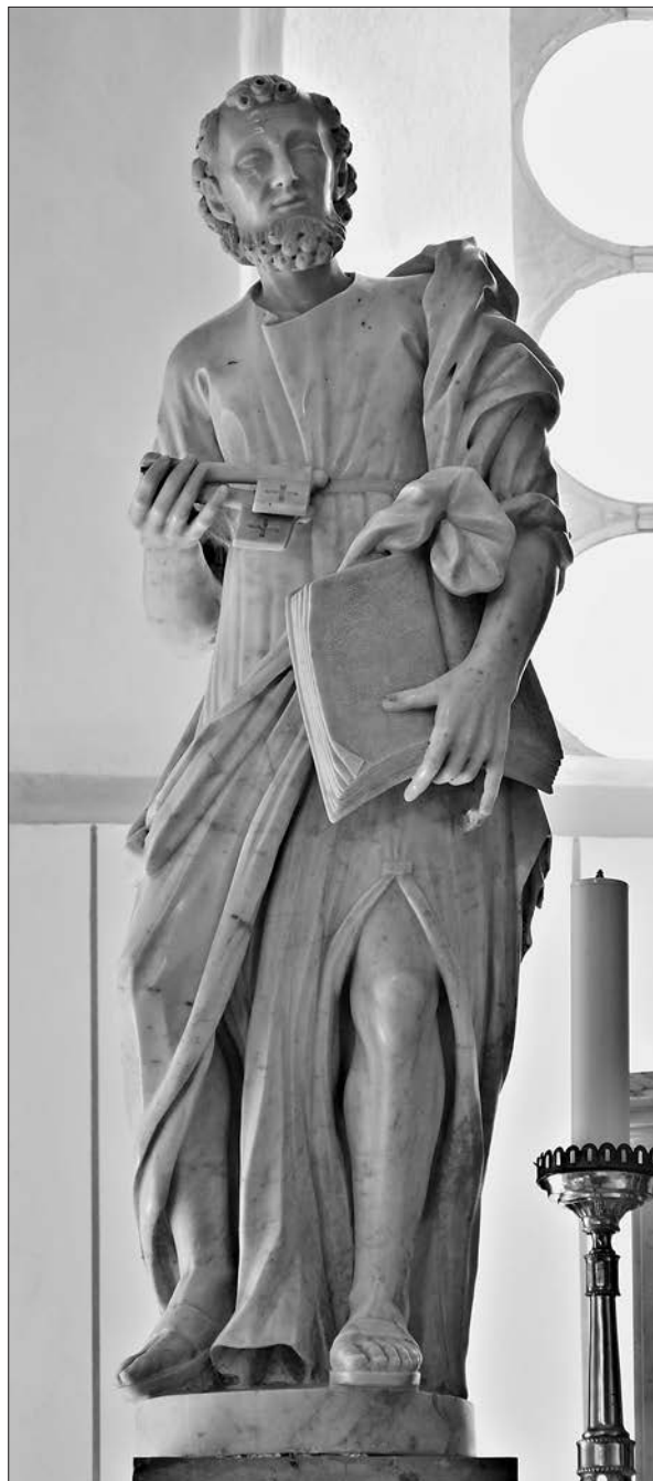
Slika 14: Giovanni Battista Zipperla, sveti Petar, glavni oltar, 1780., župna crkva svetog Petra, Ilirska Bistrica.