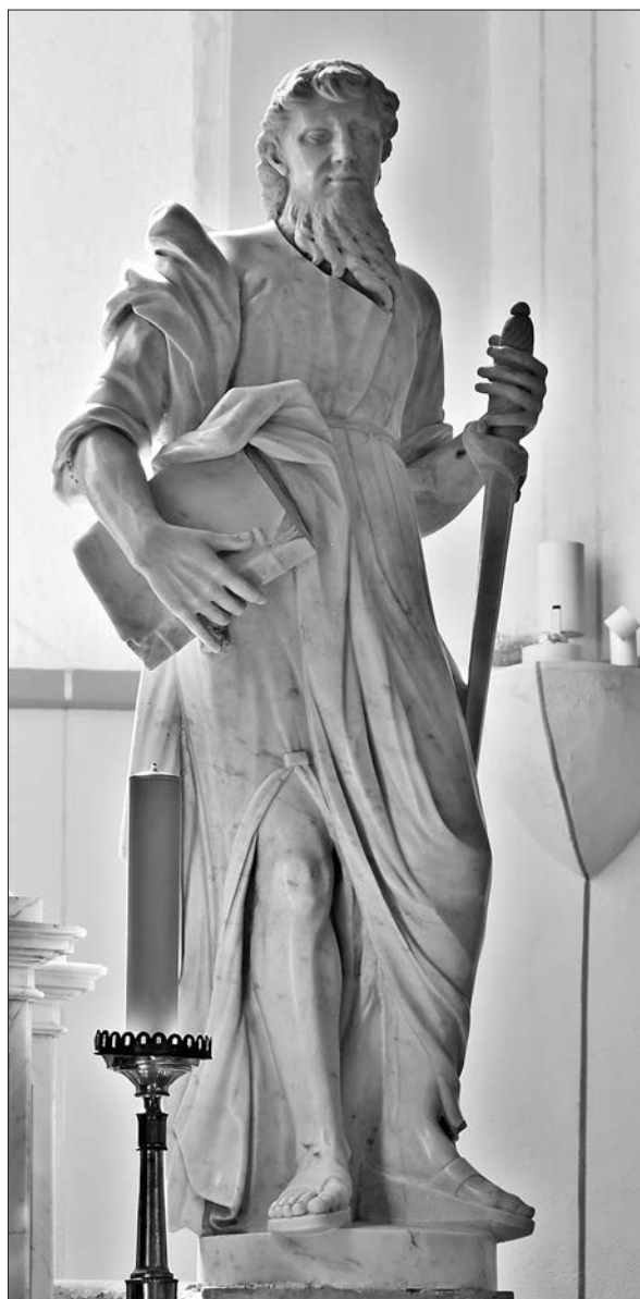
Slika 15: Giovanni Battista Zipperla, sveti Pavao, glavni oltar, 1780., župna crkva svetog Petra, Ilirska Bistrica.