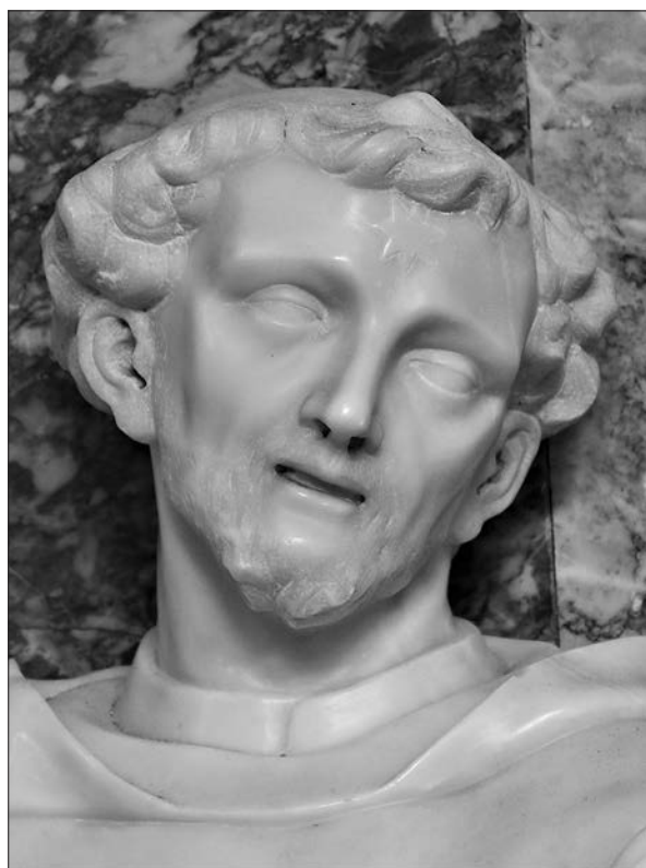
Slika 10: Antonio Michelazzi, sveti Dominik, oko 1741, župna crkva svetog Petra, Ilirska Bistrica, detalj.