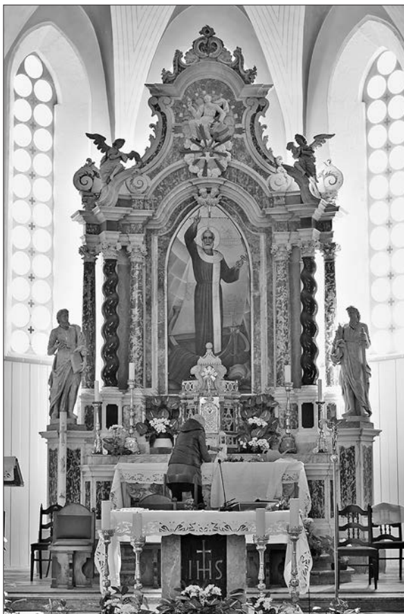
Slika 12: Sebastiano Petruzzi i Giovanni Battista Zipperla, glavni oltar, župna crkva svetog Petra, 1780., Ilirska Bistrica.