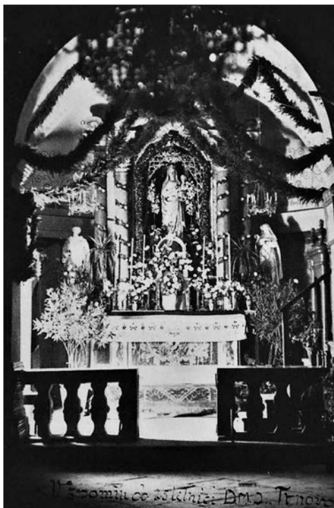
Slika 9: Fotografija kapele i oltara Gospe od Ružarija u Ilirskoj Bistrici s početka 20. stoljeća (Bilc, Kronika fare trnavske ).