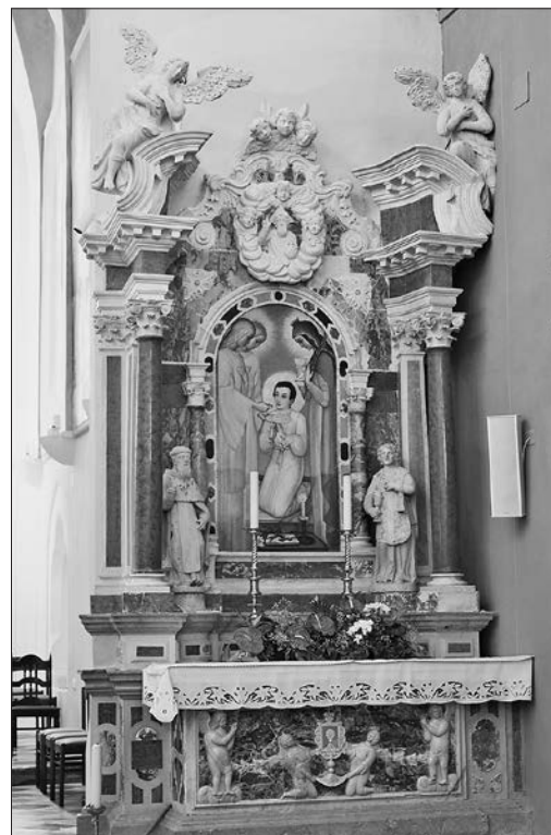
Slika 3: Nepoznata radionica: nekadašnji oltar Presvetog sakramenta s desne strane trijumfalnog luka, prva četvrtina 18. stoljeća, župna crkva svetog Petra, Ilirska Bistrica.