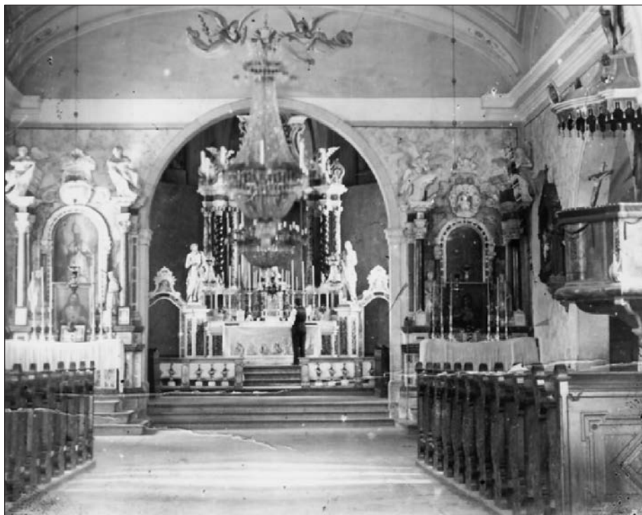
Slika 1: Fotografija unutrašnjosti župne crkve u Ilirskoj Bistrici iz prve četvrtine 20. stoljeća (Bilc, Kronika fare trnovske)