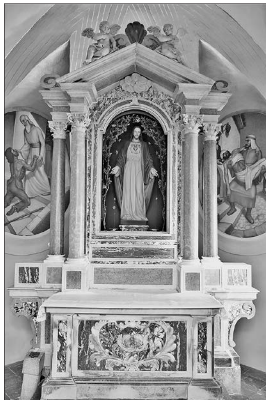
Slika 5: Antonio Michelazzi: oltar Gospe od Ružarija, oko 1741., župna crkva svetog Petra, Ilirska Bistrica.