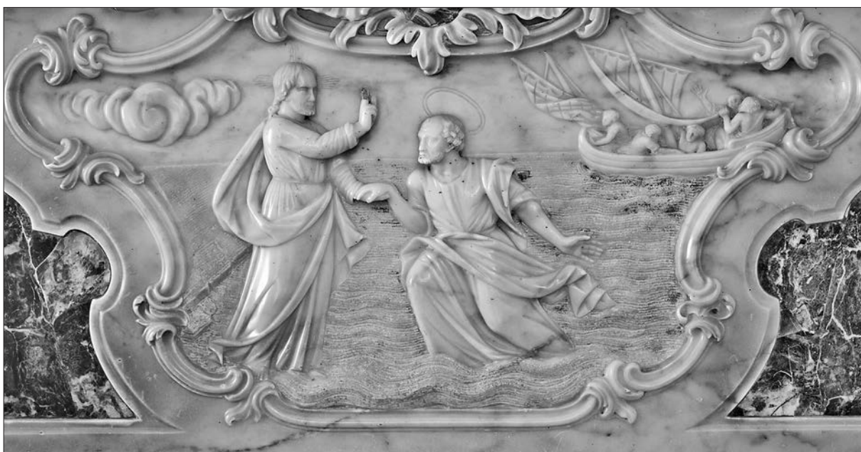
Slika 13: Sebastiano Petruzzi, Isus hoda po vodama Genezaretskog jezera, stipes glavnog oltara, 1780., župna crkva svetog Petra, Ilirska Bistrica.