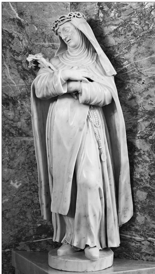
Slika 8: Antonio Michelazzi, sveta Katarina Sienska, oko 1741., župna crkva svetog Petra, Ilirska Bistrica (foto: Mario Pintarić).