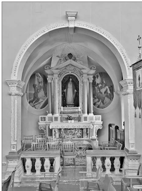
Slika 4: Bočna kapela posvećena Blaženoj Djevici Mariji – Gospi od Ružarija, 1741., župna crkva svetog Petra, Ilirska Bistrica (foto: Damir Tulić).