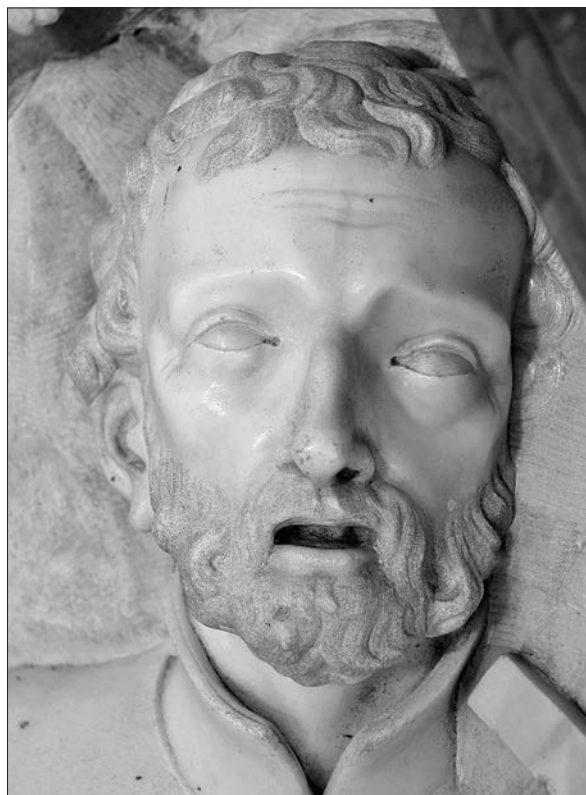
Slika 11: Antonio Michelazzi, sveti Franjo Ksaverski , 1741–1746, župna crkva svetog Petra, Lupoglav, detalj (foto: Damir Tulić).