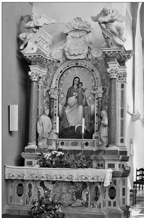
Slika 2: Nepoznata radionica: nekadašnji oltar svetog Nikole s lijeve strane trijumfalnog luka, prva četvrtina 18. stoljeća, župna crkva svetog Petra, Ilirska Bistrica.