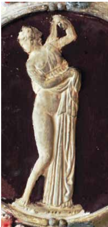
13. Kameja s likom Venere Kalipigije u zapadnom salonu, Palača šećerane, Rijeka Cameo with the depiction of Venus Callipyge in the western salon, Sugar Refinery Palace, Rijeka