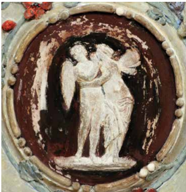
15. Kameja s likom Amora i Psihe u zapadnom salonu, Palača šećerane, Rijeka Cameo with the depiction of Cupid and Psyche in the western salon, Sugar Refinery Palace, Rijeka