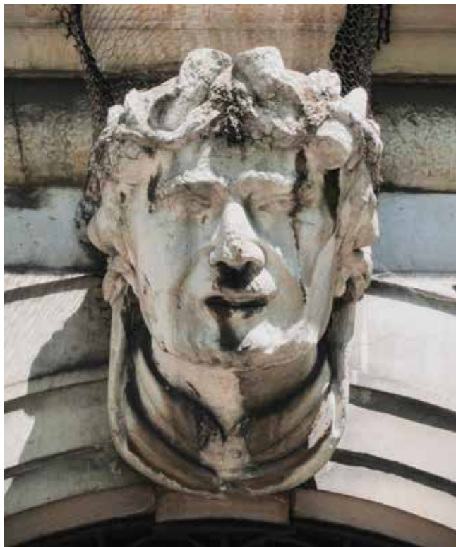
2. Sebastiano Petruzzi, Protoma na zapadnom portalu pročelja Palače šećerane, Rijeka

Sebastiano Petruzzi, protome on the western portal in the front façade of the Sugar Refinery Palace, Rijeka