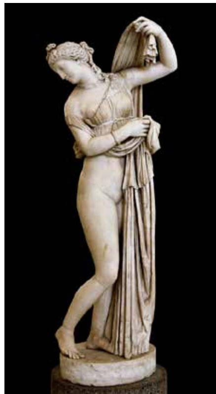
14. Venera Kalipigija, Museo Nazionale Archeologico, Napulj Venus Callipyge, Museo Nazionale Archeologico, Naples