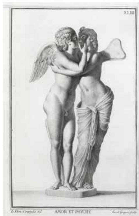
16. Carlo Gregori prema Giovanniju Domenicu Campigli, Amor i Psiha, grafika iz djela Museum Florentinum iz 1734. Carlo Gregori after Giovanni Domenico Campigli, Amor and Psyche, print from the Museum Florentinum, 1734