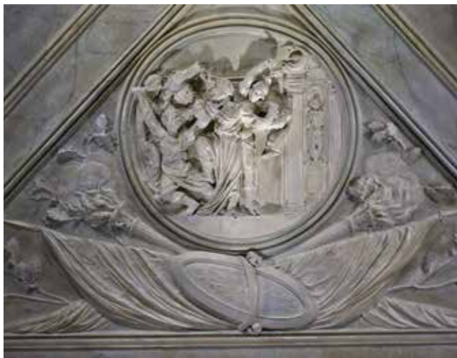
5. Sjeverno polje svoda Svečane dvorane s prikazom ubojstva cara Domicijana, Palača šećerane, Rijeka

Northern field in the vault of the Ceremonial Hall depicting the assassination of Emperor Domitian, Sugar Refinery Palace, Rijeka