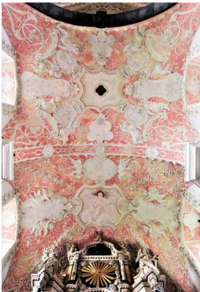
1. Štukature u svetištu župne crkve Uznesenja Blažene Djevice Marije, Rijeka, 1720. – 1725.

Stucco decorations in the sanctuary of the parish church of the Assumption of the Blessed Virgin Mary, Rijeka, 1720–1725