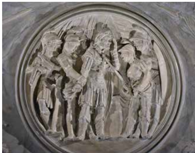
6. Medaljon s prikazom pogubljenja cara Vitelija (?) u zapadnom polju svoda Svečane dvorane, Palača šećerane, Rijeka

Medallion depicting the execution of Emperor Vitellius (?) in the western field of the vault in the Ceremonial Hall, Sugar Refinery Palace, Rijeka