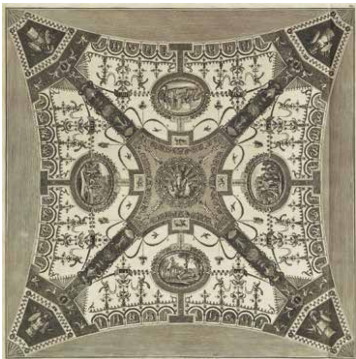
7. Svod u lođi Ville Madama u Rimu iz atlasa Vestigia delle terme di Tito e loro interne pitture , Rim, 1776.

Vault in the loggia of Villa Madama in Rome, from the atlas Vestigia delle terme di Tito e loro interne pitture, Rome, 1776