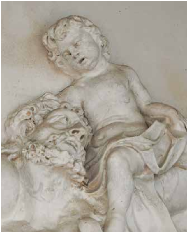
24. Clemente i Giacomo Somazzi, detalj lica svetog Kristofora i Djeteta Isusa, Katedrala, Rab Clemente and Giacomo Somazzi, detail of the faces of Saint Christopher and the Child Jesus, Rab Cathedral