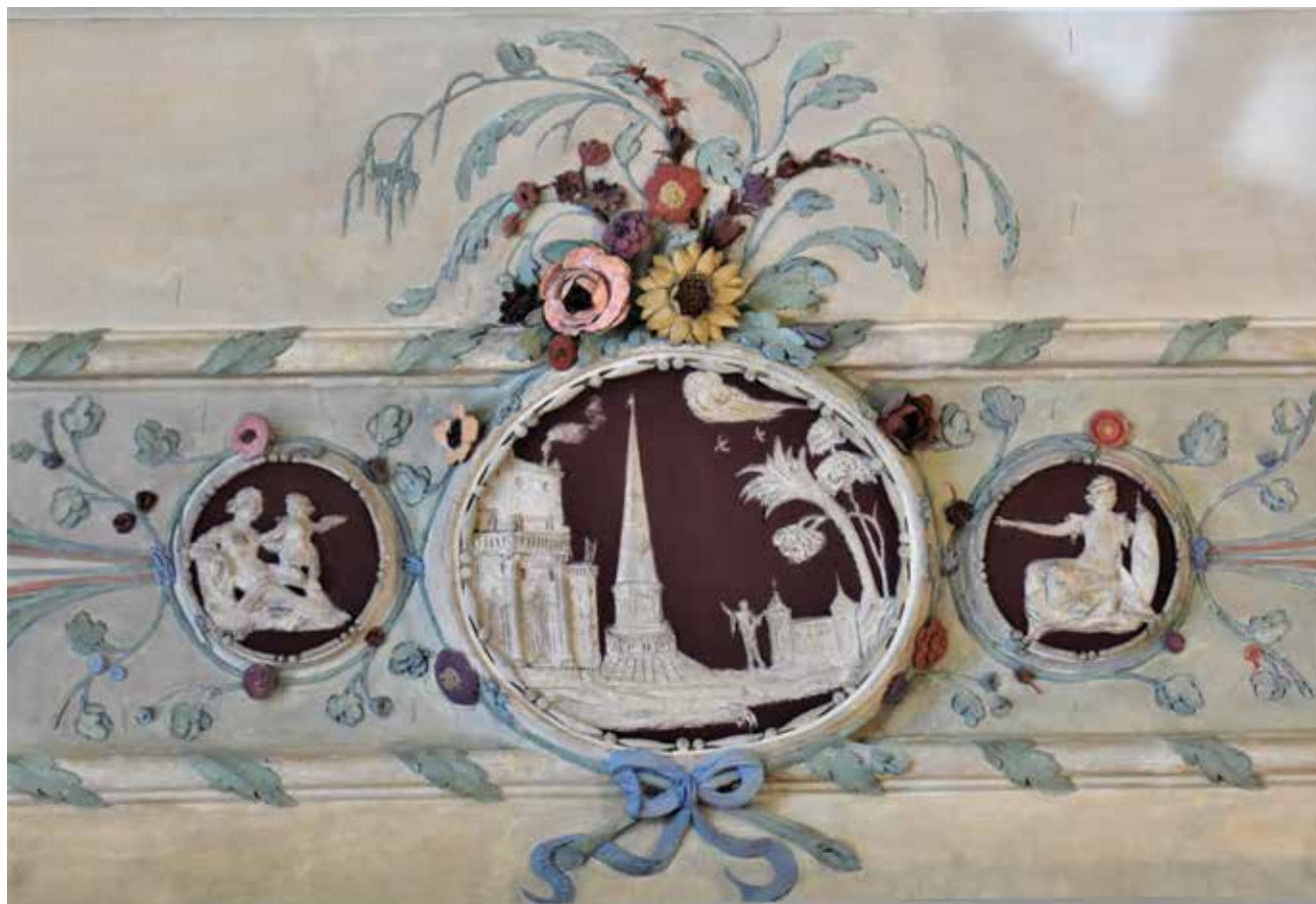
10. Medaljoni s fantastičnim pejzažima i antičkim kamejama na svodu zapadnog salona, Palača šećerane, Rijeka Medallions with fantastic landscapes and antique cameos in the vault of the western salon, Sugar Refinery Palace, Rijeka

kovanoj štuko-dekoraciji (sl. 9). Svod u zapadnom salonu sa zidnim oslikom arhitektonskih capriccia datiranima u 1789. godinu, omeđen je širokom trakom ispunjenom vrpčama i bokorima, a ona u sredini te u kutovima ima kružne medaljone obrubljene cvijećem i vrpčama. Na središnjem dijelu svoda nalazi se kvadratno polje dekorirano trakom s cvijećem i medaljonima, a u njegovom je centru ukras za vješanje lusteru omeđen spletom girlandi u obliku četverolista. Iz uglova kvadratnog polja dijagonalno se spuštaju vrpce ukrašene kopljima i medaljonima tvoreći tako četiri polja s kompozicijama sastavljenima od vojnih trofeja. Ljupke i gracilne grančice te girlande i bokori cvijeća vezani vrpčama posve su zamišljeni u duhu rokokoja, a taj dojam dodatno pojačava njihova polikromija izvedena u suglasju svijetlih zelenih, plavih, crvenih te žutih pastelnih tonova. Kontrast tim ukrasima pružaju medaljoni poput antičkih kameja ispunjeni bijelo bojanim reljefom naspram tamne kestenjaste podloge (sl. 10). U većim medaljonima slikarskom su lakoćom izvedeni fantastični krajolici i arhitektonski capricci s ruševinama, mostovima, kulama, a na jednom je prikazana i erupcija vulkana (sl. 11) Nije naodmet napomenuti kako su ondašnju Europu fascinirale erupcije Vezuva između 1764. i 1779. godine te da je ta dramatična prirodna pojava ostala zabilježena, ne samo u znanstvenim krugovima nego i u brojnim grafikama i slikama (sl. 12). 31 U manjim su me-