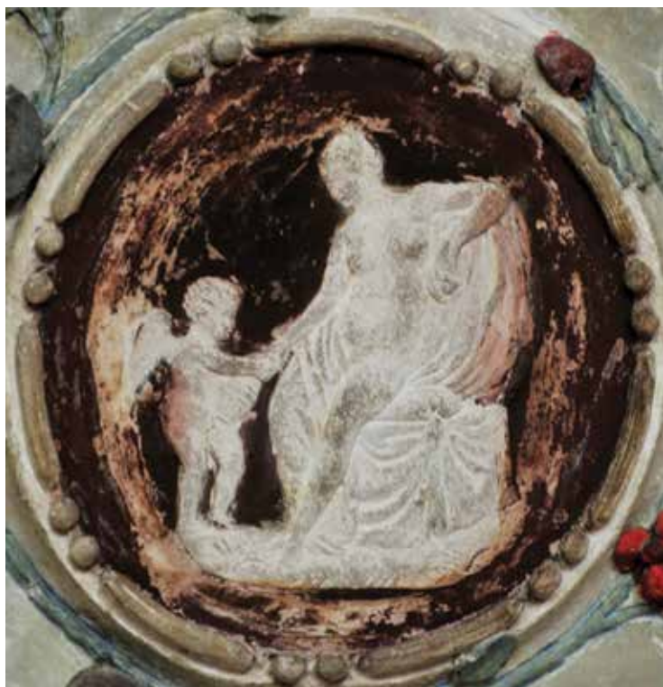
17. Kameja s likom Venere s puttom i vrčem u zapadnom salonu, Palača šećerane, Rijeka Cameo with the depiction of Venus with a putto and a jug in the western salon, Sugar Refinery Palace, Rijeka