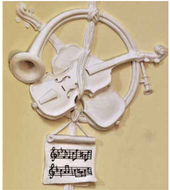
23. Clemente i Giacomo Somazzi, glazbeni trofeji, župna crkva svetog Antuna Opata, Veli Lošinj Clemente and Giacomo Somazzi, music trophies, parish church of St Anthony the Abbot, Veli Lošinj