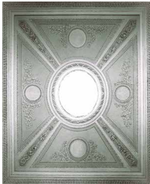
8. Gaspare Paoletti, Giocondo i Grato Albertolli, Vestibul plesne dvorane, Villa di Poggio Imperiale, Firenca (Catalogo generale di Beni Culturali d'Italia)

Vault in the loggia of Villa Madama in Rome, from the atlas Vestigia delle terme di Tito e loro interne pitture, Rome, 1776