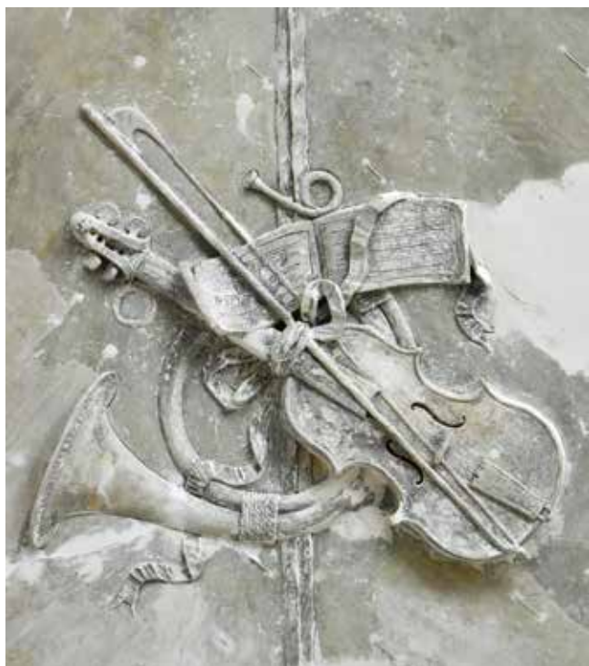
22. Glazbeni trofeji u istočnom salonu, Palača šećerane, Rijeka

Music trophies in the eastern salon, Sugar Refinery Palace, Rijeka