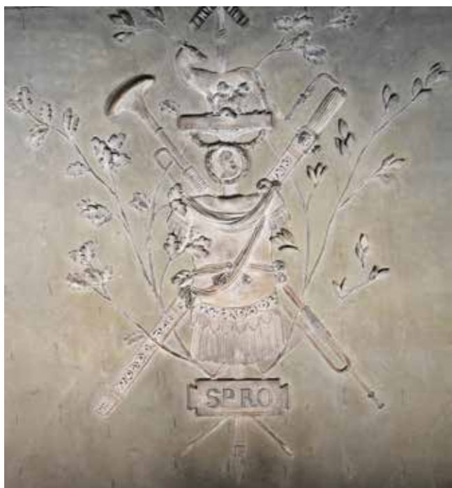
19. Ratnički trofeji u zapadnom salonu, Palača šećerane, Rijeka

War trophies in the western salon, Sugar Refinery Palace, Rijeka