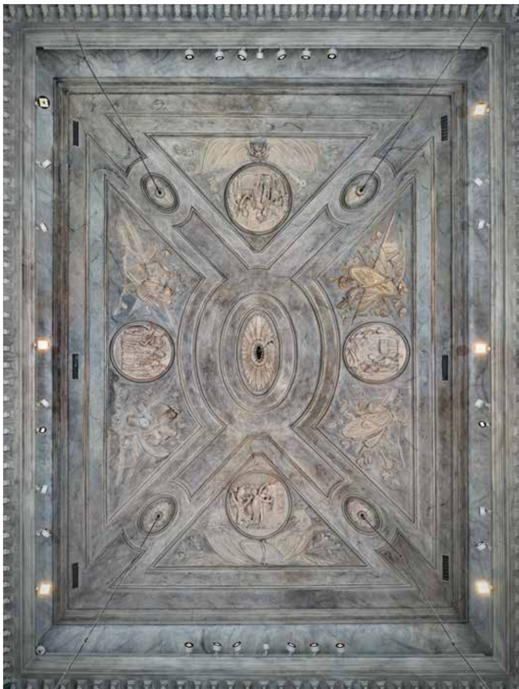
4. Svod u Svečanoj dvorani, Palača šećerane, Rijeka Vault in the Ceremonial Hall, Sugar Refinery Palace

Proto e stucador, e Clemente Somazzi suo compagno. 22 Taj važan podatak govori nam o poslovnoj vezi dvojice majstora koja je najvjerojatnije započela u Rijeci, i to upravo na obnovi Palače šećerane.