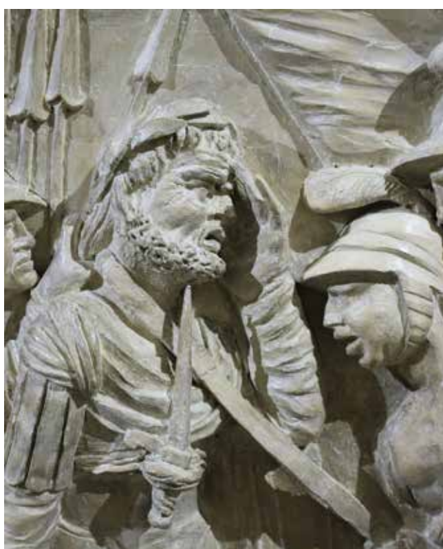
25. Detalj lica Vitellija (?) iz Svečane dvorane, Palača šećerane, Rijeka

Clemente and Giacomo Somazzi, detail of the faces of Saint Christopher and the Child Jesus, Rab Cathedral