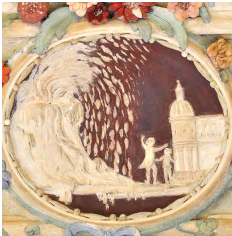
11. Prikaz erupcije vulkana na medaljonu u zapadnom salonu, Palača šećerane, Rijeka

Depiction of volcano eruption on a medallion in the western salon, Sugar Refinery Palace, Rijeka