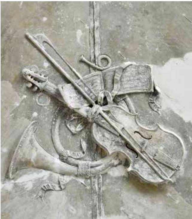
22. Glazbeni trofeji u istočnom salonu, Palača šećerane, Rijeka Music trophies in the eastern salon, Sugar Refinery Palace, Rijeka