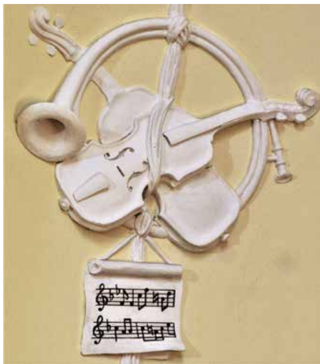
23. Clemente i Giacomo Somazzi, glazbeni trofeji, župna crkva svetog Antuna Opata, Veli Lošinj

Music trophies in the eastern salon, Sugar Refinery Palace, Rijeka