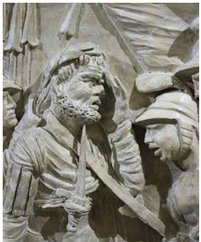
25. Detalj lica Vitellija (?) iz Svečane dvorane, Palača šećerane, Rijeka Detail of the face of Vitellius (?) from the Ceremonial Hall, Sugar Refinery Palace, Rijeka