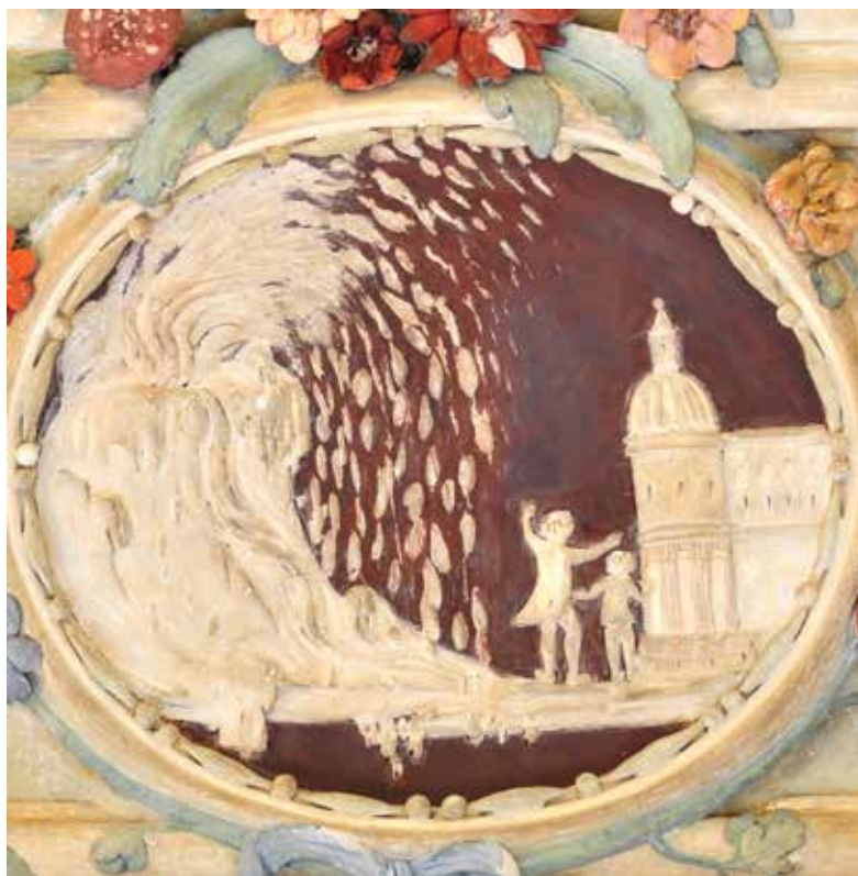
11. Prikaz erupcije vulkana na medaljonu u zapadnom salonu, Palača šećerane, Rijeka

Depiction of volcano eruption on a medallion in the western salon, Sugar Refinery Palace, Rijeka