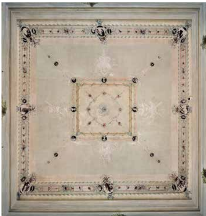
9. Svod zapadnog salona, Palača šećerane, Rijeka Vault of the western salon, Sugar Refinery Palace, Rijeka

kovanoj štuko-dekoraciji (sl. 9). Svod u zapadnom salonu sa zidnim oslikom arhitektonskih capriccia datiranima u 1789. godinu, omeđen je širokom trakom ispunjenom vrpčama i bokorima, a ona u sredini te u kutovima ima kružne medaljone obrubljene cvijećem i vrpčama. Na središnjem dijelu svoda nalazi se kvadratno polje dekorirano trakom s cvijećem i medaljonima, a u njegovom je centru ukras za vješanje lusteru omeđen spletom girlandi u obliku četverolista. Iz uglova kvadratnog polja dijagonalno se spuštaju vrpce ukrašene kopljima i medaljonima tvoreći tako četiri polja s kompozicijama sastavljenima od vojnih trofeja. Ljupke i gracilne grančice te girlande i bokori cvijeća vezani vrpčama posve su zamišljeni u duhu rokokoja, a taj dojam dodatno pojačava njihova polikromija izvedena u suglasju svijetlih zelenih, plavih, crvenih te žutih pastelnih tonova. Kontrast tim ukrasima pružaju medaljoni poput antičkih kameja ispunjeni bijelo bojanim reljefom naspram tamne kestenjaste podloge (sl. 10). U većim medaljonima slikarskom su lakoćom izvedeni fantastični krajolici i arhitektonski capricci s ruševinama, mostovima, kulama, a na jednom je prikazana i erupcija vulkana (sl. 11) Nije naodmet napomenuti kako su ondašnju Europu fascinirale erupcije Vezuva između 1764. i 1779. godine te da je ta dramatična prirodna pojava ostala zabilježena, ne samo u znanstvenim krugovima nego i u brojnim grafikama i slikama (sl. 12). 31 U manjim su me-