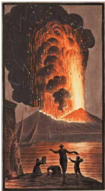
12. Ilustracija erupcije Vezuva 1779 iz djela Williama Hamiltona, Supplement to Campi Phlegraei iz 1779.

Depiction of volcano eruption on a medallion in the western salon, Sugar Refinery Palace, Rijeka