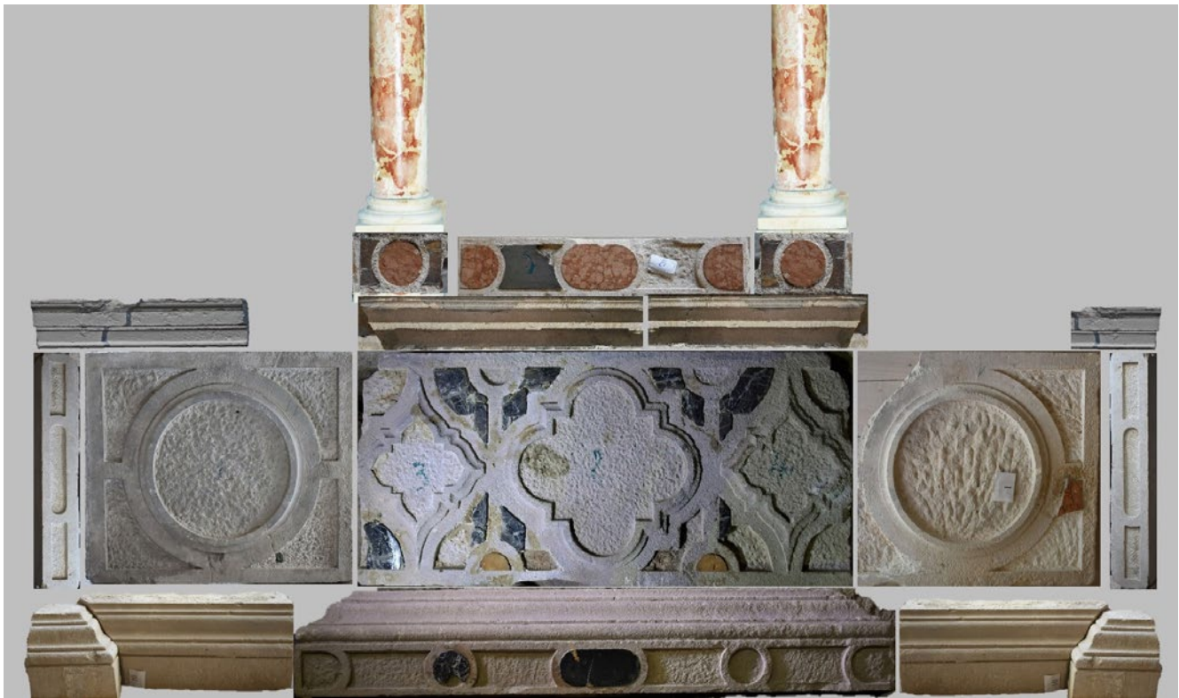
15. Rekonstruirani izgled donjeg dijela oltara iz kapele Svetog Mihovila složen od sačuvanih fragmenata (rekonstrukcija: D. Tulić, M. Pintarić)

Reconstructed appearance of the lower section of the altar from the chapel of St Michael, composed of preserved fragments (reconstruction: D. Tulić, M. Pintarić)