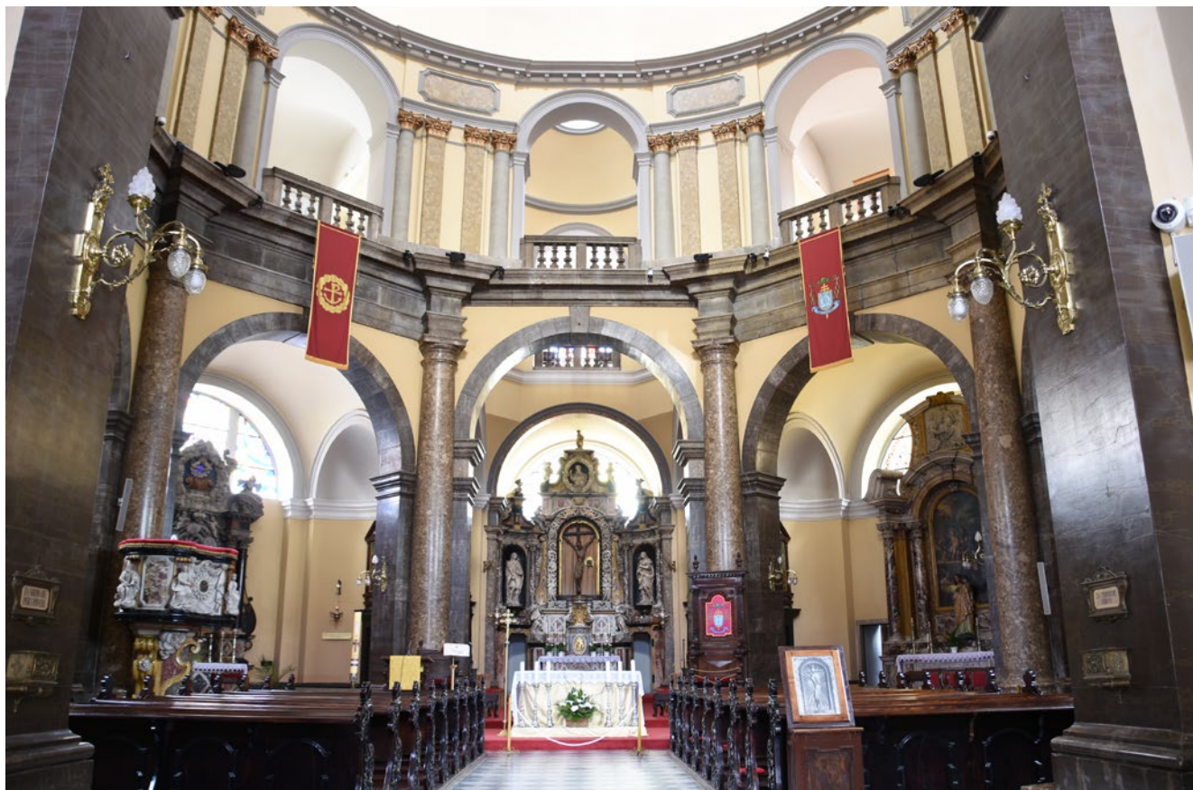
1. Unutrašnjost nekadašnje riječke isusovačke crkve Svetog Vida

Interior of the former Jesuit Church of St Vitus in Rijeka