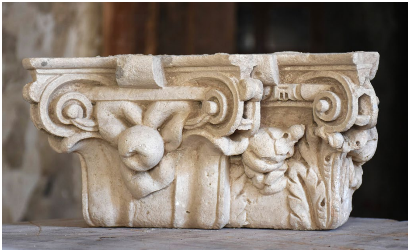
17. Leonardo Pacassi i radionica, polukapitel desnog pilastra oltara iz kapele Svetog Mihovila u bakarskom kaštelu

Leonardo Pacassi and his workshop, engaged capital of the right altar pilaster from the chapel of St Michael in the Bakar castle