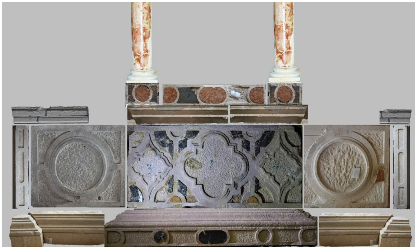
15. Rekonstruirani izgled donjeg dijela oltara iz kapele Svetog Mihovila složen od sačuvanih fragmenata (rekonstrukcija: D. Tulić, M. Pintarić)

Reconstructed appearance of the lower section of the altar from the chapel of St Michael, composed of preserved fragments (reconstruction: D. Tulić, M. Pintarić)