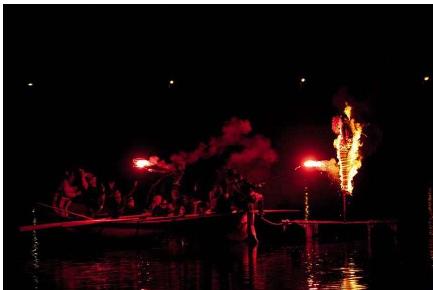
Slika 1: Paljenje pusta na moru