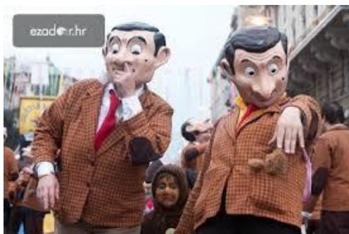
Slika 10: Mr. Bean

Također, ljudi se kostimiraju u poznate likove popularnih filmova, npr. Mr. Bean, Harry Potter.