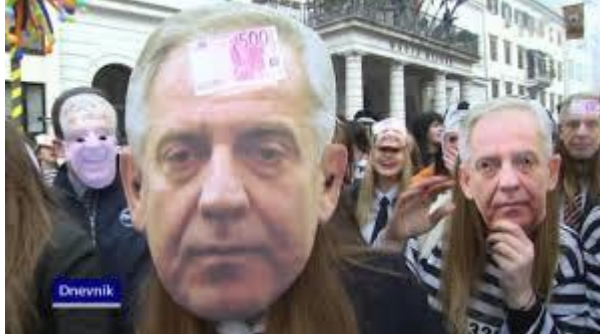
Slika 8. Ćaća se vraća

godine obilježili i ostavili utisak npr. maskirali su se u „Škegra“ kad je uveden PDV. Zatim primjetne su maske i drugih političara - Franje Tuđmana, Stjepana Mesića, Jadranke Kosor, Ive Josipovića, Ive Sanadera, Slavka Linića itd.