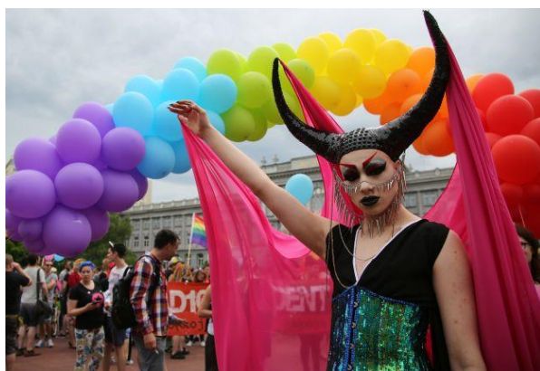
Slika 3: Gay parada u Zagrebu 11.lipnja 2016.