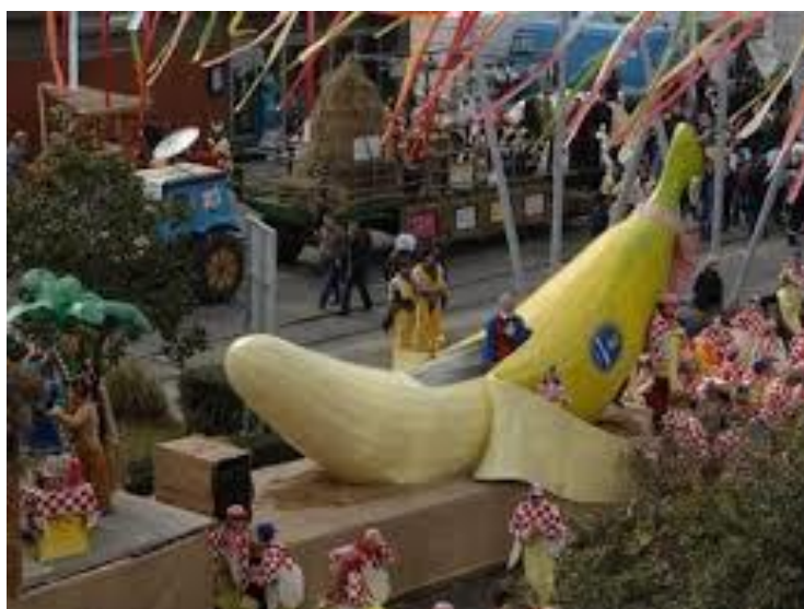
Slika 6: Hrvatska u banani

godine predstavlja igru. Odraslima je igra „zabranjena“ te se kroz maske oslobađaju i igraju u svojim odabranim ulogama. Ali pored toga uvijek će biti i pojedinaца koji će to doba iskoristiti za iskazivanje mišljenja o političkim situacijama, a toga nikada nije dosta, jer ipak, to je doba kada je sve dozvoljeno i jedino doba godine kada bez straha „u šali“ možemo reći sve što mislimo. To je doba kada maskama reagiramo na aktualne društvene događaje.