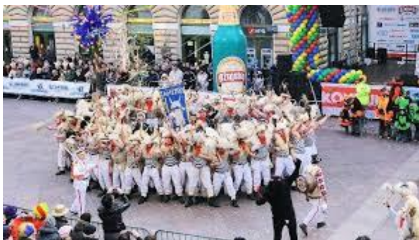
Slika 16. Halubajski zvončari

raznim manifestacijama u vrijeme mesopusnih običaja od Antonje do Pepelnice, daje Rijeci i njezinom karnevalu veliki značaj, ugled i ponos. Ono na što grad Rijeka i okolica mogu biti izuzetno ponosni je činjenica da su 2000. godine zvončari kastavštine uvršteni na UNESCO-ovu listu hrvatskih nematerijalnih kulturnih dobara. 100