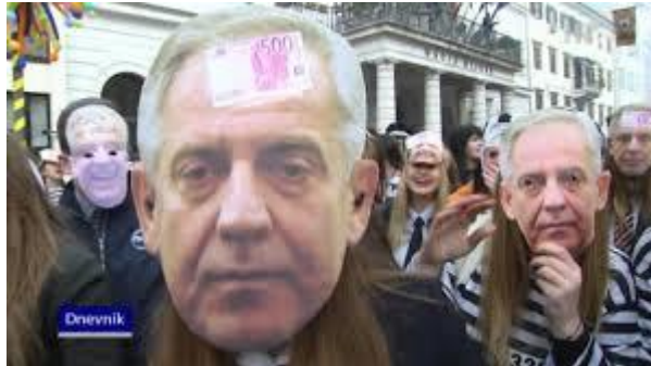
Slika 8. Ćaća se vraća

godine obilježili i ostavili utisak npr. maskirali su se u „Škegra“ kad je uveden PDV. Zatim primjetne su maske i drugih političara - Franje Tuđmana, Stjepana Mesića, Jadranke Kosor, Ive Josipovića, Ive Sanadera, Slavka Linića itd.