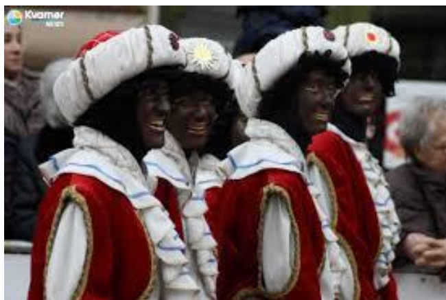
Slika 14: Riječki morčići