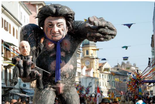
Slika 9: Parodija na Zdravka Mamića i HNS