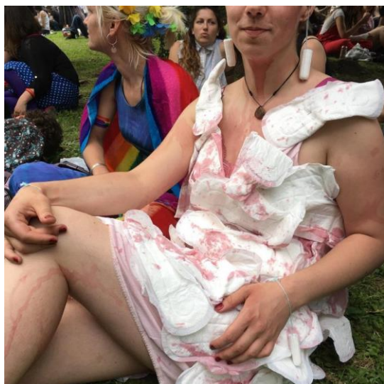
Slika 2: Gay parada u Zagrebu 11.lipnja 2016.