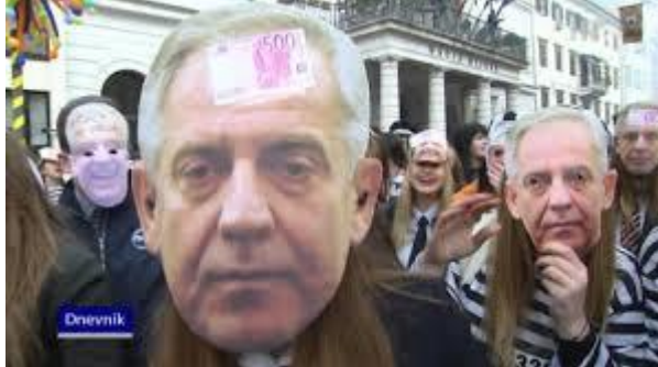
Slika 8. Ćaća se vraća

godine obilježili i ostavili utisak npr. maskirali su se u „Škegra“ kad je uveden PDV. Zatim primjetne su maske i drugih političara - Franje Tuđmana, Stjepana Mesića, Jadranke Kosor, Ive Josipovića, Ive Sanadera, Slavka Linića itd.