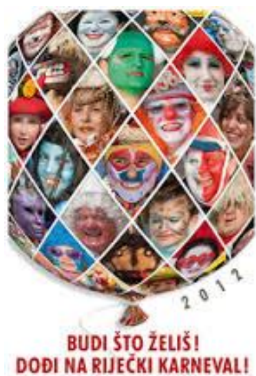
Slika 7: Plakat Riječkog karnevala

Također u povorci na Korzu ima mnoštvo vizualnih elemenata koji se odnose na prezentaciju maske, jer moto Riječkog karnevala glasi „Budi što želiš“ i prema tome sudionici kroz to oslobađaju svoje unutarnje osjećaje, želje i potrebe. Pokazuju ono što misle i karnevalska povorka im je prilika da to pokažu i iznesu. Dobar primjer su maske koje aludiraju na političare. Vidimo također i transformacije muškaraca u suprotni spol što se može shvatiti kao „fora“, a može se shvatiti i kao neka potisnuta želja koja se kroz moto „Budi što želiš“ oslobađa.