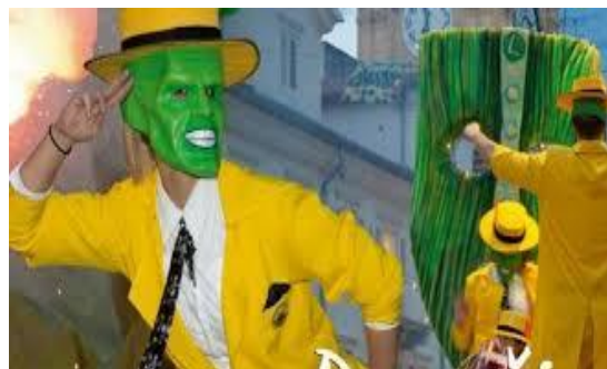
Slika 11: The Mask