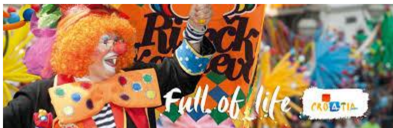
Slika 12. Promidžbeni materijal Riječkog karnevala 2016.

perioda. Stalni element koji se proteže kroz sve promidžbene materijale svake godine, svakako je stilizirani lik morčića koji se vragoljasto smiješi i postao je prepoznatljiv znak Riječkog karnevala.