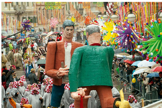
Slika 13. Lažni dogovori političara (s figom)