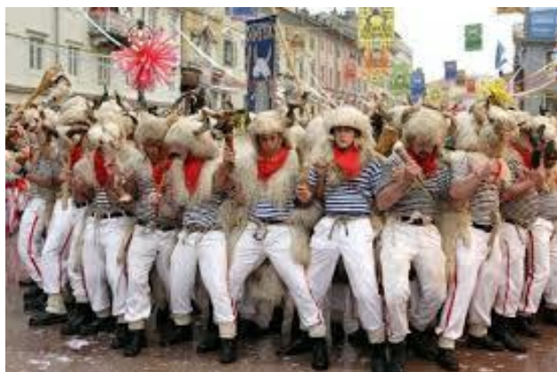
Slika 15. Zametski zvončari

Uz morčice, uz riječki kraj veže se još jedna veoma poznata maskota, a to su zvončari.