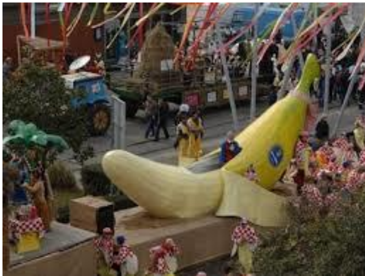
Slika 6: Hrvatska u banani

godine predstavlja igru. Odraslima je igra „zabranjena“ te se kroz maske oslobađaju i igraju u svojim odabranim ulogama. Ali pored toga uvijek će biti i pojedinaца koji će to doba iskoristiti za iskazivanje mišljenja o političkim situacijama, a toga nikada nije dosta, jer ipak, to je doba kada je sve dozvoljeno i jedino doba godine kada bez straha „u šali“ možemo reći sve što mislimo. To je doba kada maskama reagiramo na aktualne društvene događaje.