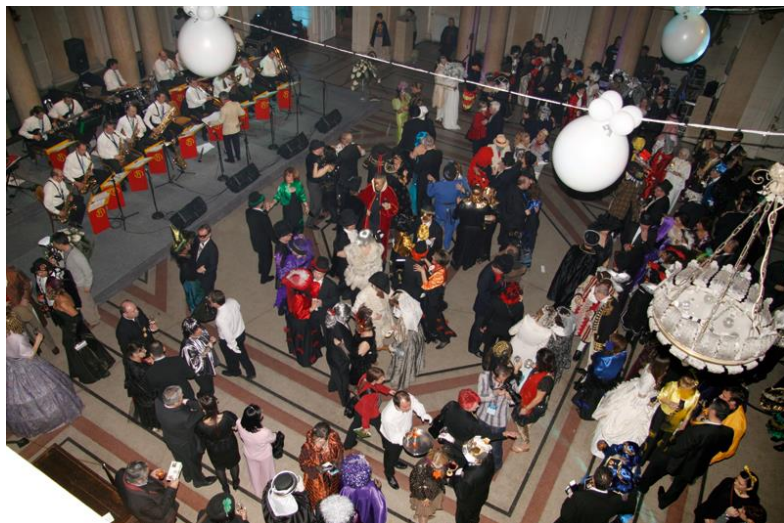
Slika 5: Humanitarni karnevalski bal

Tradicija koja je također veoma poznata u Rijeci je bal u Guvernerovoj palači koji se odvija dan prije Međunarodne karnevalske povorke. Povijest balova pod maskama u Rijeci u vrijeme karnevala seže u povijest. Naime, postojao je običaj za vrijeme mesopusta da se prijateljske obitelji nađu te da se zajedno zabave i provedu u plesu i pjevanju, ali također je ta zabava služila tome da se mladići i djevojke bolje upoznaju što je vrlo često, na zadovoljstvo obitelji, završavalo i brakom. No, svi ti plesovi činili su se siromašnima uspoređujući ih s raskošnim balom u domu tadašnjeg riječkog carskog kapetana koji je živio u Kaštelu sa cijelom svojom obitelji i rodbinom. Na tim noble baal , pod maskama su se okupljali samo odabrani uzvanici koji su bili ugledni Riječani sa svojim članovima obitelji, a posebnost je u tome što je biti na tom balu značio i statusni simbol. 38 Sličnost noble baal -a s današnjim balom pod maskama u Guvernerovoj palači je u tome što njemu također prisustvuju članovi diplomatskog kora u Republici Hrvatskoj zbog čega je uvijek i medijski popraćen. Posljednjih godina Karnevalski bal humanitarnog je karaktera te se prikupljene donacije doniraju u humanitarne svrhe.