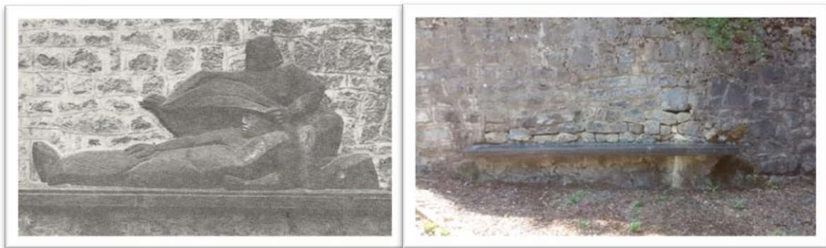
Slika 10. Izgled spomenika nekada; i danas

Kosturnica je rađena prema ideji arhitekta Vlade Ugrenovića i akademskog kipara Koste Angelija-Radovanija. Osim spomen-ploče, na kosturnici se prvobitno nalazio i brončani reljef, s potpisom Angelija-Radovanija. Na reljefu je bila prikazana bolničarka koja spašava ranjenika. No, 2010. godine došlo je do krađe tog brončanog kipa „Bolničarka njeguje ranjenika“ koji je dugačak čak tri metra. Slučaj je prijavljen policiji, ali počinitelji nisu poznati do danas, što vjerojatno neće ni biti. Na taj način je kompleks spomenika bolnice