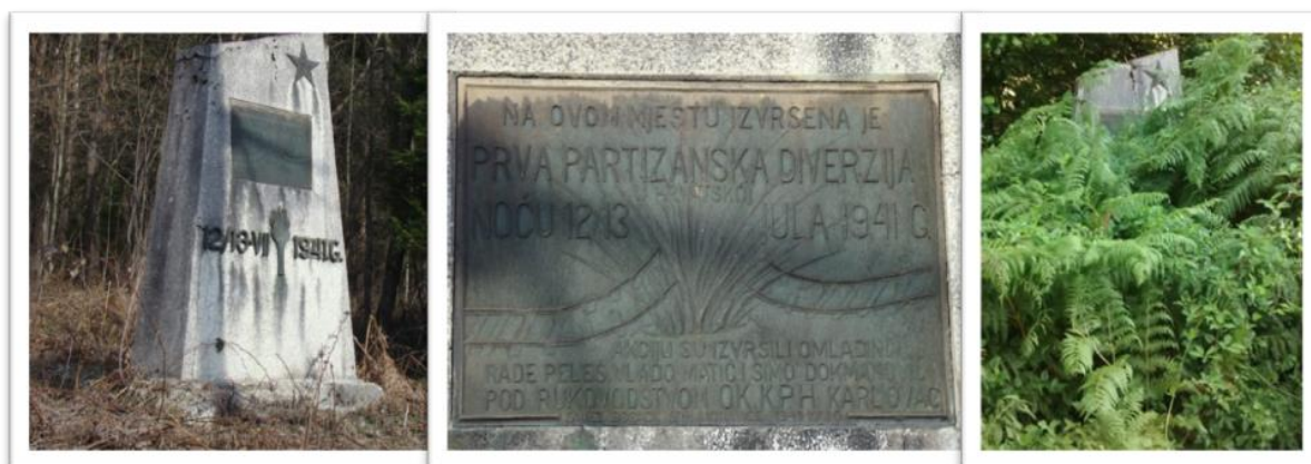
Slika 03. Spomenik prvoj partizanskoj diverziji, Moravice

Dakle, preko velikog partizana u borbi uz kojeg se nalazi žena u krik i dva reljefa, prikazana je povijest moravačkih antifašista u Narodnooslobodilačkoj borbi. Ovaj spomenik nalazi se u središtu parka ispred osnovne i srednje škole te se oko njega formirao razmještaj cijelog parka. Zanimljivo je da je tekst na spomeniku napisan samo na ćirilici te je na taj način uskraćena informacija o spomeniku posjetiteljima koji se ne koriste ćirilicnim pismom. Slova uništena od zuba vremena, obnovljena su 2012. godine od strane Grada Vrbovskog, koji je ujedno obnovio i preuredio cijeli park. 34