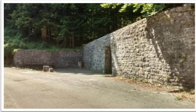
Slika 09. Spomen-kosturnica

do 1944. godine nalazila u šumi blizu ovog mjesta gdje su kao teški ranjenici podlegli ranama i ovdje našli svoj grob.“ 55