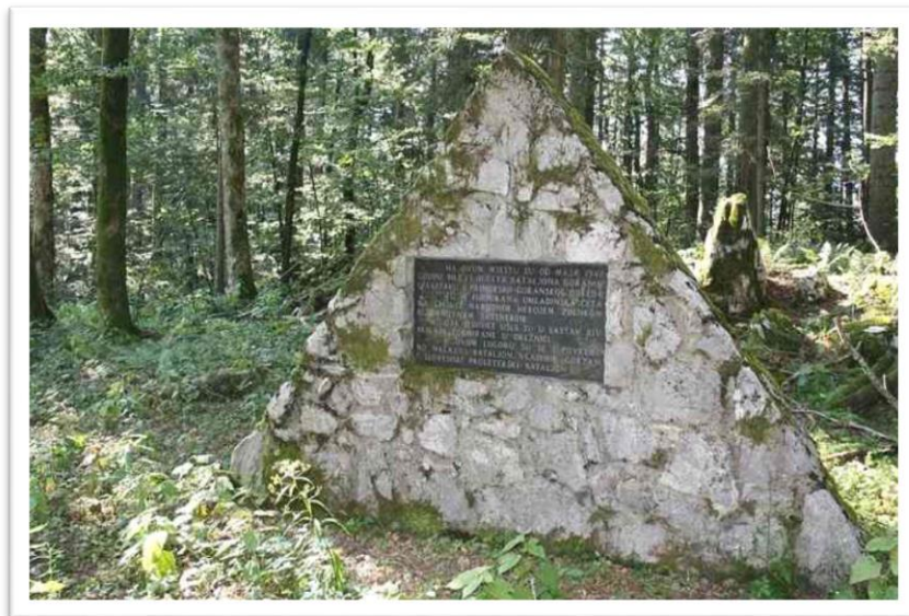
Slika 07. Spomen-piramida na Praprotu

Jedno od bitnih mjesta sjećanja za delnički kraj je spomen-područje Praprot. Naime, 1942. godine, pred jakim neprijateljskim snagama, jedinice Bataljona "Goranin" morale su se povući u šumu. Kao najpovoljnija lokacija