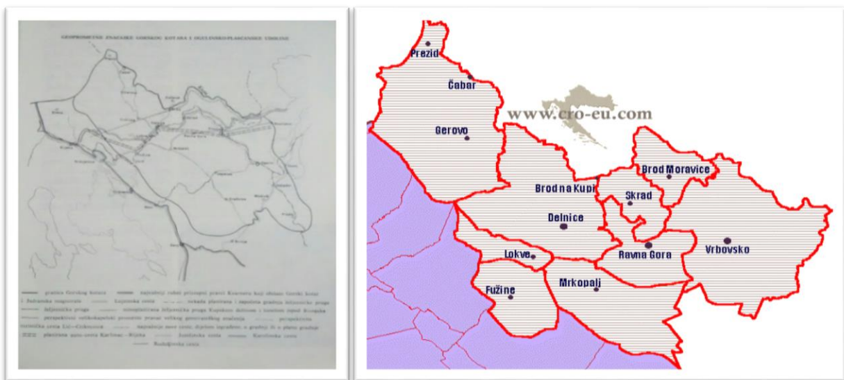
Slika 01. Granice Gorskog kotara nekad i danas

Problem definiranja granica Gorskog kotara na istoku i jugoistoku oduvijek predstavljaju problem. Naime, na istoku Gorski kotar dodiruje se s Ogulinsko-plašćanskom udolinom i Karlovačkim Pokupljem. Poneki autori svrstavaju ovo prijelazno područje u Gorski kotar, dok neki smatraju to područje odvojenom cjelinom, iako zemljopisne razlike i nisu toliko izrazite (očita je različitost višeg i šumski zatvorenog gorskog bloka i otvorenih pejzaža niže krške ploče).