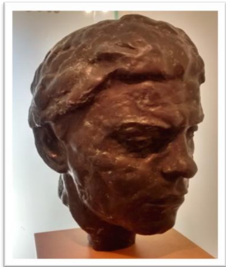
Slika 13. Skulptura Ivana Gorana Kovačića

Svoj doprinos ovom memorijalnom muzeju i memorijalnom spomen-području dao je i Velibor Mačukatin koji je izradio skulpturu Ivana Gorana Kovačića lijevanu u bronci. Skulptura se čuva na prvom katu Muzeja u Lukovdolu, ali osim u Lukovdolu, identična skulptura je napravljena i za Muzej revolucije u Zagrebu.