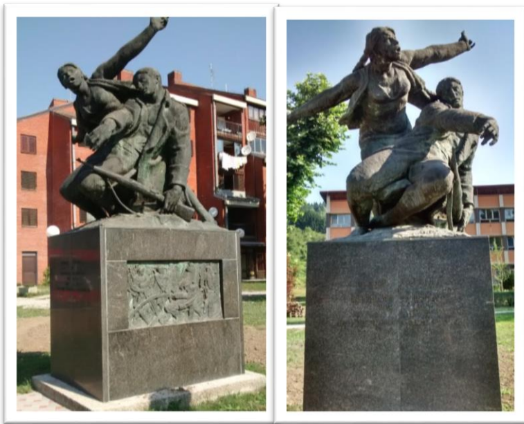
Slika 02. Spomenik Palim borcima NOB-a i žrtvama fašizma Srpske Moravice

Na takav način nastao je spomenik Palim borcima NOB-a i žrtvama fašizma 1941-1945. podignut 1951. godine u tadašnjim Srpskim Moravicama. Djelo je to kipara Velibora Mačukatina, jednog od istaknutih kipara poslijeratnog kiparstva. Spomenik se zasniva na realističkom prikazu generalno sažetih volumena likova koji dramatičnim gestama posežu u prostor da bi