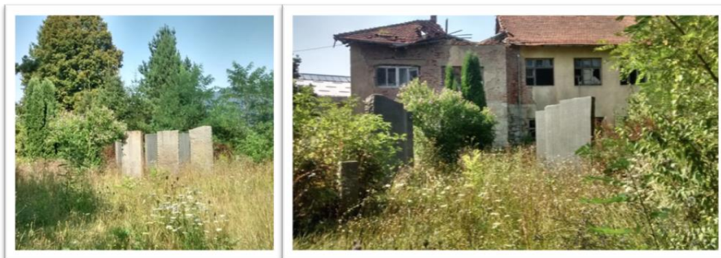
Slika 11. Mramorne ploče sa uklesanim imenima stradalih

Nedaleko ovog spomenika ustanku, 1968. godine podignut je spomen-park ispred osnovne škole. Park je podignut u čast palim borcima i žrtvama fašističkog terora. U parku su podignute velike mramorne ploče na kojima su ispisana imena 260 palih boraca i 630 žrtava fašističkog terora. Osim toga, u parku se nalaze i biste narodnih heroja Đure i Rajka Trbovića. Cijeli spomen-park nastao je na ideji akademskog kipara Stanislava Mišića. Danas nije moguće doći do tog parka zbog zarasle trave i napuštenog područja.