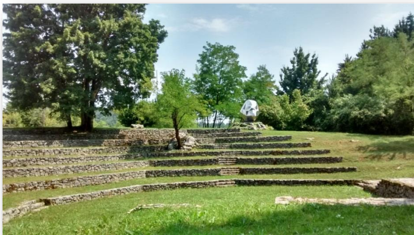
Slika 12. Današnji izgled amfiteatra

Svaka prošlost interpretirana je pomoću nečijeg osobnog sjećanja, a povijest postaje smisljena u trenutku kada tumačimo prošlost u kontekstu sadašnjosti. Shodno tome povijest nastaje na temelju prošlosti koja je proizašla iz kulture sjećanja. Cipek smatra da se u konačnici „veza između kulture sjećanja, sjećanja pojedine grupe, i službenog tumačenja povijesti, ostvaruje u muzeju.“ 63