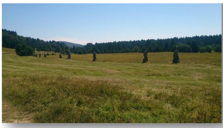
Slika 15. Spomenik podignut u čast 26 smrznuta partizana

Na Dan ustanka u Hrvatskoj, 27. srpnja 1969. godine, u povodu 25-godišnjice smrti 26 boraca, svečano je otkriven spomenik, postavljen u 26 kipova u nizu, s nepravilnim razmacima, baš kao što su stajali borci te kobne noći. Doživljavamo ih poput laganog hoda smrznutih ljudskih figura. Svaki pojedini spomenik visok je oko dva i pol metra, a širok između 0,80 i jednog metra. Pored ovih spomenika, postavljen je i spomenik u obliku trostrane prizme s učeničkim tekstovima na svakoj strani. “Nevina i prostodušna poetičnost misli kojima se dječja mašta uživljuje u patnju i žrtvu boraca - dirljiva je. Prisutnost najmlađih osjeća se kod spomenika zalog nezaborava. Ona pribavlja lapidarnoj snazi spomenika biljeg najhumanijeg, najneposrednijeg suosjećanja.” 68 Iz godine u godinu se okupljalo sve više i više ljudi u znak sjećanja na stradale. Svoja suosjećanja najviše su pokazali učenici osnovnih škola koji su svojim radovima sudjelovali u Memorijalu.