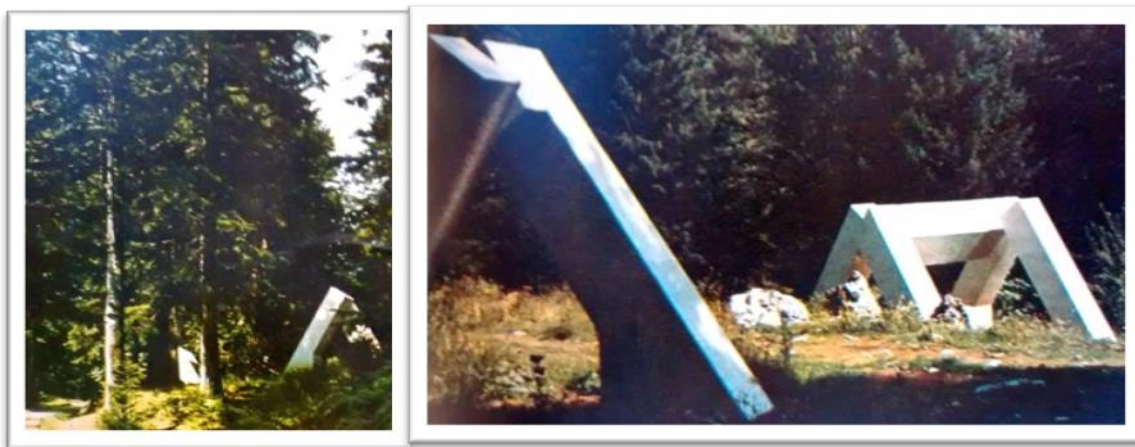
Slika 08. Nekadašnji izgled spomenika posvećen partizanskoj bolnici

Tako je na tom mjestu 1981. godine podignut spomenički kompleks po ideji arhitekta Zdenka Kolacija koji je obilježen simbolima bolničkih objekata. Spomenik je otkriven 10. listopada 1981. u čast 40-godišnjice prvog oslobođenja Drežnice. No, danas, ljudi tog kraja kao da su zaboravili na ta vremena i sjećanja vezana uz bolnicu. Tome je pridonijelo i smještanje spomeničkog kompleksa duboko u šumu, do kojeg vodi neprohodan put bez ijedne table koja usmjeruje ka tom mjestu sjećanja. Naime, taj spomenik više ne postoji na tom mjestu, niti se zna kako je nestao. Na slici 08. prikazano je kako je nekada izgledao spomenik posvećen bolnici.