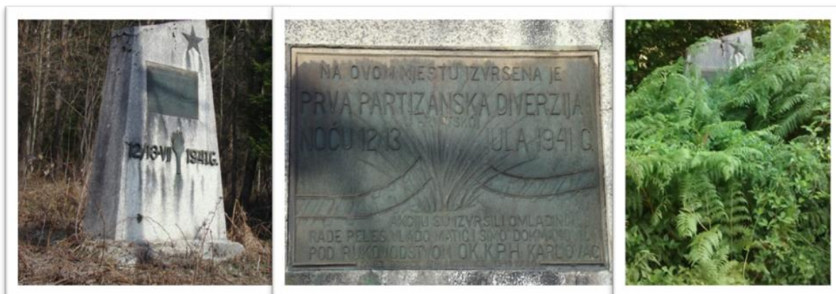
Slika 03. Spomenik prvoj partizanskoj diverziji, Moravice

Dakle, preko velikog partizana u borbi uz kojeg se nalazi žena u kriku i dva reljefa, prikazana je povijest moravačkih antifašista u Narodnooslobodilačkoj borbi. Ovaj spomenik nalazi se u središtu parka ispred osnovne i srednje škole te se oko njega formirao razmještaj cijelog parka. Zanimljivo je da je tekst na spomeniku napisan samo na ćirilici te je na taj način uskraćena informacija o spomeniku posjetiteljima koji se ne koriste ćirilичnim pismom. Slova uništena od zuba vremena, obnovljena su 2012. godine od strane Grada Vrbovskog, koji je ujedno obnovio i preuredio cijeli park. 34