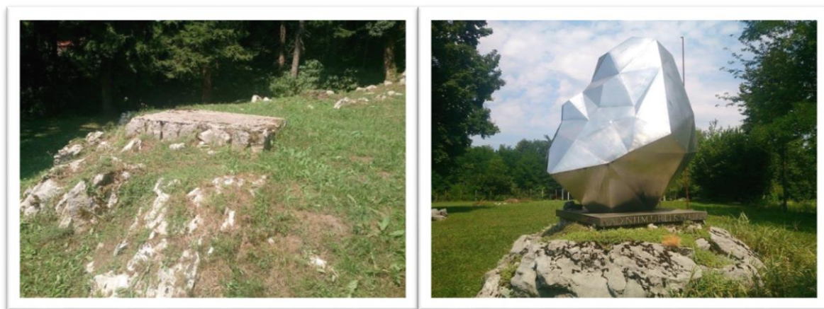
Slika 06. Nekadašnje mjesto spomenika; spomenik danas

Iako je ovo djelo rađeno pedesetih godina 20. stoljeća, 40 ne izgleda kao i većina djela nastalih u tom vremenu - monumentalni spomenici koji teže pokretu, dinamici i ističu se u prostoru u kojem se nalaze. U takvim okvirima nastao bi spomenik u liku Ivana Gorana Kovačića kako ponosno stoji na postolju, vjerojatno u jednoj ruci držeći knjigu, a u drugoj pušku, prosječne visine 3 metra. No, ovo djelo sasvim je drugačije od ovih tipičnih spomenika. Razlikuje ga to što, kao prvo, nije nastao na temu Narodnooslobodilačke borbe, rata već u ime Ivana Gorana Kovačića, pjesnika i antifašističkog borca. Drugo, djelo je apstraktnog oblika, za razliku od ostalih realističnih spomenika diljem Gorskog kotara. „Početkom 50-ih godina političke promjene u Hrvatskoj (odnosno u tadašnjoj Jugoslaviji) uvjetovale su stvaranje nove kulturne klime, a kao jedno od važnijih obilježja u navedenom razdoblju moguće je istaknuti promjene manifestirane unutar umjetničke sfere koja je tada imala izuzetan politički značaj.“ 41 Socijalistički modernizam okarakteriziran je „relativnom liberalnošću sustava, otvorenošću granica i slobodnom razmjenom ideja, te politikom nesvrstanosti...“ 42 U takvim uvjetima nastalo je djelo Vojina Bakića koje je otkriveno 04.