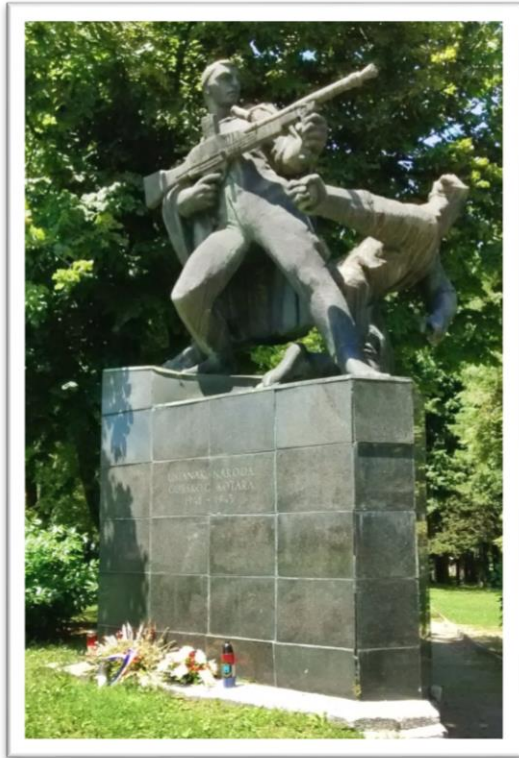
Slika 04. Spomenik ustanku naroda Gorskog kotara Delnice

Još jedan od spomenika podignutih u čast i na spomen događaja, vojnih jedinica, boraca i ostali koji su dali svoje živote u Narodnooslobodilačkoj borbi je i Spomenik ustanku naroda Gorskog kotara 1941-1945 podignut u Delnicama 1952. godine. Djelo je kipara Belizara Bahorića koji je zamislio spomenik tako da ga tvore dvojica partizana u jeku borbe: stojeći puškomitraljezac i klečeći bombaš. “Bahorić odrješito vodi linije kompozicije kroz pokret grupe, odriče se detalja i sabirnom modelacijom određuje volumen, naglašavajući time plastične odnose, napregnutost i prodornu, patetičnu razgibanost u prostoru.” 35 Ovaj spomenik nalazi se na ulazu u delnički park i uvertira je ostalim delničkim narodnim herojima čije su biste smještene u