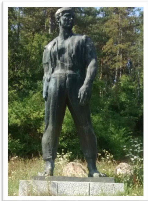
Slika 05. Spomenik „Drežničan“

Na potpuno drugačiji način od opisanih spomenika napravljen je Spomenik palom borcu u Drežnici koji je također realističan, no ne prikazuje partizane u borbi, u pokretu kao već opisana dva spomenika. Još jedno je to djelo Koste Angelija-Radovanija podignuto 1949. godine. Godinu kasnije, 1950. godine spomenik je nagrađen saveznom nagradom. Taj spomenik smatra se jednim od najljepših i najvrjednijih spomenika narodnooslobodilačkoj borbi na ovom području. Jedan od partizana koji je proživio muku i patnju rata, rekao je: „I jedino što smo ovdje dostojno pažnje postavili – to je onaj spomenik Drežničaninu, odista možda jedan od najljepših naših spomenika borcima, bitno različit od svih