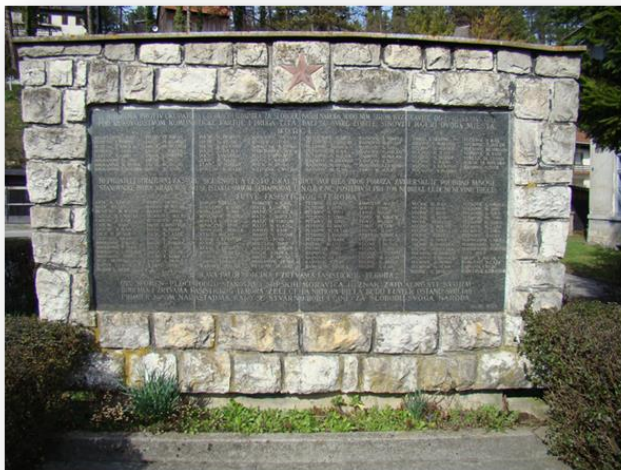
Slika 16. Današnja slika spomenika na željezničkoj stanici