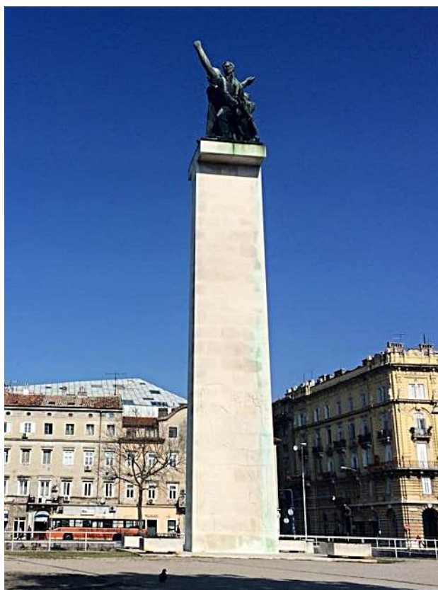
Slika 3: Vinko Matković: Spomenik oslobođenja Rijeke (1955),