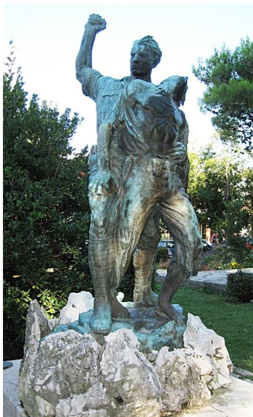
Slika 13: Zvonko Car: Spomenik palim borcima Crikvenica, (1949.)