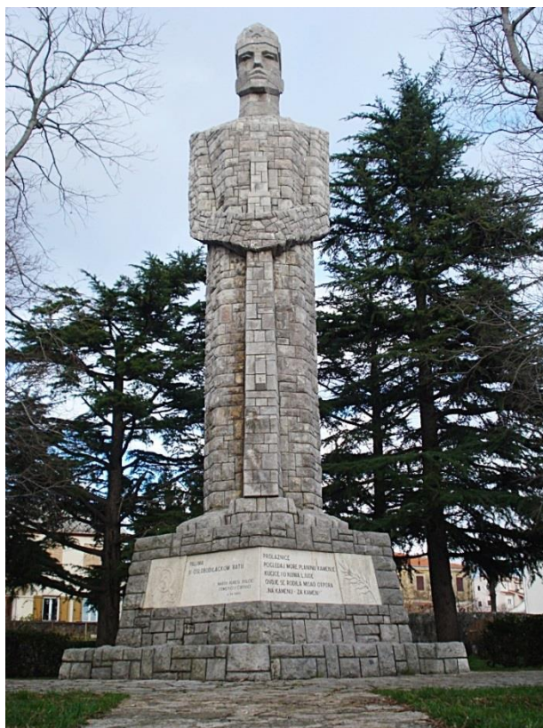
Slika 8: Vinko Matković: Spomenik palim borcima, Rubeši, (1963.)