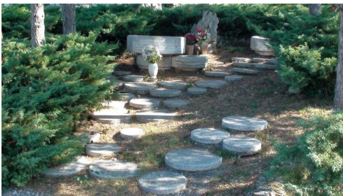
Slika 21: Maša Uravić: Spomen-kosturnica 74 palom borcu, Kraljevica, (1978.)