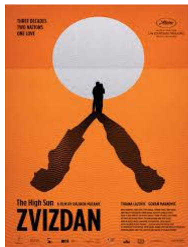
Slika 7: Naslovnica filma: „Zvizdan“