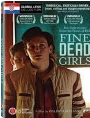
Slika 1: Naslovnica filma „Fine mrtve djevojke“

„Film je tek polazišna točka za ispitivanje stanja u kojem se kao društvo nalazimo, a na melodramatskom zapletu gradi se opasna i duhovita, zastrašujuća i na trenutke apsurdna, no prije svega upozoravajuća priča o tome što smo sve spremni učiniti jedni drugima, uvjereni da različitost ugrožava spokoj naših naoko skladnih života.“ 13