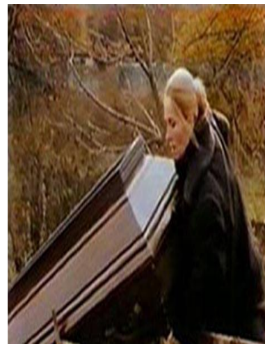
Slika 5: Naslovnica filma „Vrijeme za...“

„Ovog se filma s nelagodom i sramom danas prisjeća i njegova autorica Oja Kodar. Film iz 1993. nastao je kao hrvatsko-talijanska koprodukcija i očit je izraz tuđmanovske politike u kojoj su odnosi prema Srbima prikazani potpuno crno-bijelo.“ 28