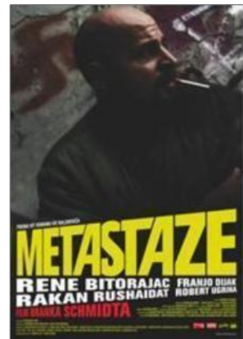
Slika 3: Naslovnica filma: „Metastaze“

Prvi film redatelja Branka Schmidta koji ću analizirati je film naziva „Metastaze“, zanimljiv zato jer je nastao prema književnom predlošku Ive Balenovića 19 . Djelo se pojavilo na hrvatskom tržištu 2006. godine, te zaintrigiralo hrvatsko književno društvo iz razloga jer nitko nije znao tko je zapravo Alen Bović. Tog imena nije bilo u imeniku, niti je prije što izdavao, a na romanu koji je izašao je umjesto bilježaka o piscu nalazilo samo otpusno pismo iz psihijatrijske bolnice i godina rođenja. Knjiga je progovarala o zagrebačkim alkoholičarima, drogerašima, nasilnicima i lopovima. Balenović navodi 20 kako je isfrustriran onime što je svakodnevno gledao i slušao, počeo o