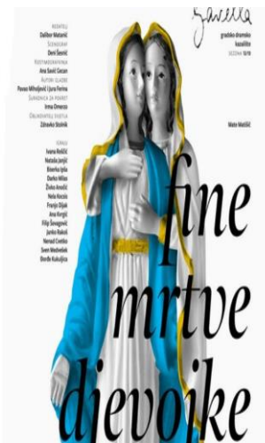
Slika 2: Kompromitirajući plakat predstavljen za predstavu „Fine mrtve djevojke“

Iza susretljivosti i ljubaznosti sustanara Ive i Marije, sakrivaju se mračne strane i motivi koji na vidjelo izlaze u trenutku kada susjedi saznaju kakav odnos Iva i Marija gaje jedna prema drugoj. U otkrivanju tajne koju su Iva i Marija krile se zapravo otkrivaju karakteristike ostalih likova filma. Da se tajna nije otkrila, ostali stanovnici tog kvarta živjeli bi uobičajenim životom. Otkrivanjem seksualne orijentacije svojih sustanara, otkriva se mračna strana Hrvatske realnosti. Naime, Matanić je na primjeru filma „Fine mrtve djevojke“ pokazao koliko je društvo netolerantno i puno mržnje, spremno ići do mjere ubojstva koje se na kraju filma i dešava u slučaju Marije koju sustanari bace po stepenicama, te ona umire. Prikaz realnosti hrvatskog društva, ne prikazuje se samo u filmu već i putem reakcija na film i kazališnu predstavu, a posebice plakat postavljen za potrebe predstavljanja predstave u kazalištu Gavella. Dizajner plakata bio je Vanja Cuculić, autor brojnih plakata i stalni suradnik kazališta Gavella, umjetnik uvršten na listu 115 najznačajnijih suvremenih hrvatskih umjetnika koju je objavio internetski portal engleskog vodiča Time Out Croatia. 14