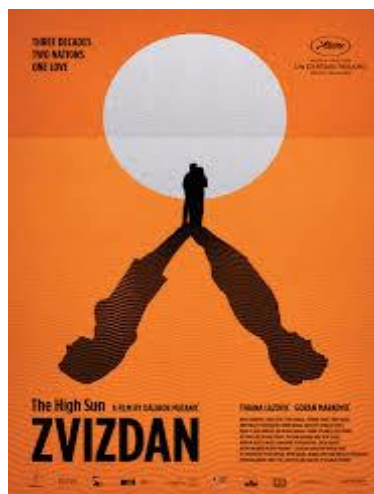
Slika 7: Naslovnica filma: „Zvizdan“