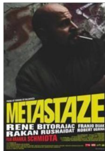
Slika 3: Naslovnica filma: „Metastaze“

Prvi film redatelja Branka Schmidta koji ću analizirati je film naziva „Metastaze“, zanimljiv zato jer je nastao prema književnom predlošku Ive Balenovića 19 . Djelo se pojavilo na hrvatskom tržištu 2006. godine, te zaintrigiralo hrvatsko književno društvo iz razloga jer nitko nije znao tko je zapravo Alen Bović. Tog imena nije bilo u imeniku, niti je prije što izdavao, a na romanu koji je izašao je umjesto bilježaka o piscu nalazilo samo otpusno pismo iz psihijatrijske bolnice i godina rođenja. Knjiga je progovarala o zagrebačkim alkoholičarima, drogerašima, nasilnicima i lopovima. Balenović navodi 20 kako je isfrustriran onime što je svakodnevno gledao i slušao, počeo o