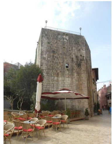
Slika 6: Peterokutna kula na samom početku Decumanus ulice (1474.)

Druga veoma bitna kula nalazi se na samom početku Dekumanove ulice. Radi se o Peterokutnoj kuli koja je u vrijeme svojeg nastanka predstavljala zajedno s kopnenim vratima ulaz u grad. „Nasuprot Peterokutnoj kuli nalazila se još jedna četvrtasta kula. Zajedno s gradskim vratima srušena je u 19. stoljeću, nakon što je izgubila svoju višestoljetnu obrambenu funkciju.“ 58 Danas se u Peterokutnoj kuli nalazi restoran, što možda i nije najbolje rješenje za kulturnu baštinu