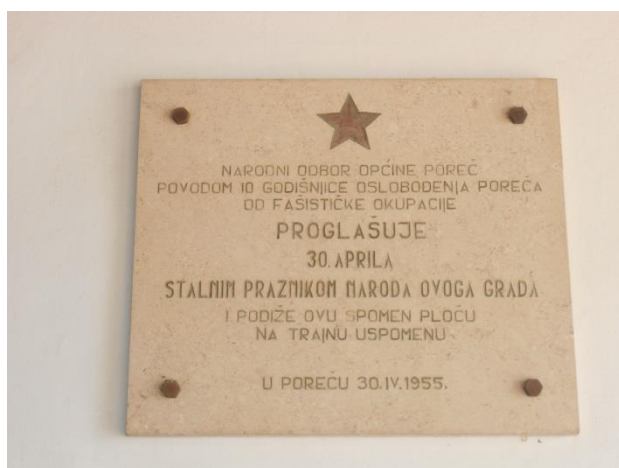
Slika 20: Ploča postavljena na zgradi Općine Poreč

sjećanje na dan kada se grad oslobodio od okupatora te brojna kulturna događanja, održava se sjednica Gradskog vijeća i obilaze se komemorativna mjesta koja utvrđuju sjećanja na ratna događanja. Ceremonijalno se polažu brojni vijenci pored antifašističke materijalne baštine i time se simbolizira velik značaj antifašističkog pokreta za grad. Ovim sjećanjima se potvrđuje svjesnost o prošlosti i utvrđuje pozicija s koje se gleda na nju. Primjer se može naći u govoru koji je održao gradonačelnik Poreča, Edi Štifanić, na ovogodišnjoj obljetnici oslobođenja od okupatora. On ističe: „Način na koji mi slavimo Dan oslobođenja Grada Poreča, dostojanstveno, s ponosom i zahvalnošću jednako tako pokazuje kakav je Poreč grad. Grad koji se ne srami antifašizma. Poreč prepoznaje vrijednosti koje smo dobili narodnooslobodilačkom borbom i žrtvom boraca u Drugom svjetskom ratu. I naravno, ne treba izjednačavati antifašizam i komunizam, ali to ne znači da smijemo negirati antifašizam koji je u temeljima ovoga grada.“ 127 Ovom izjavom se samo potvrđuje ono što je i vidljivo u gradu, a to je da su temeljna usmjerenja kulturne politike Poreča već odavno utvrđena i nadalje se mogu samo nadograđivati.