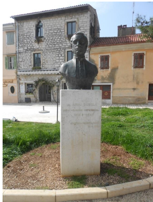
Slika 14: Kip Jurja Dobrile - preporoditelja istarskih Hrvata

se i u ponašanju prema njima od strane političkog sastava grada. Svake godine se posjećuju na bitnije svetkovine i samim time ne zaboravljaju. U neku ruku može ih se nazvati mjestima sjećanja koja su „u isti mah materijalna, simbolička i funkcionalna.“ 74 Oni su prikaz početka jedne vlasti u prošlom stoljeću te preko njih vidimo što je takva vlast štovala i što je bilo