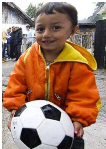
Dječak romske etničke manjine