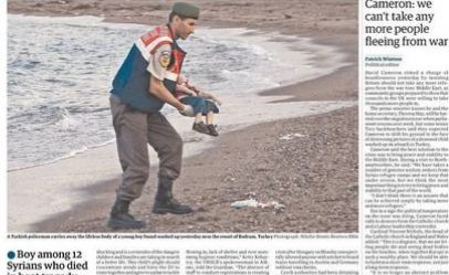
Un niño sirio muerto en la playa de Bodrum, Turquía, el 2 de septiembre de 2015.