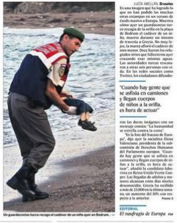
Un niño fallecido tras intentar cruzar el mar Egeo en un bote inflable.