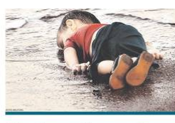
Un niño sirio muerto tras intentar cruzar el mar Egeo para llegar a la isla de Lesbos, Grecia.

Intervista a Moscovici: in Italia deve rispettare le regole. Intervista a Moscovici: in Italia deve rispettare le regole. Intervista a Moscovici: in Italia deve rispettare le regole.