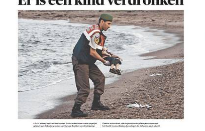
Un niño fallecido tras intentar cruzar el mar Egeo en un bote inflable.