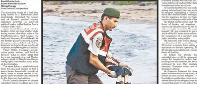
Bodies of infants washed up on beaches

Political leaders paralysed by crisis over migrant quotas. Political leaders paralysed by crisis over migrant quotas. Political leaders paralysed by crisis over migrant quotas.