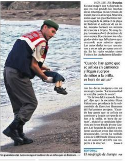
Un niño sirio muerto tras intentar cruzar el mar Egeo para llegar a la isla de Lesbos, Grecia.