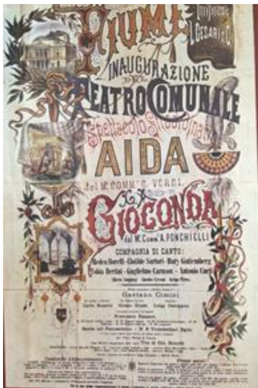
Prilog 3.2.3, Plakat prve predstave održane 1885., izvor: Narodno kazalište Ivan Zajc , RADMILA MATEJČIĆ, Povijest gradnje Općinskog kazališta u Rijeci , Rijeka, 1981.