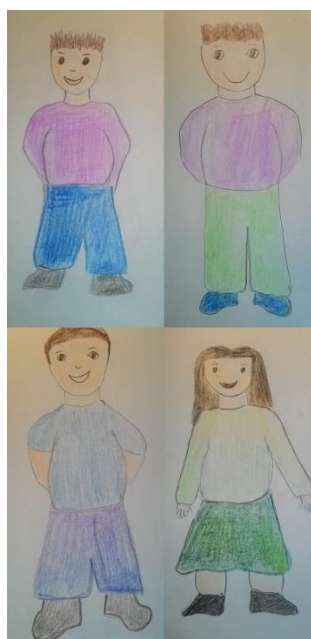
Četvero pretile djece 5