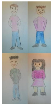
Troje djece normalne težine i jedno pretilo dijete 6