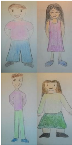
Dvoje djece normalne težine i dvoje pretile djece 3