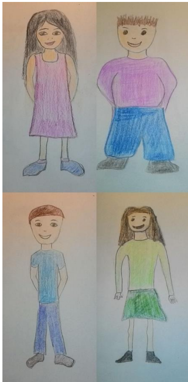
Slika 3. Primjer grupe od troje djece normalne težine i jednim pretilim djetetom

Korišten je također i jedan A4 papir na kojem je velikim tiskanim slovima napisana skala za odgovore sljedećeg oblika: