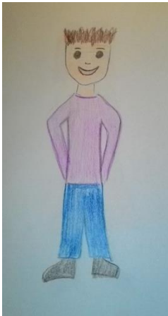
Blizanac normalne težine 10 (m)