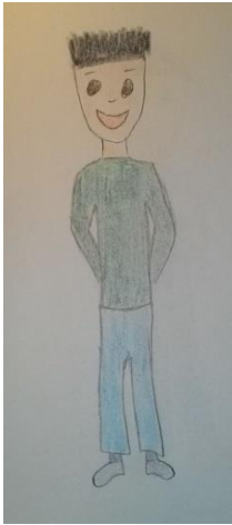
Blizanac normalne težine 9 (m)