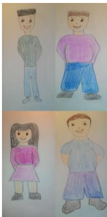
Troje pretile djece i jedno dijete normalne tjelesne težine 5