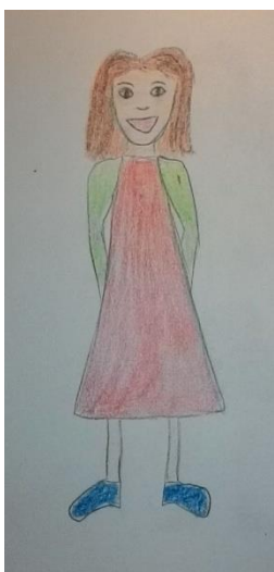
Blizanac normalne težine 4 (ž)