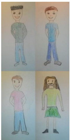
Četvero djece normalne težine 5