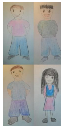
Troje pretile djece i jedno dijete normalne tjelesne težine 6