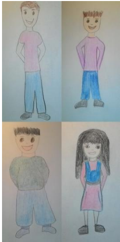
Troje djece normalne težine i jedno pretilo dijete 3