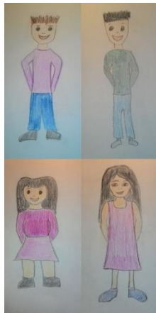
Troje djece normalne težine i jedno pretilo dijete 5