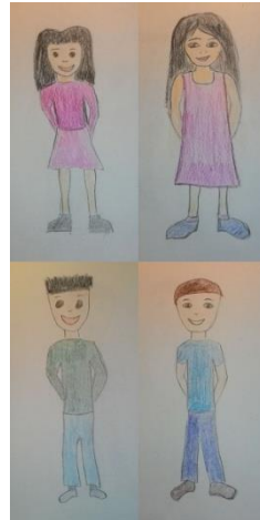
Četvero djece normalne težine 4