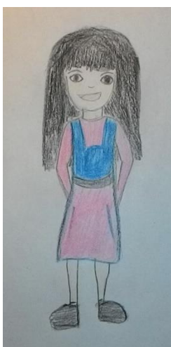
Blizanac normalne težine 5 (ž)