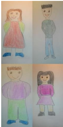
Troje pretile djece i jedno dijete normalne tjelesne težine 3