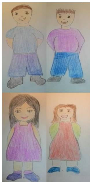
Četvero pretile djece 3