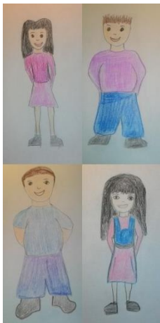
Dvoje djece normalne težine i dvoje pretile djece 5