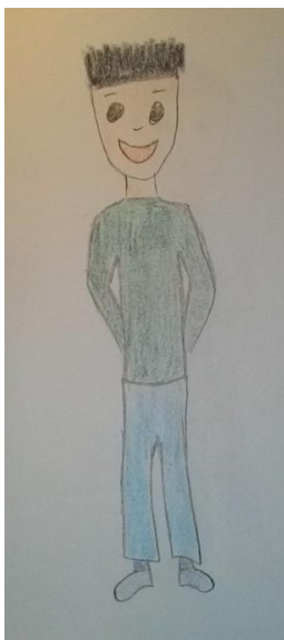
Slika 1. Primjer crteža dječaka – blizanca normalne tjelesne težine

Primjer jednog takvog para blizanaca nalazi se na Slici 1 i 2, a primjeri crteža ostalih parova blizanaca se nalaze u Prilogu 1.