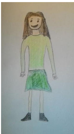
Blizanac normalne težine 3 (ž)