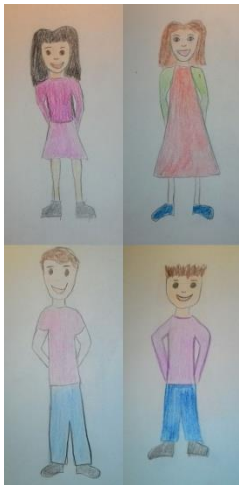
Četvero djece normalne težine 3