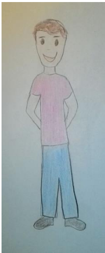
Blizanac normalne težine 6 (m)