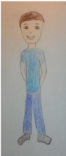
Blizanac normalne težine 7 (m)