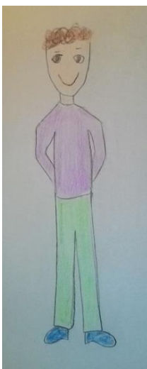
Blizanac normalne težine 8 (m)