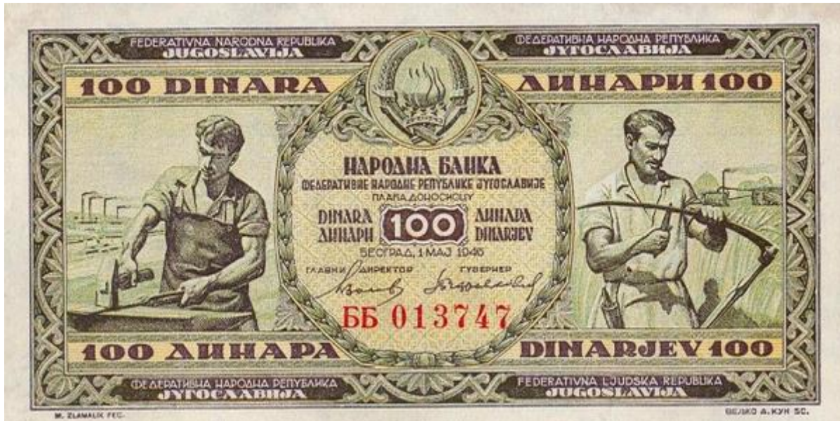
Slika 19: Avers novčanice od 100 dinara s prikazom radnika, izdana 01.05.1946. godine.

snage unutar tvornica, brodogradilišta, željezara čime ne slave isključivo radnički sloj društva, već direktno i gospodarski te industrijsko - tehnološki doseg.