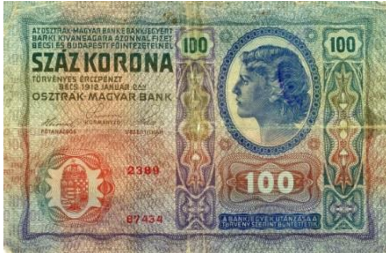
Slika 7: Novčanica 100 kruna, izdana 02.01.1912. godine.

financiranje novih materijala, moguće je da je zbog toga preuzeta austro - ugarska dizajnerska šablona te je ona tek u političkim obilježjima prilagođena novom kontekstu.