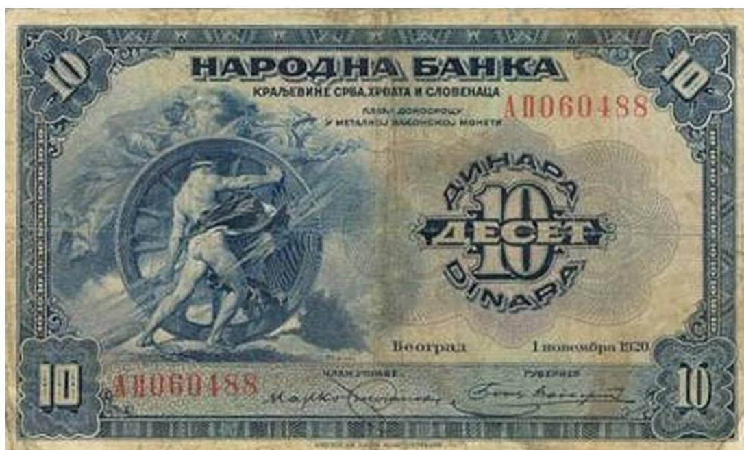
Slika 10: Avers novčanice 10 dinara izdana 01.11.1920. godine s motivom modernog Sizifa .

novčanice nosile ikonografiju sv. Jurja, zaštitnika Srbije te alegorijske figure kao što je moderni Sizif . 69