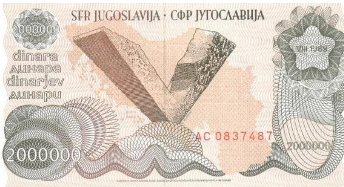
Slika 25: Revers novčanice 2000000 dinara s motivom spomenika u Kragujevcu, izdana u kolovozu 1989. godine.