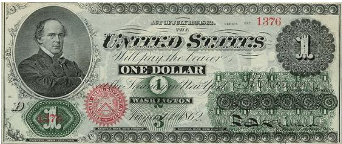
Slika 2: Novčanica $1 s likom Salomon P. Chasea, izdana 1862. godine.

i u likovnom smislu napraviti jasnu granicu između nacionalnih valuta kao i u njihovom raspoznavanju. U tom je smislu karakteristično uvođenje portreta državnika (predsjednika ili monarha), znanstvenika ili umjetnika koji su od iznimnog nacionalnog značaja i koji su samim time svojstven simbol nacionalnog napretka. Iako se ovakav odabir motiva može činiti kao jednostavan zadatak, on je zapravo krajnje promišljena metoda neposrednog komuniciranja kulturološkog napretka kao i političkih ciljeva države. Stoga je zanimljiva komparacija valuta dviju zapadnih progresivnih država engleskog govornog područja- Ujedinjenog Kraljevstva i Sjedinjenih Američkih Država koje su pribjele dvama djelomično različitim vizualnim rješenjima svojih moneta. Dok s jedne strane pratimo iznimno jasnu ikonografiju dolara, tj. isključivi odabir motiva predsjednika na aversu svih nominala, situacija s funtom je ipak nešto drukčija. Iako motiv kraljice jednoglasno zauzima avers svih nominala, na njihovom se reversu izmjenjuju motivi znanstvenika, umjetnika i filozofa koji zauzimaju funkciju indikatora civilizacijskog napretka i dosega. 18