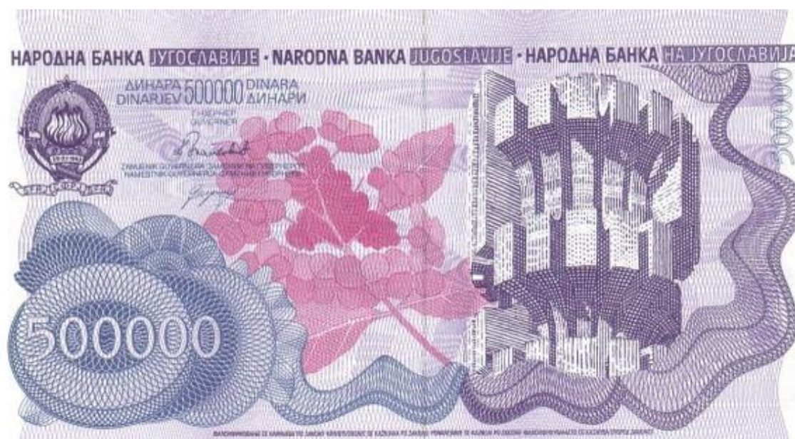
Slika 23: Avers novčanice od 500000 dinara s motivom spomenika na Kozari, izdana u kolovozu 1989. godine.