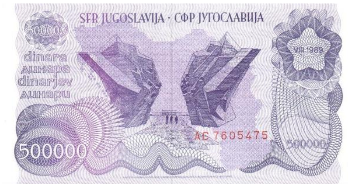
Slika 24: Revers novčanice od 500000 dinara s motivom spomenika na Sutjesci, izdana u kolovozu 1989. godine.