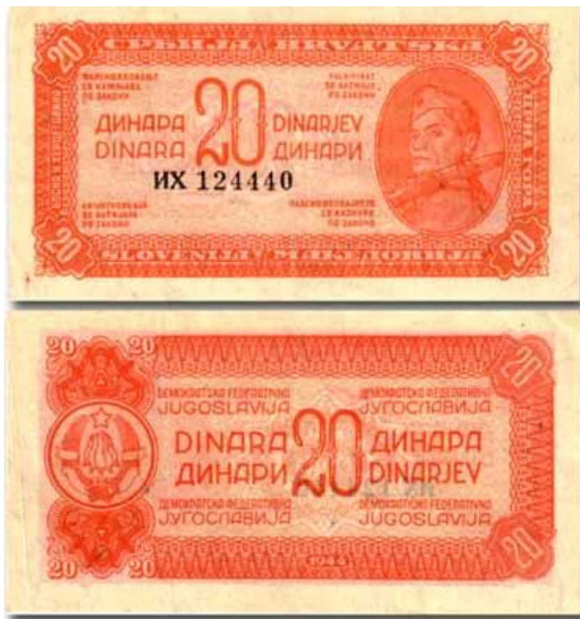
Slika 15: Novčanica od 20 dinara izdana 1944. godine.