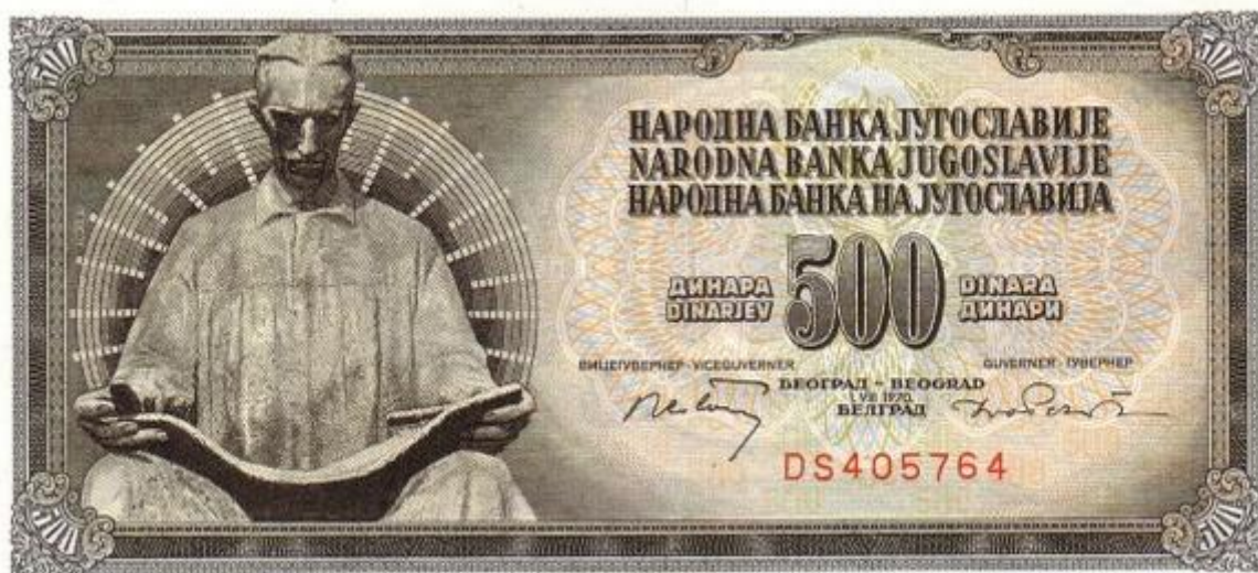
Slika 26: Avers novčanice od 500 dinara s motivom Nikole Tesle, izdana 01.08.1970. godine.