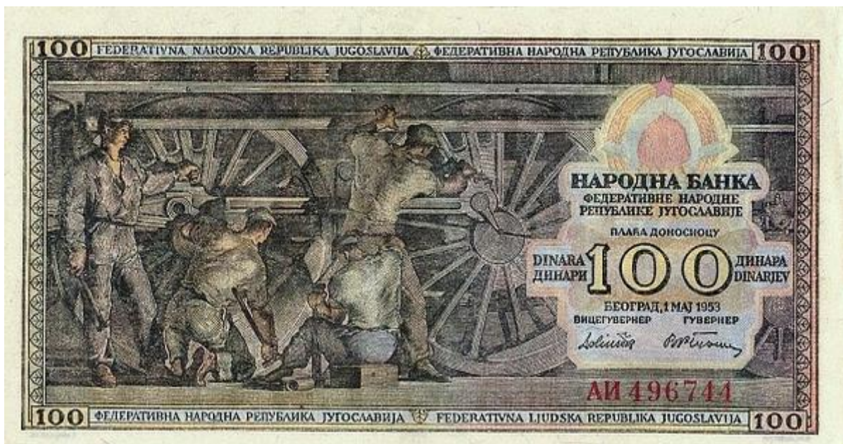
Slika 20: Avers novčanice od 100 dinara s prikazom radnika, izdana 01.05.1953. godine.