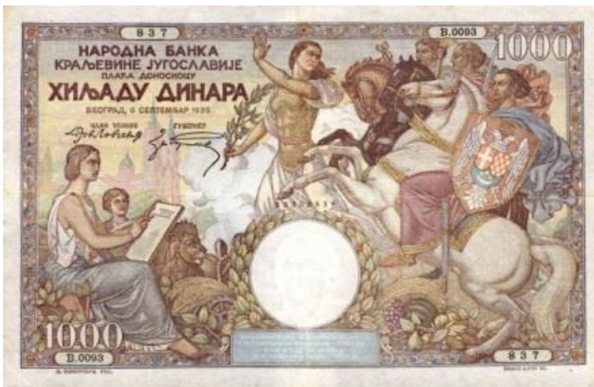
Slika 14: Avers novčanice od 1000 dinara s prikazom alegorijskih figura, izdana 06.09.1935. godine.