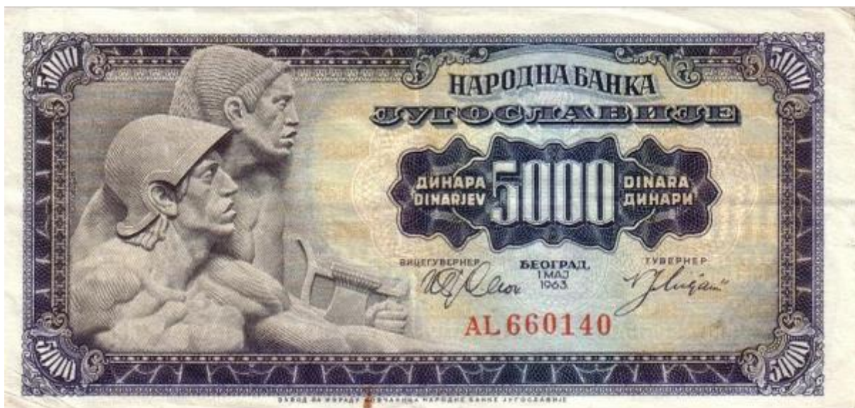
Slika 21: Avers novčanice od 5000 dinara s motivom Meštrovićeva reljefa, izdana 01.05.1963. godine.

Osamdesete godine obilježene su zaokretom u načinu dizajniranja. Novi trend kompjuterizacije je novčanicama pružio novi vizualni senzibilitet. 102 Kada 1980. umire Tito njegov se lik automatski simbolično postavlja na avers novčanice najviše vrijednosti od pet tisuća dinara. Tih godina, međutim, dolazi do velike krize u gospodarstvu i do inflacije. Posljedica toga je tiskanje novca „na brzinu“, dok se na revers kao simbole državnosti postavljaju spomenici revolucije. Ovakvim naglašavanjem herojske prošlosti socijalističke države se iscrpljuje jedan koncept te se simbolično želi pridati važnost onima koji su svojom žrtvom zaslužni za njezino stvaranje. Spomenici revolucije predstavljaju nostalgично sjećanje na vrijeme revolucije i borbe, međutim, za razliku od novčanica DFJ - e, ovdje je veći naglasak na državi kao simbolu jedinstva te njezinoj suverenosti. Označavaju se mjesta borbe kao memorija čime i same novčanice izborom ovakvih motiva ovjekovječuju borbu te dobivaju spomeničku ulogu.