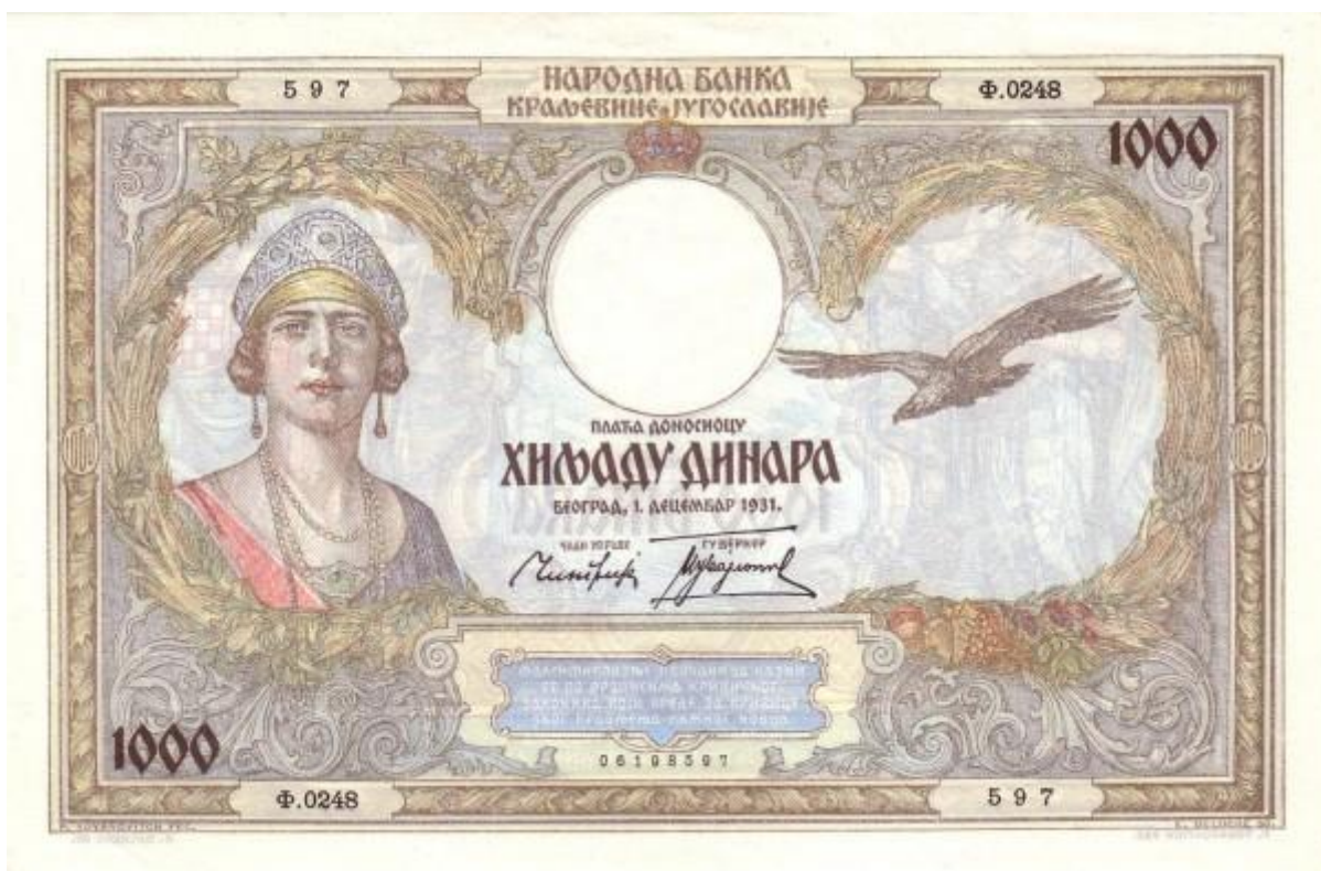
Slika 12: Avers novčanice od 1000 dinara s likom kraljice Marije, izdana 01.12.1931. godine.