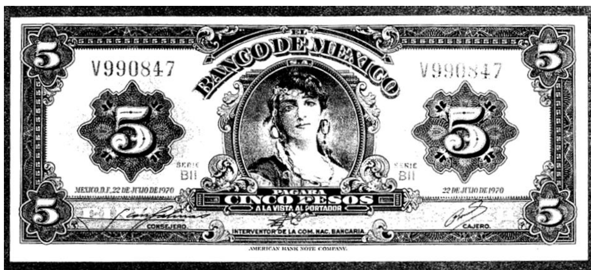
Slika 5: Novčanica od 5 pesosa s likom ciganke , izdana od strane meksičke Banke u periodu od 1951. do 1972. godine

S druge su strane meksički bankari pomoć u samom procesu tiskanja i materijaliziranja papirnog novca morali tražiti upravo od američkih vlasti. Banco de México je kao svoj proritetni cilj zadao regulaciju novčanih zaliha i kontrolu već postojećih novčanica koje su u opticaju, međutim, osnutkom nove države potrebna je nova vizualizacija državne monete koja će biti svjedokom promjena. S obzirom da meksički kontekst nije pružao tehnološke mogućnosti za vlastito tiskanje i dizajn novčanica, spas je tražen u New Yorku, u instituciji poznatoj kao American Bank Note Company. 49 Prva novčanica koja će se izdati nakon osamostaljenja će nositi vrijednost od 5 pesosa, a na njoj će ispod naziva Banco de Mexico u medaljonu biti prikazan portret žene u tradicionalnoj nošnji. Zbog njezinog karakterističnog oblikovanja i raskošnih odjevnih detalja nadjenut će joj nadimak gitana , odnosno ciganka . 50