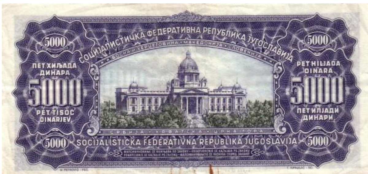
Slika 17: Revers novčanice od 5000 dinara s motivom Narodne skupštine u Beogradu, izdana 01.05.1963. godine.

Uspoređujući motive različitih nominala, primjećuje se pomalo šablonski izbor tema, tj. varijacije na izbor zadovoljnih i sretnih radnika- građana. Za razliku od prethodnih nestabilnih perioda uzrokovanih što ratnim zbivanjima, što unutarnjim političkim previranjima, razdoblje formiranja i trajanja FNRJ-a možemo okarakterizirati razdobljem mira. Upravo je to možebitni razlog svojevrsne „nemaštovitosti“ dizajnera koji se koriste realizmom u svrhu veličanja socijalizma. Na reversima novčanica su također prisutni motivi tvornica 92 ili obrađenih agrarnih površina, 93 međutim, prisutan je i motiv zgrade Narodne skupštine u Beogradu. 94 Iako su političke figure izuzete iz ikonografije novčanica, pojavu ovog motiva se može obrazložiti kao simbol države i državnog ustroja, a činjenicom da je ona prisutna na novčanici najveće nominale od pet tisuća dinara ukazuje na njezinu važnost te na postojanje hijerarhije u prikazima i izboru motiva.