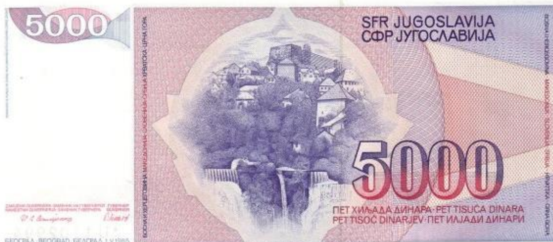
Slika 22: Revers novčanice od 5000 dinara s prikazom Jajca, izdana 01.05.1985. godine.