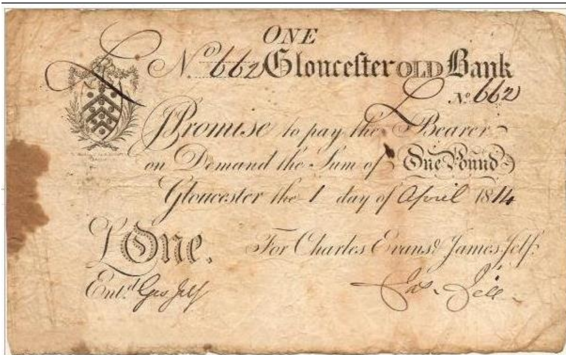
Slika 1: Novčanica £1 izdana 1814. godine od strane Gloucester Old Bank.

Britanske su banke za otprilike jedno stoljeće starije od američkih, odnosno od samih početaka američkog ekonomskog razvoja i tržišnog eksperimentiranja u modernom smislu. 10 Po osnivanju, američko se bankarstvo suočilo s dva velika problema. S jedne strane njegovi osnivači nisu imali konkretan uzor za pokretanje vlastite ekonomije, 11 međutim, puno je veći problem ležao u činjenici kako nova država nije imala konkretan kapital, ekonomske vrijednosti i resurse kojima bi se pokrenula nova valuta i samim time oformio novac koji će utjeloviti tu istu vrijednost. Nestabilnosti američke situacije pridonose sukobi oko pitanja valute, veličine nominala, pitanja centralne banke kao i bankarskog poslovanja općenito, međutim, spas nakratko pronalaze u ulaganjima koja sa sobom donose Francuzi. 12 Amerikanci ipak pronalaze rješenje u oponašanju britanskog modela bankarstva, međutim, bankarski sustav Amerike je morao biti zahvaćen određenim promjenama, posebice u teritorijalnom i