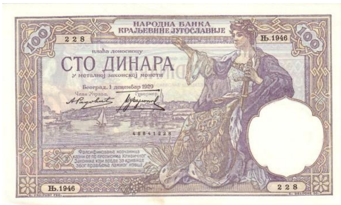
Slika 11: Avers novčanice od 100 dinara izdane 01.12.1929. godine.

Pitanje jest koliko su novčanice dinara podsvjesno utjecale na građane s obzirom na još tri valute koje su istodobno bile u opticaju. Za pretpostaviti je kako je politička svijest stanovništva bila niska i uglavnom orijentirana prema državi - sastavnici Kraljevine SHS.