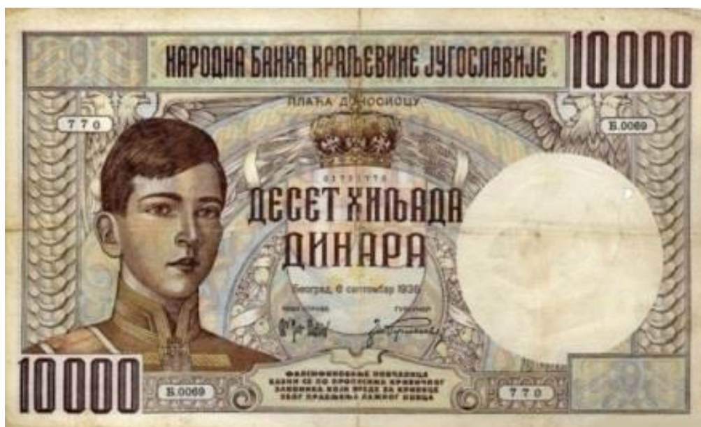
Slika 13: Avers novčanice od 10000 dinara s likom kralja Petra Karadjordjevića, izdana 06.09.1936. godine.