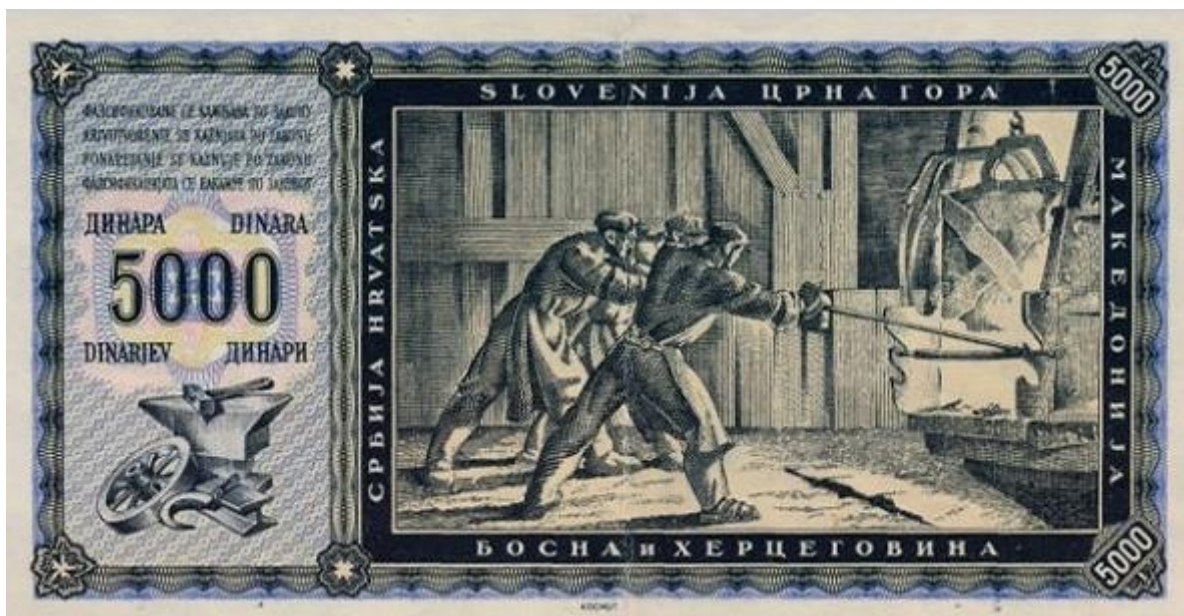
Slika 18: Avers novčanice od 5000 dinara s prikazom radnika u željezari, izdana 01.11.1950. godine.

Dokaz kako je narodni duh bio sve više prisutan i u redovima umjetnika ne vidi se samo u aktivnostima grupa Zemlja ili u antifašističkim tendencijama grupe Život , već i u činjenici kako je čak sto i šest umjetnika kao rezultat široke prijeratne platforme rada i djelovanje Komunističke partije službeno pripadalo NOB - u. 97 Pitanje je u kojoj su mjeri ti isti umjetnici svoj likovni rad shvaćali i ciljano provodili kao politički, a koliko kao društveni angažman te jesu li pripadali spomenutim grupacijama kako bi postali prihvaćenima te kroz institucionalizaciju aktivnosti olakšali vlastitu egzistenciju.