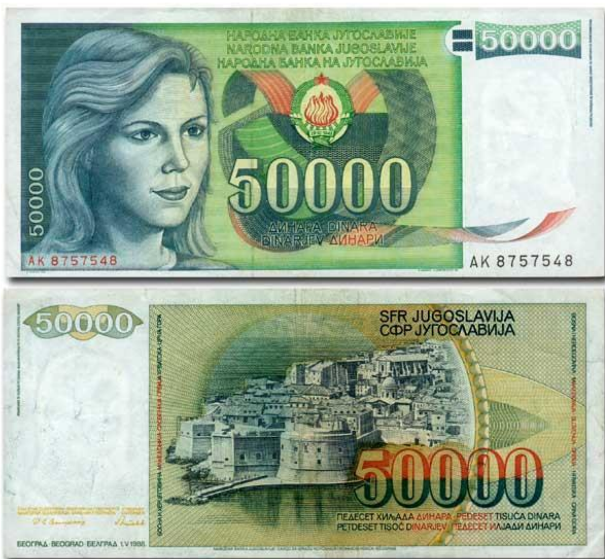
Slika 27: Novčanica od 50000 dinara izdana 01.05.1988. godine.