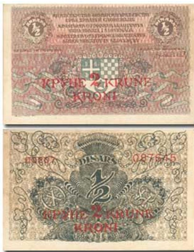
Slika 9: Prikaz novčanice 0,5 dinara sa žigosanom vrijednosti u krunama. Na oznaci je vidljiv omjer vrijednosti valuta 1:4. Novčanica je izdana 01.02.1919. godine.

Prve su novčanice u novoj državi nosile karakterističan trojezični natpis na ćirilici (Srbija) te na latinici (Slovenija i Hrvatska) što je bila nužna prilagodba s obzirom na kulturološki i nacionalni pluralizam unutar države. Vizualnost novčanica je pružala dobru priliku za utvrđivanje postojanja novog režima. Novi francuski dizajn je pokazao izrazito visoku smjelost u iskorištavanju strogo normiranih proporcija novčanica. Iako je bogata bordura zauzimala široko postavljen okvir prikaza, njezina se elegancija uklapa i ne iskače od ostatka motiva prisutnih u dizajnu. Naime, zadatak grafičara nije bio lagan s obzirom da novčanice u ovom periodu sadrže izrazito malo praznog prostora i moraju postići uravnoteženost svih motiva - državnih oznaka, višejezičnih natpisa, alegoričnih figura i veduta koje su čest motiv. Kako su se tek uspostavljali temelji nove države, motivi koji su se koristili mahom su aludirali na napredak i prosperitet. Tako su, primjerice, najpoznatije