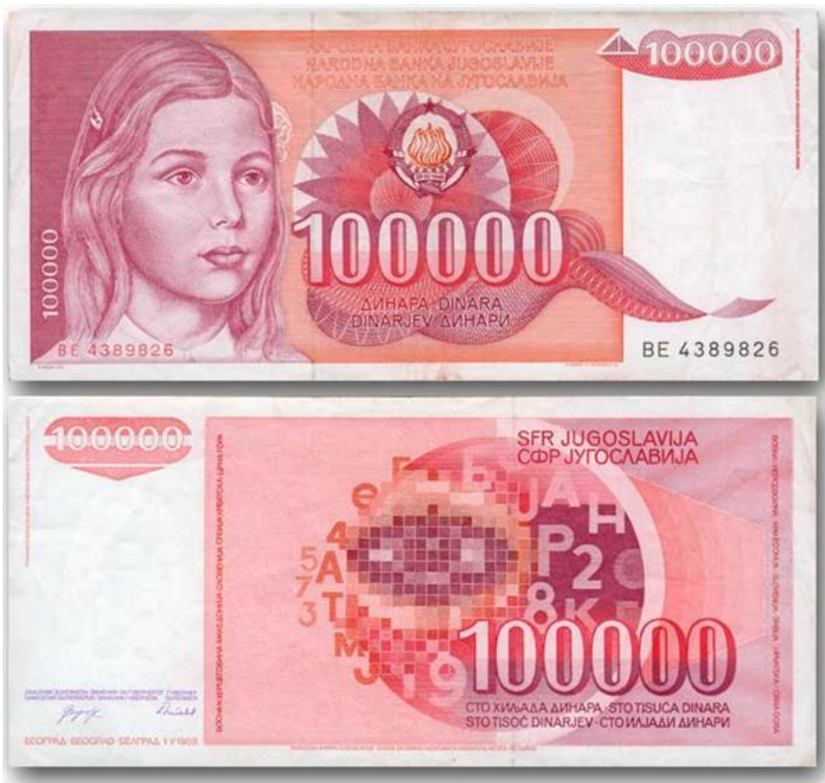
Slika 28: Novčanica 100000 dinara izdana 01.05.1989. godine.