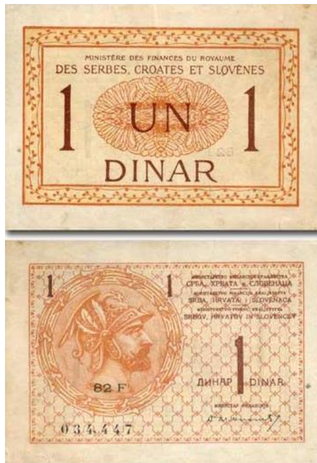
Slika 8: Novčanica 1 dinara, izdana 1919. godine s francuskim tekstom.