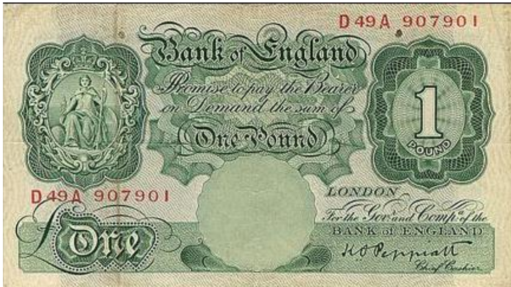
Slika 3: Novčanica £1 izdana 1928. godine koja je bila u upotrebi do 1948. godine.