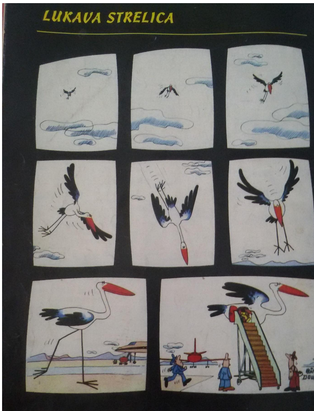
Prilog 6. Primjer stripa bez teksta iz časopisa Mak 53