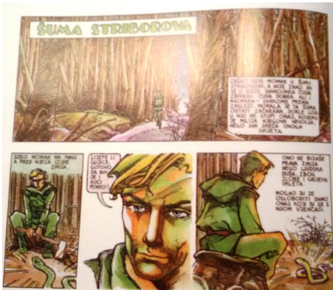
Prilog 5. Stranica iz stripa Priče iz davnine Krešimira Zimonića nastalog prema Pričama iz davnina Ivane Brlić-Mažuranić 52 (str. 12)