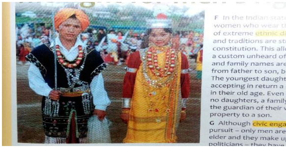
Slika 2. The fight for men's right