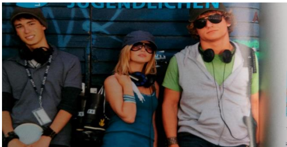
Slika 4. Isključivo bijelci na fotografijama