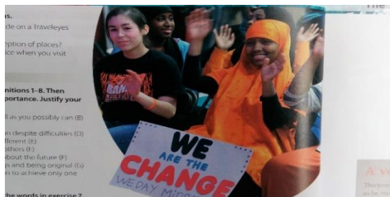
Slika 1. We are the change

Također, u udžbeniku se nalaze brojne fotografije pripadnika drugih kultura pri čemu niti jedna kultura nije stavljena u prvi plan, a neki od primjera su i priloženi (slika 1 i 2):