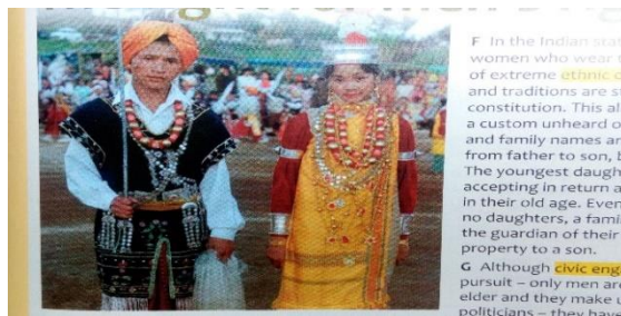
Slika 2. The fight for men's right