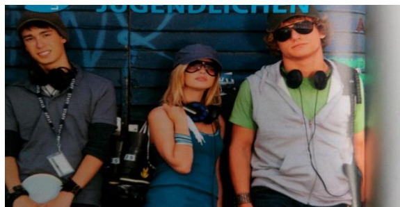
Slika 4. Isključivo bijelci na fotografijama

Dakako da je udžbenik prilagođen populaciji koja će ga koristiti, no, ostaje otvoreno pitanje šalje li se time indirektna poruka. Sve u svemu, u trećem razredu gimnazije postavljaju se razna očekivanja pred učenike koji trebaju biti motivirani na sudjelovanje u zajednici, usvojiti sociokulturna orijentacijska znanja te ih povezivati s vlastitom kulturom. Također, od