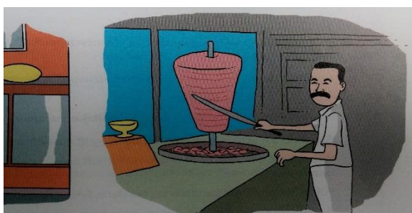
Slika 3. Deutschlands zuwanderer

Nasuprot tome stoji činjenica kako se na fotografijama u preostalim poglavljima udžbenika prikazuju dominantno i isključivo bijelci (slika 4).