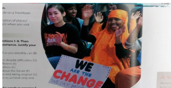
Slika 1. We are the change