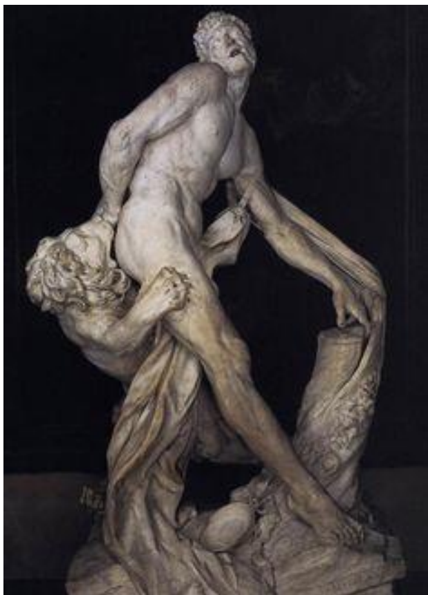
Slika 11. Pierre Puget, Milon iz Crotone, Pariz, David, 1671.-1682. godina

Početak Pugetove kasne faze obilježen je njegovom najboljom mramornom skulpturom Milon iz Crotone koju radi za park kraljevske palače Versailles. 89 Pugetova kompozicija snažno dočarava unutaraju dramu junaka kojeg napada lav dok mu je ruka zaglavljena u panju. Zvijer napada Milona otraga i zabada mu svoje pandže u bedro, a on se izvija i vrišti od bola. Skulptura Milon iz Crotone može se usporediti s Berninijevim Davidom (slika 12), ali je jasno vidljivo kako je Pugetova kompozicija suzdržanija od Berninijeve.