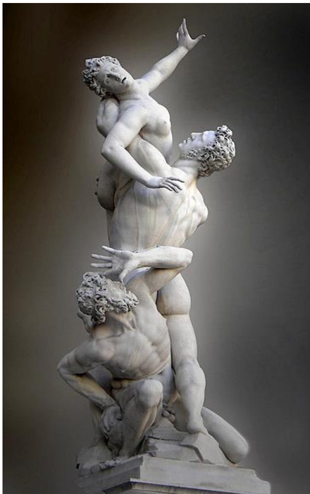
Slika 7. Giambologna, Otmica Sabinjanke , Firenca, 1574.-1582. godina

Skulptura Otmica Perzefoneje prema nekim svojim karakteristikama izrađena prema Giambologninom modelu. Za razliku od višedimenzionalne kvalitete Giambolognine Otmice Sabinjanke (slika7), Girardonova Perzefona djeluje, sukladno ideji da se skulpturi da jedno jako očište, jednodimenzionalno, poput kakvog velikog reljefa. 61 Stoga je ona po kompoziciji i ideji međusobnog odnosa likova bliža Berninijevom istoimenom djelu iz Galerije Borghese u Rimu, nastalom 1620. godine.