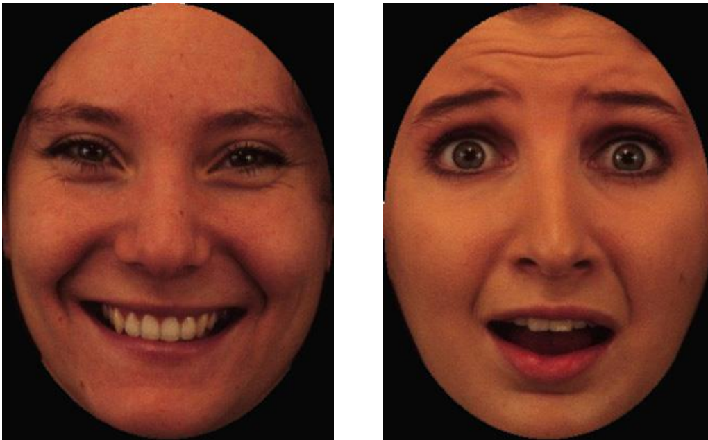
Slika 1. Primjer lica koje izražavaju sreću i strah.

Za potrebe istraživanja korišteno je 100 slika iz baze, koje izražavaju emocije pri čemu je 7 probnih podražaja te je ostalih 93 eksperimentalnih. Od eksperimentalnih podražaja, test sadrži po 10 fotografija za svaku od 7 emocija (strah, ljutnja, gađenje, sreća, tuga, iznenađenje i neutralno lice). Preostale 23 fotografije su blend , što znači da odgovori ispitanika u validacijskoj fazi Calva i Lundqvista (2008) nisu bili jednoznačni za ta 23 podražaja (Švegar, 2016). Prvih 70 fotografija odabrano je prema točnosti, pri čemu je zadržano 5 muških i 5 ženskih izraza s najvećom točnošću prepoznavanja (od 90 do 100% za pojedine podražaje). Blend podražaji su slike s najmanjom točnošću, odnosno najmanjom jednoznačnošću odgovora (točnost odgovora se kreće od 43 – 68%). Odgovori na tim česticama nisu bilježeni kao točni i netočni, jer se radi o mješavini više emocija, nego su odgovori korišteni kako bi provjerili smjer interpretacije, odnosno razlikuje li se interpretacija tih podražaja u različitim fazama.