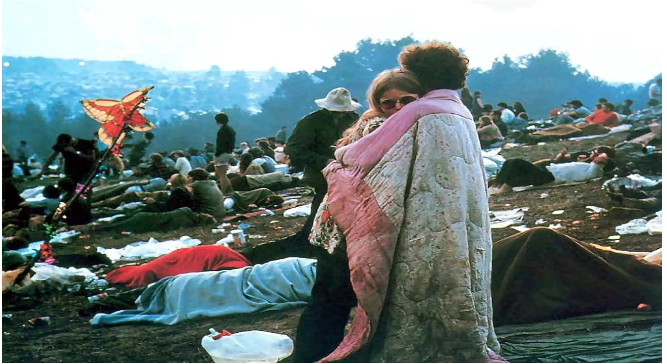
najpoznatija fotografija para sa Woodstocka