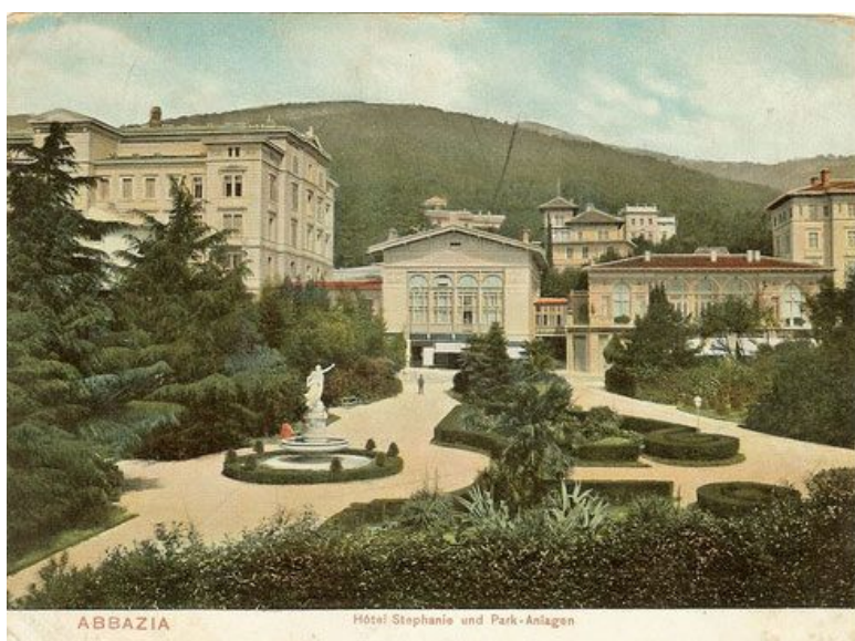
Slika 8. Park Sv. Jakova