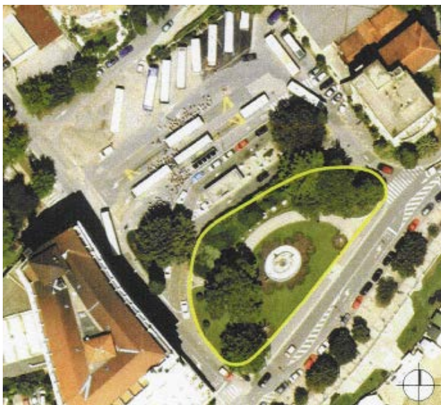
Slika 11. Orto-foto snimak perivojnog trga na Slatini, preuzeto: KORALJKA VAHTAR-JURKOVIĆ, Opatijski gradski perivoji, Rijeka: Glosa; Zagreb: Arhitektonski fakultet Sveučilišta, 2010.