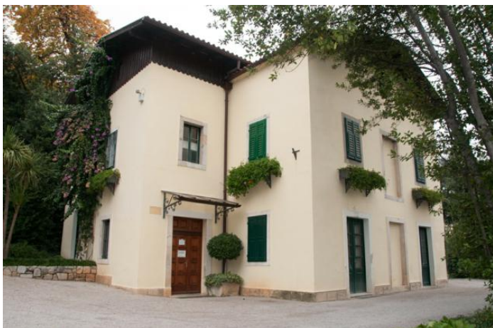
Slika 5. Švicarska kuća