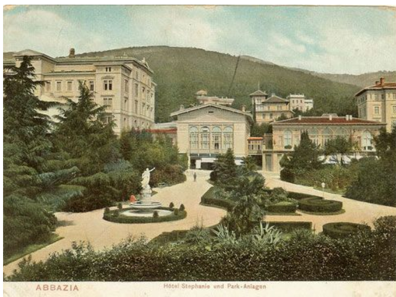
Slika 8. Park Sv. Jakova, preuzeto: http://www.opatija.net/hr/atrakcije/park-sv-jakova-i-park-angiolina , 06.06.2017.