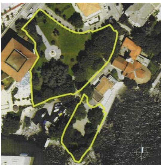
Slika 6. Orto-foto snimak perivoja Sv. jakova, preuzeto: KORALJKA VAHTAR-JURKOVIĆ, Opatijski gradski perivoji, Rijeka: Glosa; Zagreb: Arhitektonski fakultet Sveučilišta, 2010.