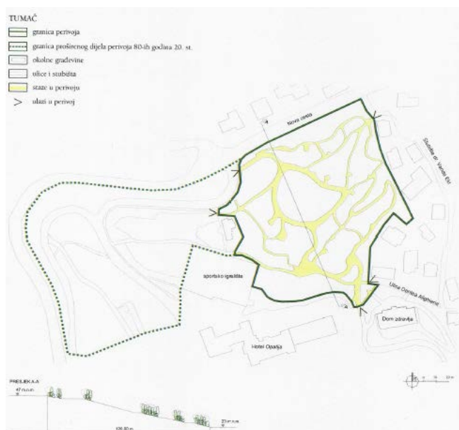
Slika 10. Perivoj Margarita, preuzeto: KORALJKA VAHTAR-JURKOVIĆ, Opatijski gradski perivoji, Rijeka: Glosa; Zagreb: Arhitektonski fakultet Sveučilišta, 2010.