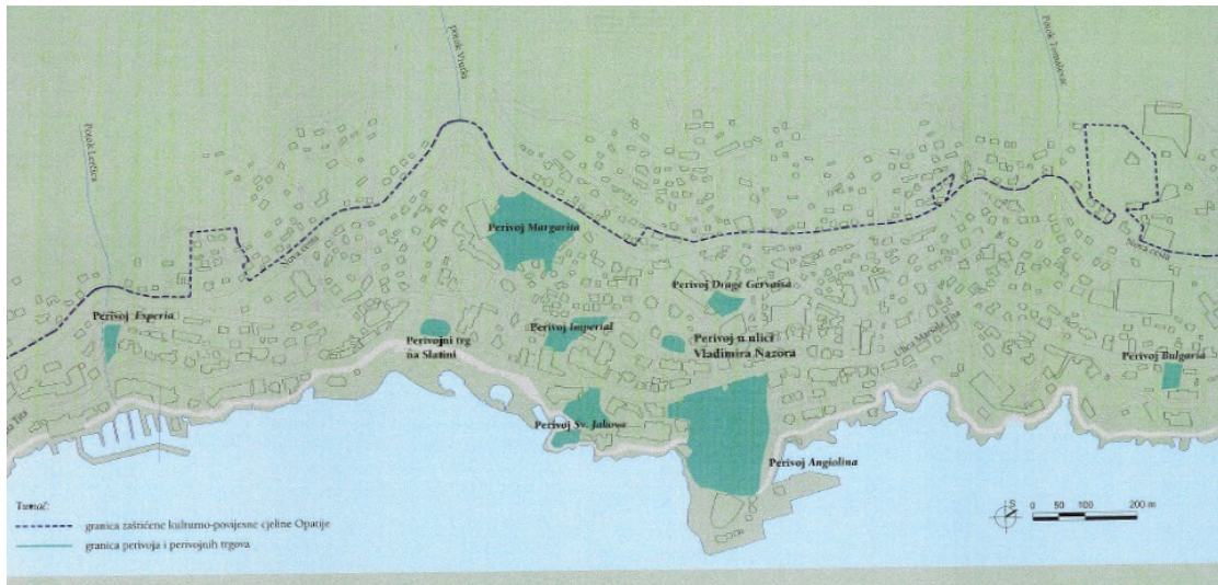
Slika 1. Perivoji i perivojni trгови u Opatiji, preuzeto: KORALJKA VAHTAR-JURKOVIĆ, Opatijski gradski perivoji, Rijeka: Glosa; Zagreb: Arhitektonski fakultet Sveučilišta, 2010.