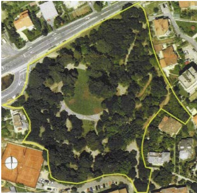
Slika 9. Orto-foto snimak perivoja Margarita, preuzeto: KORALJKA VAHTAR-JURKOVIĆ, Opatijski gradski perivoji, Rijeka: Glosa; Zagreb: Arhitektonski fakultet Sveučilišta, 2010.