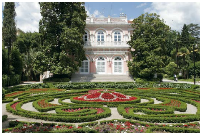
Slika 4. Vila Angiolina.