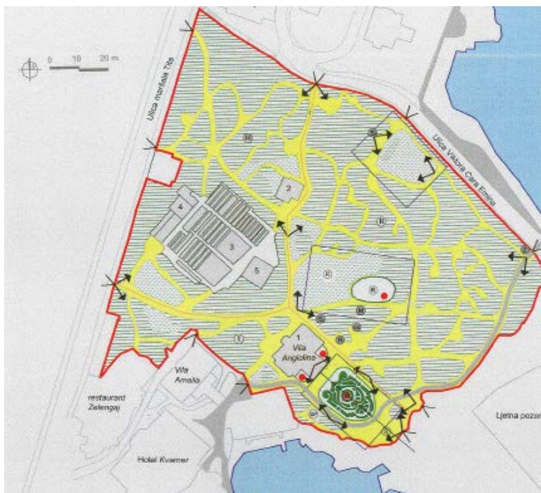
Slika 3. Perivojna kompozicija perivoja Angiolina, preuzeto: KORALJKA VAHTAR-JURKOVIĆ, Opatijski gradski perivoji, Rijeka: Glosa; Zagreb: Arhitektonski fakultet Sveučilišta, 2010.