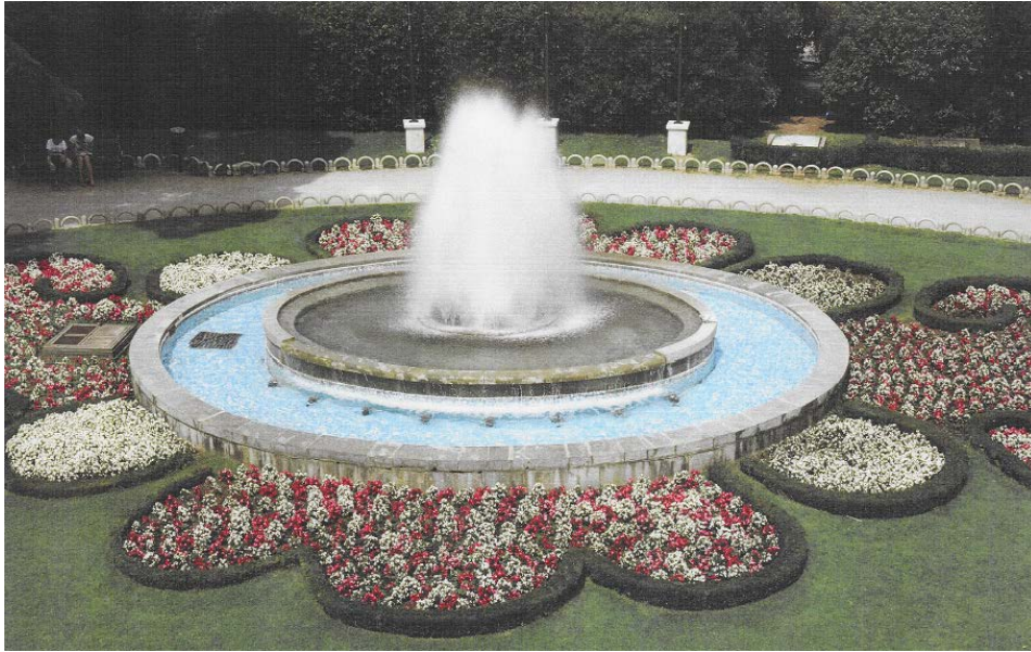
Slika 13. Perivojni trg na Slatini, preuzeto: KORALJKA VAHTAR-JURKOVIĆ, Opatijski gradski perivoji, Rijeka: Glosa; Zagreb: Arhitektonski fakultet Sveučilišta, 2010.