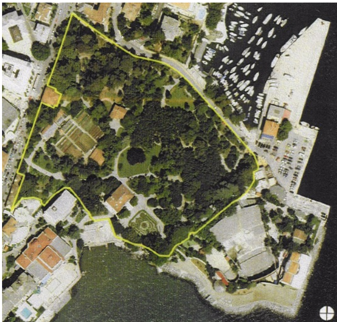
Slika 2. Orto-foto snimak perivoja Angiolina, preuzeto: KORALJKA VAHTAR-JURKOVIĆ, Opatijski gradski perivoji, Rijeka: Glosa; Zagreb: Arhitektonski fakultet Sveučilišta, 2010.