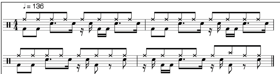
Slika 1. Notni prikaz amen break-a

Tonybee smatra kako je »selekcioniranje, editiranje i kombiniranje glasova mjesto u kojemu se pojavljuje kreativnost glazbenog stvaratelj« (Tonybee 2003:42). Tschmuck smatra da je inovacija rezultat kreativnog djelovanja kao "iznošenja novih kombinacija", ekonomskih mogućnosti i kompetitivne eliminacije starih kombinacija (Tschmuck 2003:129).