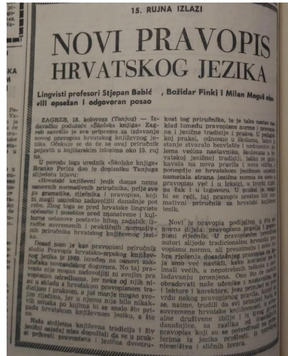
Prilog 2, Novi list , broj 95, 19. kolovoz 1971.