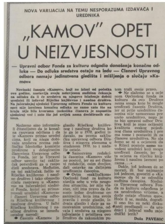
Prilog 3, Novi list , broj 118, 20. svibanj 1971.