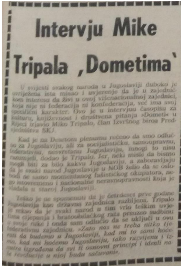
Prilog 1, Novi list , broj 74, 29. ožujka 1971.