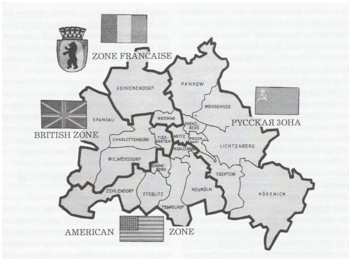
Karta 1. Četiri okupacijske zone unutar Berlina

Velika trojica će se još jednom sastati, a kao mjesto konferencije dogovoren je Potsdam, gradić jugozapadno od Berlina. Konferencija je trajala od 17. srpnja do 2. kolovoza, a njoj se trebalo odlučiti o konkretnim savezničkim akcijama prema poraženoj Njemačkoj, što se nije uspjelo dogovoriti na Jaltskoj konferenciji. 27 Sastav Velike trojke je bio promijenjen: Harry Truman zamjenjuje Franklina D. Roosevelta, koji je u međuvremenu umro, te Clement Athlee koji zamjenjuje Winstona Churchilla. Jedino je Staljin sudjelovao na sve tri konferencije. Francuska nije sudjelovala niti na Jalti niti u Potsdamu. 28 Glavna tri principa, koja su se trebala provesti pod savezničkom okupacijom, uključivala su denacifikaciju njemačkog društva, demilitarizaciju njemačke vojske te demokratizaciju društva, iako se točno nije znalo što taj pojam označava i stvarao je nedoumice među Saveznicima. 29 Osim toga, dogovorena je deindustrijalizacija i ukidanje moćnog Koncerna 30 , ukidanje Nacionalsocijalističke radničke stranke (NSDAP) te iznosi vojnih reparacija. Dotadašnji cilj više nije bila zajednička borba