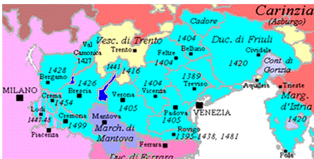
Karta 2. Sjevernotalijanski prostor pod Venecijom na kraju 15.st. 12

Karta prikazuje Venecijansko kopno, terrafermu, na kraju 15.st. Iz karte je jasno vidljivo koliki je bio raspon sjevernotalijanskog kopna pod Venecijom. Najranije osvojena područja su ona u direktnom zaleđu Venecije (Treviso) i na suprotnoj strani zaljeva (Rovigo). Venecija se nakon toga u kratkom vremenskom roku proširila na sjever do granice s Tirolom i na Jug do granice s Mantovom i Ferrarom. Posljednja osvojena područja su ona najudaljenija, prostor granice s Milanom, Furlaije i današnja hrvatska obala.