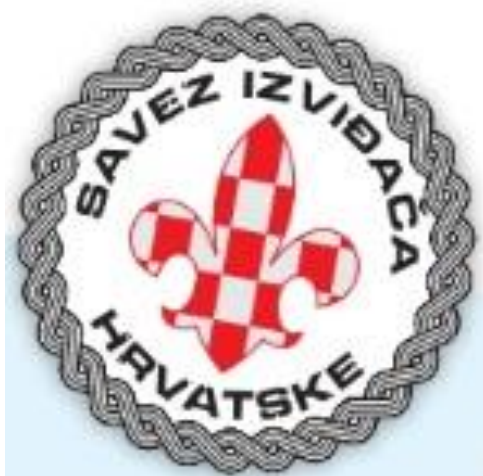
Slika 4. Znak SIH-a

Jedan od bitnijih segmenta izviđačkog života su izviđački zakoni. Od svakog člana i volontera skautskog pokreta očekuje se da će poštivati i živjeti prema zakonima izviđača.