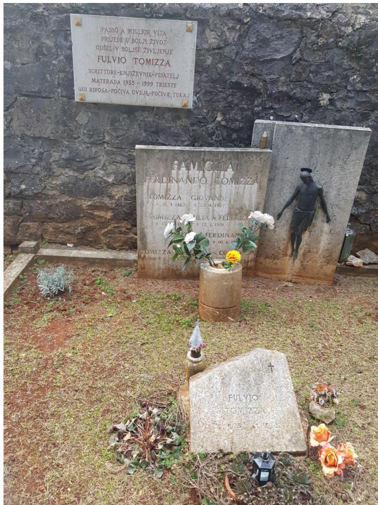
Fulvio Tomizza muore nel 1999 a Trieste ed è seppellito nella parrocchia di Materada

nel 1981 La finzione di Maria e tre anni dopo Il male viene dal Nord che parla, come il romanzo precedente dei temi legati alla Controriforma. Fa uscire un volume di racconti Ieri un secolo fa e un romanzo Gli sposi di via Rossetti nel 1986. Fino al 1989 pubblica altri tre lavori: Quando Dio uscì di chiesa , Poi venne Chernobyl e L'eredità veneziana . Seguono le Fughe incrociate (1990), I rapporti colpevoli (1993), L'abate Roys e il fatto innominabile (1994), Alle spalle di Trieste (1995), Dal luogo del sequestro (1996), Franziska (1997) e Nel chiaro della notte (1999). 40 Sono importanti anche le opere pubblicate postume come La visitatrice (2000), i racconti nel libro La casa col mandorlo (2000) e infine Il sogno dalmata (2001); tutte e tre le opere si possono rispecchiare nella frase “alle spalle di Trieste” perché è questo che cerca di fare con esse, allontanarsi da Trieste in cerca di radici ancora più antiche e profonde come con Il sogno dalmata . 41