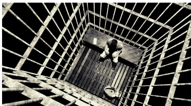
Slika 5. Hartigan sjedi u ćeliji (kadar iz filma)