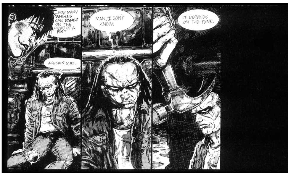
Slika 7. Posljednja tri kadra u kojima se pojavljuje T-Bird