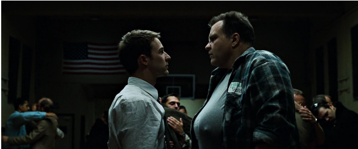
Slika 2. Pripovjedač i Bob u filmu Klub boraca

za njih postati Brad Pitt u nekoj retro košuljici i crvenoj kožnoj jakni, dok će Marla biti Helena Bonham Carter razbarušene crne kose s cigaretom u ruci.