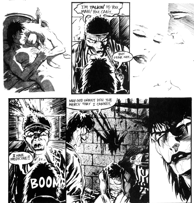
Slika 8. Razlika u kadrovima s analepsama na Shelly i kadrova koji se tiču Ericove osvetničke misije

zamjetljivi ili se pak gube (slika 5). U takvim kadrovima je podloga pak najčešće izostavljena, što pridonosi osjećaju snovitosti prizora, za razliku od detaljiziranih pozadina u prikazima grada koje stvaraju dojam realističnosti.