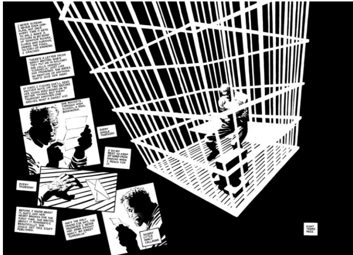
Slika 6. Hartigan sjedi u ćeliji i komentira Nancyina pisma (strip)

intermedijalni postupci prilagodbe stripa za film stoga detaljnije demonstrirati na sceni koja slijedi nakon prvog navedenog primjera (slike 4 i 5). Riječ je, dakle, i dalje o Hartiganu koji sjedi u svojoj ćeliji, koji ovog puta pripovijeda o Nancyinim pismima (slika 6).