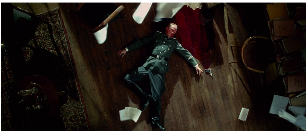
Slika 1. Nacistički zapovjednik nakon oslobađanja Dachaua

S druge strane, u filmu je taj događaj predložen i slikovnim i zvukovnim kodom. Pritom je odabir detalja koji će se prikazati na filmu u procesu adaptiranja uvjetovan ne samo opisom iz predloška, već i odlukama redatelja, snimatelja, montažera, kostimografa i ostalih ljudi koju sudjeluju u procesu stvaranja filma. Naime, iako su ključni detalji verbalnog opisa Teddyjeve analepse na nacističkog zapovjednika prikazani na filmu - Mahlerova skladba koja svira dok zapovjednik leži na podu u svom uredu (slika 1) i Teddy koji ga promatra dok vojnici pretresaju sobu – neki su i izostavljeni, poput, primjerice, Teddyja koji uzima fotografiju iz zapovjednikova krila.