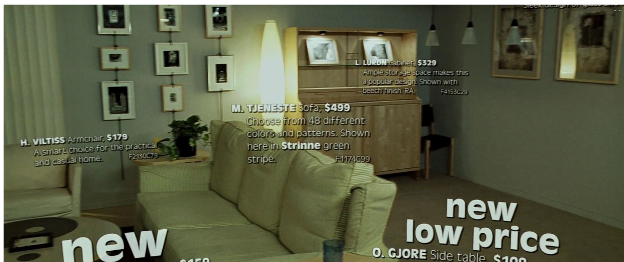
Slika 3. Kadar iz filma Klub boraca koji podsjeća na katalog

filmsku adaptaciju čini više postmodernističkom i eksperimentalnijom od romana. Eksperimentiranje s medijem filma posebno je uočljivo u sceni u kojoj dizajnerski predmeti iz Pripovjedačeva stana ne samo da su prikazani, već je emocionalni efekt koji imaju na publiku još dodatno pojačan tekstovima s imenom, cijenom i opisom proizvoda kako bi podsjećali na katalog (slika 3).