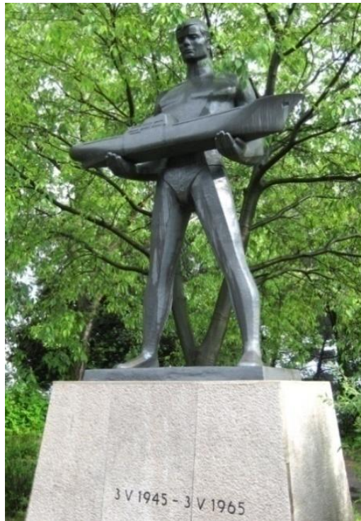
Slika: Spomenik brodograditeljima 3. maja, Vinko Matković, 1965.

Spomenik brodograditeljima spomenik je ljudskom radu i jednoj uspješnoj proizvodnji projektantskog, ali i tehničkog dostignuća unatoč problemima koji su se nizali tijekom godina. 57