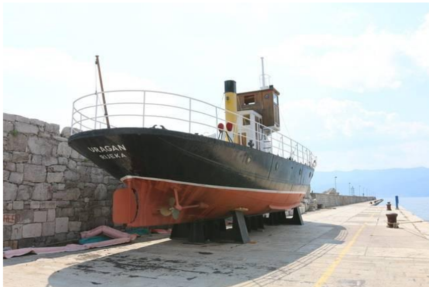
Slika: Parobrod Uragan na riječkom lukobranu 2014.

Parobrod Uragan obnovljen je 2004. godine te 2005. godine izložen uza zgradu Lučke uprave i Luke Rijeka kao vrijedan izložak riječke pomorske baštine. 25 Prostor oko broda ogradio se i nije bio postavljen nikakav informativni natpis. 26 Godine 2005. raspravljalo se o drugim lokacijama za njegovo javno postavljanje, no konačan dogovor s Lučkom upravom se, nažalost, nije mogao postići te je brod ostao smješten uz bunker, a ograda, koja ga je okruživala, onemogućavala je stanovništvu bliži pristup. 27