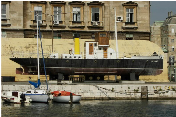
Slika: Parobrod Uragan u riječkoj luci kod bunkera 2005.

Parobrod Uragan obnovljen je 2004. godine te 2005. godine izložen uza zgradu Lučke uprave i Luke Rijeka kao vrijedan izložak riječke pomorske baštine. 25 Prostor oko broda ogradio se i nije bio postavljen nikakav informativni natpis. 26 Godine 2005. raspravljalo se o drugim lokacijama za njegovo javno postavljanje, no konačan dogovor s Lučkom upravom se, nažalost, nije mogao postići te je brod ostao smješten uz bunker, a ograda, koja ga je okruživala, onemogućavala je stanovništvu bliži pristup. 27