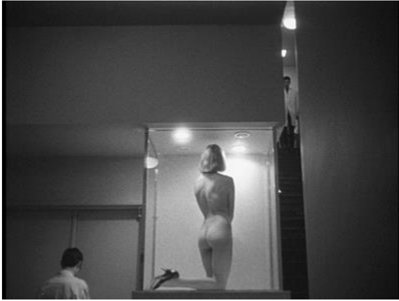
Slika 9 Alphaville