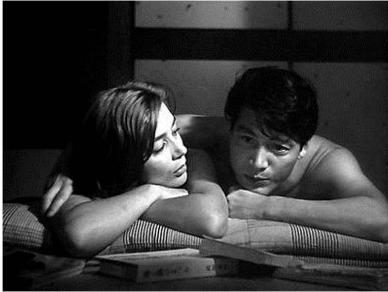
Slika 11: Hiroshima mon amour