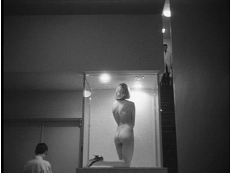
Slika 9 Alphaville