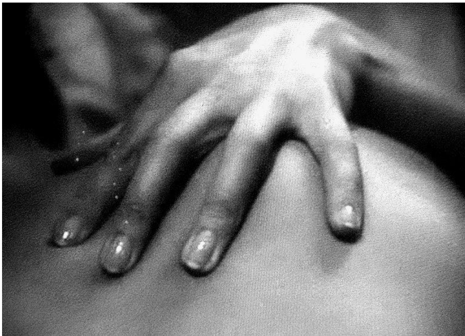
Slika 12: Hiroshima mon amour