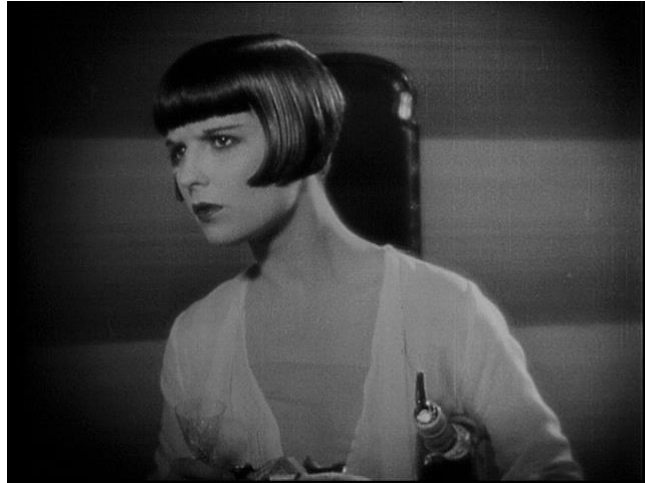
Slika 3: Louise Brooks